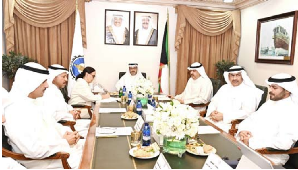
الشيخ عبد الله سالم العلي الصباح مترسماً الاجتماع التنسيق

فحن جميعاً نعمل ونبذل الجهود من أجل تحقيق المزيد من الإنجازات والطموحات، داعياً المواطنين للمشاركة سواء في حملات الترشيد أو غيرها من الحملات التوعوية انطلاقاً من المسؤولية الوطنية والاجتماعية.