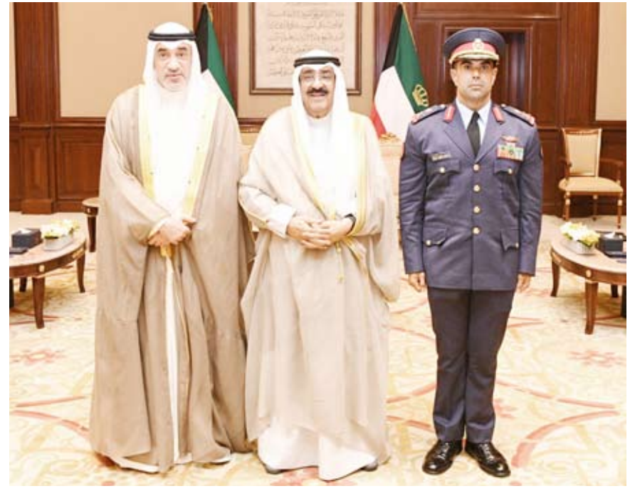
سمو أمير البلاد يستقبل الشيخ فهد اليوسف والشيخ صباح جابر الأحمد الصباح

استقبل صاحب السمو أمير البلاد الشيخ مشعل الأحمد، بقصر بيان، صباح أمس، النائب الأول لرئيس مجلس الوزراء ووزير الدفاع ووزير الداخلية الشيخ فهد اليوسف، حيث قدم لسموه نائب رئيس الأركان العامة للجيش اللواء ركن طيار الشيخ صباح جابر الأحمد الصباح، وذلك بمناسبة تعيينه بمنصبه الجديد. بعث صاحب السمو أمير البلاد الشيخ مشعل الأحمد، ببرقية تعزية إلى أخيه الرئيس حسن شيخ محمود رئيس جمهورية