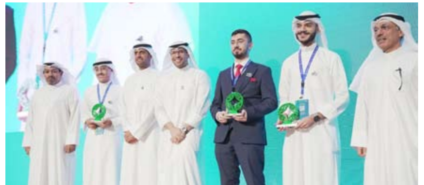
فيسل السريع مع الفائزين بجائزة بيتك للاستدامة

شارك بيت التمويل الكويتي "بيتك" في حفل تتويج مشاريع تخرج طلبة كلية الهندسة والبتترول بجامعة الكويت ضمن معرض التصميم الهندسي الـ46، وذلك من خلال جائزة "بيتك للاستدامة البيئية" المقدمة لأفضل المشاريع الهندسية الأكثر تركيزاً واهتماماً بالبيئة والاستدامة، حيث تم منح الجائزة لطلبة أصحاب المشاريع الفائزة بالمرتين الأولى والثانية. وتعتبر الجائزة التي أطلقها "بيتك" للمرة الثالثة على التوالي، امتداداً لسلسلة من المبادرات التي تهتم بالتعليم والبيئة ضمن استراتيجية الاستدامة المتكاملة وضمن إطار حملة Keep it Green المعنية بدعم المبادرات