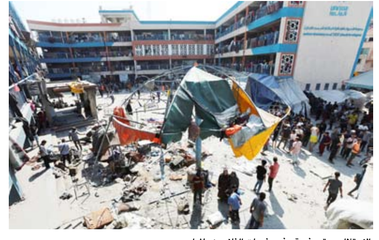
الاحتلال مستمر في قصف مخيمات النازحين بالمدارس