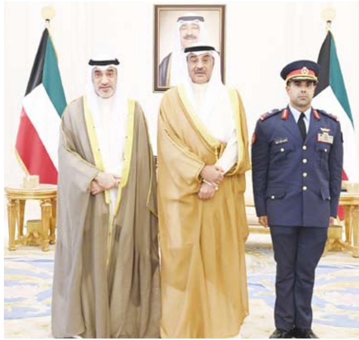
سمو ولي العهد يستقبل الشيخ فهد اليوسف والشيخ صباح جابر الأحمد الصباح

استقبل سمو ولي العهد الشيخ صباح الخالد، بقصر بيان، صباح أمس، النائب الأول لرئيس مجلس الوزراء ووزير الدفاع ووزير الداخلية الشيخ فهد اليوسف، حيث قدم لسموه نائب رئيس الأركان العامة للجيش اللواء ركن طيار الشيخ صباح جابر الأحمد الصباح، وذلك بمناسبة تعيينه بمنصبه الجديد. بعث سمو ولي العهد الشيخ صباح الخالد، ببرقية تعزية إلى