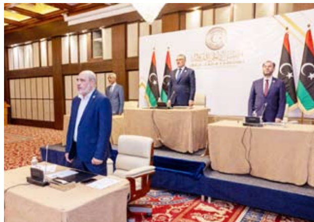
اجتماع المجلس الأعلى للدولة في طرابلس

في تصعيد جديد للخلافات بين مجلسي «النواب» و«الأعلى للدولة» في ليبيا، صوت الأخير بالإجماع على رفض مشروع الموازنة العامة، التي اعتمدها مجلس النواب منفرداً، بينما أعلنت السلطات في غرب البلاد، أنها بحثت مع وفد عسكري تركي رفيع المستوى، في تعزيز العلاقات العسكرية بين الطرفين. ونقلت وسائل إعلام محلية عن أعضاء من «المجلس الأعلى للدولة»، تصويت 63 من أعضائه، من أصل 75 حضوراً والجلسة في العاصمة طرابلس، ضد الموازنة. وخصص المجلس جلسته الاستثنائية، لمناقشة ما وصفه بـ«الخرق الدستوري»، الذي أقدم عليه مجلس النواب باقرار الموازنة، من دون موافقة عليها. وكان مجلس النواب قد اعتمد الأسبوع الماضي، الموازنة العامة للدولة للعام الحالي بقيمة 179 مليار دينار، دون الرجوع إلى مجلس الدولة، (الدولار يساوي 4.84 دينار في السوق الرسمية)، لكن محمد تكالة رئيس «المجلس الأعلى»، أعلن رفض الإجراء.