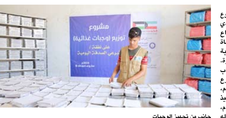
جانب من تجهيز الوجبات

«الصدقة اليومية» له فوائد عظيمة منها أن الصدقة سبب في تزكية المال وتطهيره، وكذلك تطهير النفس البشرية من الذنوب والبخل، وسبب في نشر السعادة والسور بين المساكين والفقراء، والصدقة سبباً في دفع البلاء ورفع الأمراض والشفاء منها بإذن الله تعالى. وأكد الدبوس أن مشروع «الصدقة اليومية» وجميع مشاريع النجاة الخيرية معتمدة وتتم بالتنسيق مع وزارتي الشؤون والخارجية ويتم تنفيذها بالتعاون مع الجمعيات الرسمية المشهورة في منظومة وزارة الخارجية وبإشراف وفود النجاة الخيرية، وتقوم بدورها بإرسال التقارير الخاصة كل يوم بعد التبرع بالمشاريع للمحسنين ونشرها كذلك بحسابات الجمعية.