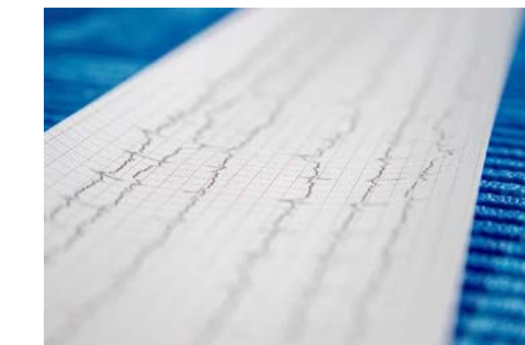
الجهاز سيتمكن من إجراء تحليل أولي للبيانات

بالإضافة إلى تقييم ديناميكية حالة المريض بعد عدة اختبارات، مما سيسمح إذا لزم الأمر، بالوصف والتعديل في الوقت المناسب.