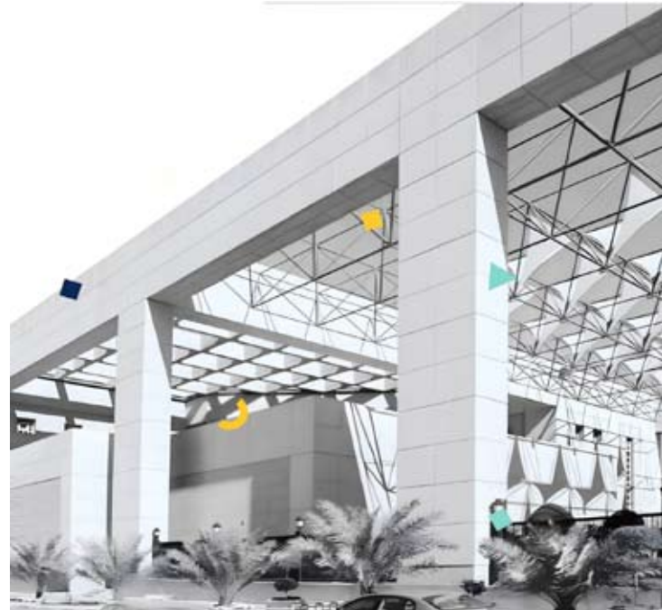
جامعة عبدالله السالم

وأفاد بأنه سيتم فتح فترة تحديد الرغبات للطلبة الأجانب والمقيمين بصورة غير قانونية وليسوا من أبناء الكويتيات الراغبين في الدراسة على نفقتهم الخاصة اعتباراً من يوم الاثنين المقبل إلى الخميس الموافق 25 من الشهر نفسه، بعد اعتماد المستندات المطلوبة في النظام ودفع رسوم التسجيل البالغة 15 ديناراً كويتياً (نحو 49 دولاراً أمريكياً).