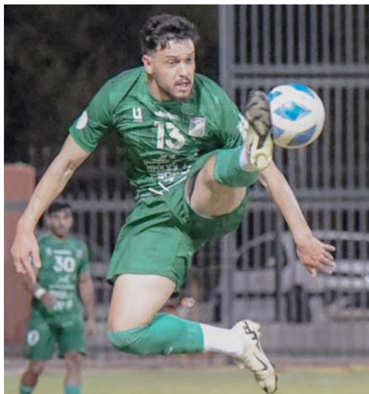
العربي يتفوق على الشباب برعاية قبل المعسكر الخارجي