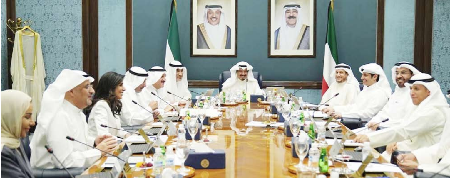
سمو الشيخ أحمد عبدالله مترسا الاجتماع أمس

ثم ناقش مجلس الوزراء التوصية الواردة ضمن محضر اجتماع لجنة الخدمات العامة الوزارية بشأن مشروع مسار السكة الحديد في دولة الكويت والتقارير المقدم من الهيئة العامة للطرق والنقل البري بهذا الشأن وقرر مجلس الوزراء تكليف الهيئة باستكمال جهودها نحو تنفيذ قرارات مجلس الوزراء الصادرة بشأن المشروع واتخاذ الإجراءات اللازمة والكفيلة بتسريع وتيرة العمل وتقليص الدورة المستندية الخاصة به والبدء بمراحل تنفيذه وصولاً إلى إنجازه قبل الموعد المحدد له وموافقة مجلس الوزراء بتقرير دوري كل ستة أشهر يتضمن مستجدات الخطة التنفيذية مشفوعاً بالبرنامج الزمني.