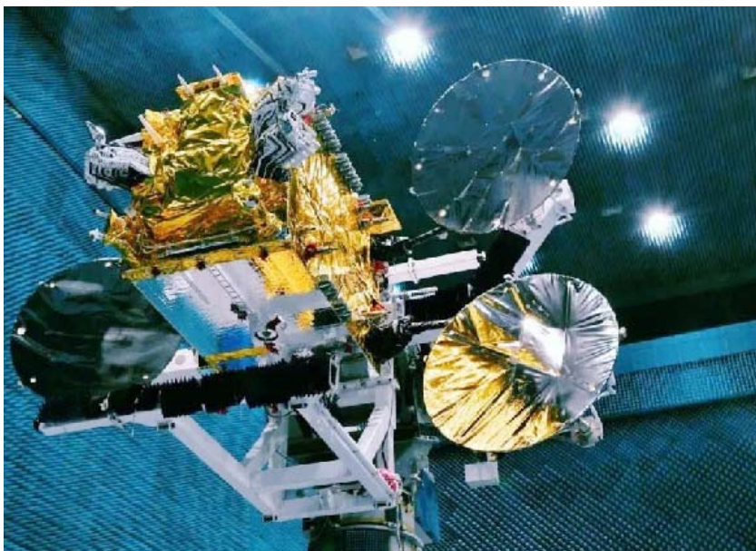
بدء الخدمات التشغيلية لأول قمر اصطناعي صيني للاتصالات

أعلنت الشركة الصينية لعلوم وتكنولوجيا الفضاء، رسمياً، أمس، عن بدء الخدمات التشغيلية لأول قمر اصطناعي صيني للاتصالات يعمل بالدفع الكهربائي (أبستار-6-إي)، وذلك بعد مراجعة تقنية النظام المداري والأرضي في هونغ كونغ. وقالوا: إن هذا القمر الاصطناعي (دي إف إتش-3-إي)، ويبلغ عمره الافتراضي المصمم 15 عاماً. وقالت الشركة في بيان لها: إن هذا القمر هو الأول من سلسلة (دي إف إتش-3-إي)، ويعد أول قمر اصطناعي للاتصالات في العالم