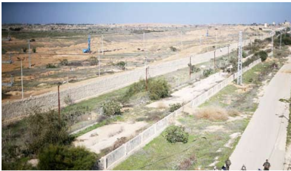
الحدود المصرية الصهيونية

ناقشت إسرائيل ومصر بشكل خاص انسحاباً محتملاً لقواتها من حدود غزة مع مصر، وفقاً لمسؤولين اثنين إسرائيليين ودبلوماسيين غربيين كبيرين، وهو تحول قد يزيل إحدى العقبات الرئيسية أمام اتفاق وقف إطلاق النار مع حركة «حماس». ووفق تقرير نشرته صحيفة «نيويورك تايمز»، تأتي المناقشات بين إسرائيل ومصر ضمن موجة من الإجراءات الدبلوماسية في قرارات متعددة تهدف إلى تحقيق هدنة ووضوح القطاع على الطريق نحو حكم ما بعد الحرب. وقال مسؤولون من «حماس» و«فتح»، إن الصين ستستضيف اجتماعات معهم الأسبوع المقبل في محاولة لسد الفجوات بين الفصائل الفلسطينية المتنافسة. كما ترسل إسرائيل مستشار الأمن القومي تساحي هنغبي إلى واشنطن هذا الأسبوع لعقد اجتماعات في البيت الأبيض، بحسب بيان صادر عن مكتب رئيس الوزراء الإسرائيلي بنيامين نتانياهو.