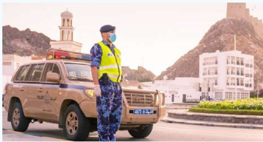
وفاة 5 أشخاص واستشهاد شرطي... ومقتل الجناة الثلاثة

انتهت شرطة عمان السلطانية والإجهزة العسكرية والأمنية، إجراءات التعامل مع حادث إطلاق النار التي وقعت مساء الإثنين بمنطقة الوادي الكبير في محافظة مسقط. ووفق بيان نشرته وكالة الأنباء العمانية، أسفر الحادث عن وفاة خمسة أشخاص واستشهاد أحد رجال الشرطة ووفاة الجناة الثلاثة إضافة إلى إصابة (28) شخصاً من جنسيات مختلفة بينهم (4) أشخاص أثناء تادية واجبه الوطني من رجال الشرطة ومنتسبي هيئة الدفاع المدني والإسعاف تم نقلهم إلى المؤسسات الصحية لتلقي العلاج، وتتواصل عمليات التحري والبحث والتحقيقات في ملابسات الحادثة.