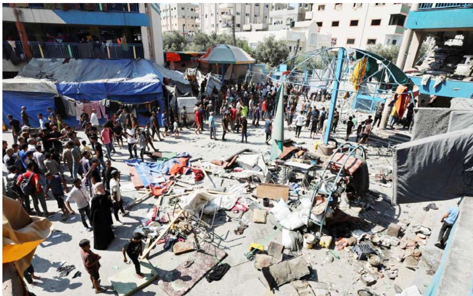
غارة جوية صهيونية على مدرسة

يتواصل القصف الكثيف في قطاع غزة المدمر جراء الحرب المستمرة منذ أكثر من 9 أشهر بين إسرائيل وحركة «حماس»، بينما تتلاشى الآمال بالتوصل إلى اتفاق لوقف إطلاق النار وتفاقم «الكارثة الإنسانية»، بحسب منظمات غير حكومية. وخلال اجتماع في واشنطن، أبلغ وزير الخارجية الأميركي أنتوني بلينكن مسؤولين إسرائيليين كبيرين بـ«القلق العميق» الذي يساور الولايات المتحدة في أعقاب المخاطر التي شنتها الجيش الإسرائيلي في الأيام الأخيرة بقطاع غزة، وأوقعت خسائر كبيرة في الأرواح، بحسب المتحدث باسمه ماثيو ميلر. وفي وقت استؤنفت فيه الجهود الدبلوماسية على أمل التوصل إلى اتفاق لوقف إطلاق النار، أعلن قيادي كبير من «حماس»، وقف المفاوضات الجارية عبر الوساطة، بسبب عدم جدية الاحتلال وسياسة المماطلة والتعطيل المستمرة وار تكاب المجازر بحق المدنيين العزل، وانتشلت 4 جثث و3 جرحى من تحت أنقاض منزل استهدفته غارة جوية إسرائيلية في خان يونس (جنوب)، وفق الهلال الأحمر الفلسطيني، الذي أفاد أيضاً بمقتل شخص وإصابة آخرين في منزل بالنصيرات (وسط) جراء استهدافه بطائرة إسرائيلية. وتحدثت شهود عن ضربات ونيران مدفعية نفذها الجيش الإسرائيلي من شمال القطاع الفلسطيني إلى جنوبه. وفي مدينة غزة (شمال)، قالت أجهزة الإسعاف إنها عثرت على قتيل وجرحين