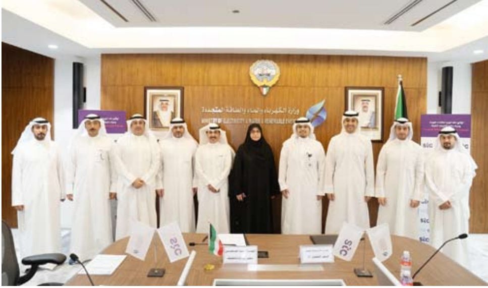
م. مها العسوسى ومسؤولي الجانبين عقب التوقيع

أشاد محافظ العاصمة الشيخ عبد الله سالم العلي الصباح، في الجهود الكبيرة التي بذلتها قطاعات وزارة الكهرباء والماء والطاقة المتجددة، بالتعاون والتنسيق بين الجهات الحكومية ذات الصلة، والذي ساهم مؤخراً في معالجة مشكلة انقطاعات التيار الكهربائي، إثر ارتفاع أعمال الطاقة، مؤكداً على أهمية تكاتف كافة الجهود بين المؤسسات الحكومية سعياً لوضع الحلول المناسبة، بما يخدم الوطن والمواطن. جاء ذلك خلال ترأس محافظ العاصمة الشيخ عبدالله سالم العلي الصباح، صباح أمس، الاجتماع التنسيقية بحضور محافظ حولي علي الأصفر، ومحافظ الفروانية الشيخ عذبي ناصر العذبي الصباح، ومحافظ الجهراء حمد الحبشي، ومحافظ مبارك الكبير الشيخ صباح بدر صباح السالم الصباح، ومحافظ الأحمدية الشيخ حمود جابر الأحمد الصباح، ورئيسة مركز العمل التطوعي الشخيرة أمثال أحمد، إلى جانب حضور ممثلين عن وزارات الكهرباء والماء والتجارة والصناعة والبلدية والإعلام، بهدف المساهمة والمشاركة في تقديم الدعم والمساندة لاهلية الدولة في مواجهة موجة ارتفاع درجات الحرارة، والعمل على إطلاق حملات توعوية للترشيد، والحد من استنزاف أعمال الطاقة