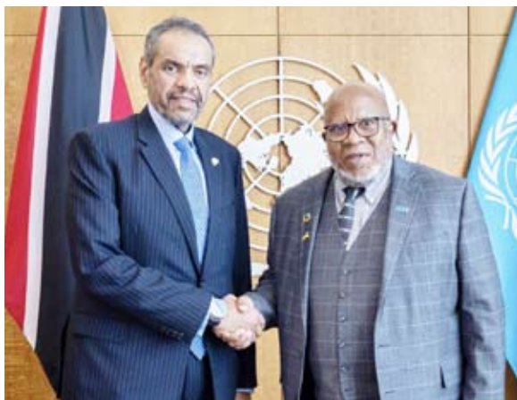
.. ويلتقي برئيس الجمعية العامة للأمم المتحدة دينيس فراينسيس