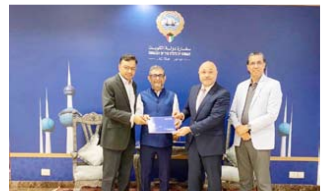
السفير مشعل الشمالي يلتقي راجيش آرورا

التقى سفير دولة الكويت في نيودلهي مشعل مصطفي الشمالي، بالسيد راجيش آرورا، الرئيس التنفيذي لشركة جي إم آر للمطارات الهندية المحدودة، التي يقع مقرها في مدينة نيودلهي الهندية، والمتخصصة في المشاريع المعنية ببناء وإدارة وتطوير المطارات في جمهورية الهند وعدد من دول العالم. ودار الحديث حول مجالات التعاون المتبادل بين دولة الكويت والهند في شأن بناء وإدارة المطارات والخدمات الأرضية المختلفة، وأكد السيد آرورا على أهمية دولة الكويت العالمية وما تملكه من سمعة دولية واهتمام في تطوير البنى التحتية للمطارات ومرافقها. وأشاد السفير الشمالي، بأعمال الشركة في إدارة أكثر من 6 مطارات رئيسية وأخرى فرعية في الهند بالإضافة إلى عدد من مطارات دول الجوار الهندي ودول أخرى، آملاً أن يكون هناك المزيد من تعزيز التعاون المستقبلي بين دولة الكويت وجمهورية الهند على جميع المستويات.