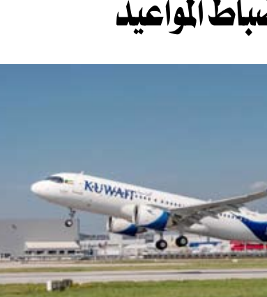
مقارنة بشهر مايو الماضي، حيث حققت ما نسبته 90,6 بالمئة وشهر أبريل الماضي ما نسبته 88,2 في المئة.

وفقاً لجدول تشغيل الرحلات مبيته أن هذه السياسة جاءت بعد دراسة من القطاعات التشغيلية التي نتج عنها تصاعد تدريجي في تحسين دقة مواعيد الإقلاع. وأوضح أن هذه النتائج وأوصحت أن هذه الخطوات الأساسية والمهمة التي تعكس تقدم (النقل الوطني) وازدهاره نحو آفاق التميز في الاستجابة لتحديات سوق النقل الجوي وما تسعى له الشركة في الوصول إلى أفضل مستويات الجودة بالخدمة المقدمة لعملائها. ويعد موقع (سيريوم) من المصادر الموثوقة في العالم