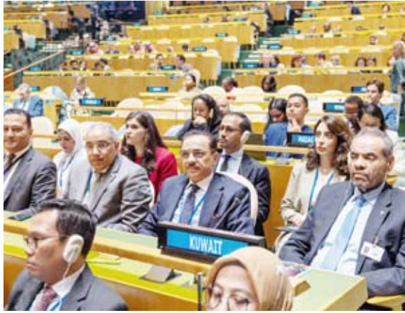
جانب من مشاركة وفد الكويت بدعم الدول النامية والأقل نمواً في سبيل تحقيق أهداف التنمية المستدامة وفي تمويل المشاريع

من جهة أخرى، التقى وزير الخارجية عبدالله الجحيا، مساء الاثنين، برئيس الدورة العادية الـ 78 للجمعية العامة للأمم المتحدة دينيس فراينسيس. وعقد اللقاء في مقر الأمم المتحدة بمدينة نيويورك وذلك على هامش مشاركته في المنتدى السياسي رفيع المستوى حول التنمية المستدامة. وتم خلال اللقاء استعراض العلاقات الوثيقة التي تربط دولة الكويت بمنظمة الأمم المتحدة وكالاتها المتخصصة وبحث الموضوعات والقضايا المطروحة على جدول أعمال الجمعية العامة للأمم المتحدة والاستحقاقات المقبلة والتنسيق حيالها.