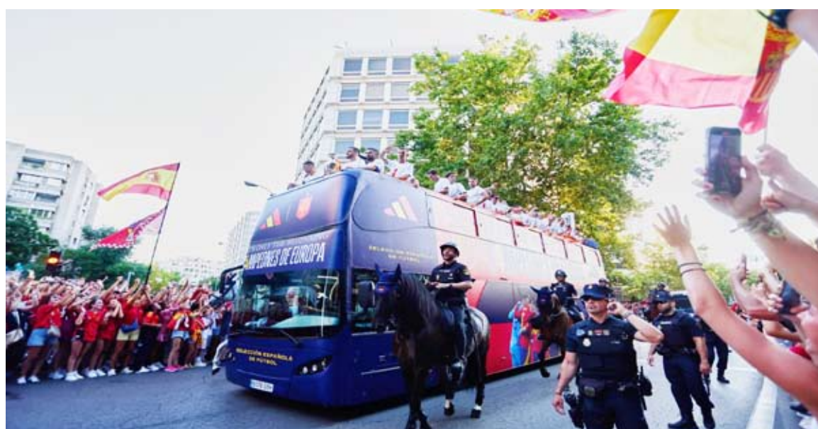
احتفالات مستمرة بالماتادور الإسباني

المنتخب يعزز الترابط في بلد له تاريخ من التوترات الإقليمية والاستقطاب السياسي. وقال مشجع شاب يدعى بورخا للتلفزيون الإسباني: نحن بلد عظيم، في يوم مثل هذا من المهم أن نتذكر أن هذا العلم يمثلنا جميعا. وأشاد بالنجم الإسباني الواعد الأيمن يامال (17 عاما) الذي تعود أصول والده إلى المغرب ووالدته من غينيا الاستوائية. ووقف المشجعون المتحمسون، على الشرفات والأرصعة المزدحمة، وكثير