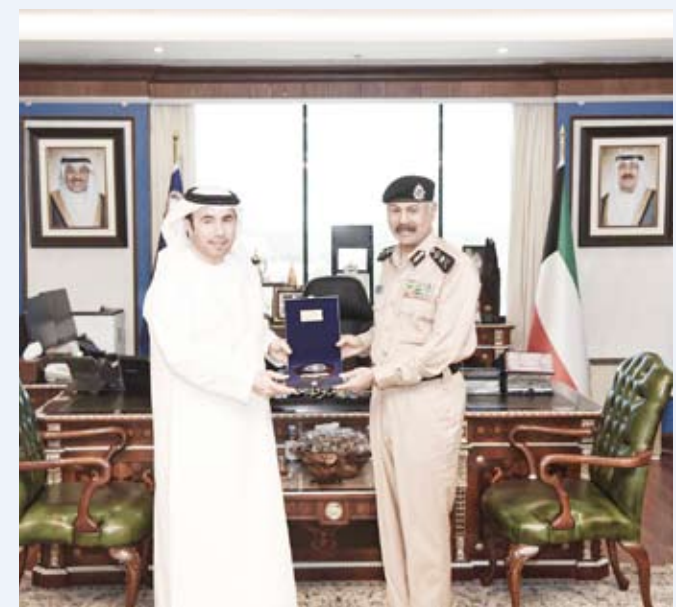
الفريق الشيخ سالم النواف يلتقي د.أحمد الريسي

بحث وكيل وزارة الداخلية الكويتية الفريق الشيخ سالم النواف، أول أمس، مع رئيس المنظمة الدولية للشرطة الجنائية (إنتربول) الدكتور أحمد الريسي سبل تعزيز التعاون والتنسيق بين دولة الكويت والمنظمة في مجال الأمن وتبادل الخبرات ودعم التدريب. وقالت وزارة الداخلية في بيان صحفي: إن الفريق النواف أكد خلال اللقاء حرص دولة الكويت على حسن التعاون والتنسيق مع المنظمات الدولية والإقليمية في مجال الأمن وتحقيق السلام. وأضافت أن رئيس المنظمة الدولية ثمن جهود وزارة الداخلية في التعاون الدولي والحرص على الأمن والسلام العالمي ومكافحة الجريمة المنظمة.