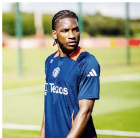
المدافع الكونغولي ويلي كامبوالا

أعلن نادي فياريال الإسباني لكرة القدم، تعاقد مع المدافع الكونغولي ويلي كامبوالا قادما من مانشستر يونايتد الإنجليزي. وأفاد النادي الإسباني، في بيان له، بأنه نجح في التعاقد مع كامبوالا بعقد يمتد حتى يونيو عام 2029 في صفقة انتقال حر، مشيرا إلى أن اللاعب يتميز بالوقوة البدنية والقدرات الكبيرة في السيطرة على الكرة. وشارك المدافع الكونغولي في 10 مباريات مع مانشستر يونايتد، لكنه تعرض لإصابات أبعده عن التشكيلة الأساسية في العديد من مباريات الفريق الفرنسي.