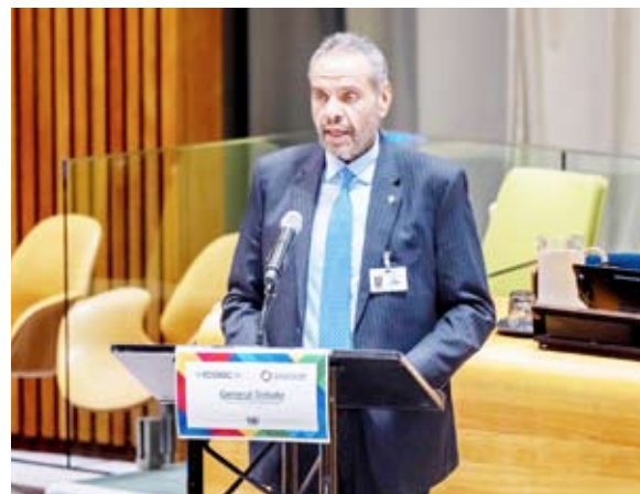
وزير الخارجية عبدالله الجحيا يلقي كلمة الكويت

ترأس وزير الخارجية عبدالله الجحيا، مساء أمس الأول، وفد دولة الكويت المشارك في أعمال المنتدى السياسي رفيع المستوى حول التنمية المستدامة، الذي ينعقد خلال الفترة من 15 إلى 17 يوليو الجاري في مقر الأمم المتحدة بمدينة نيويورك.