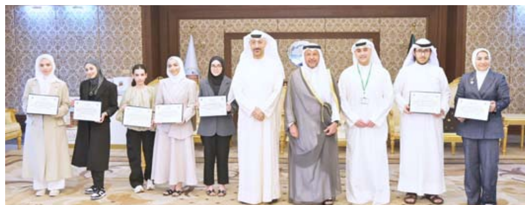
البنك قام برعاية فعالية تكريم الطلبة المتفوقين

رعايته لتكريم الطلاب المتفوقين في الثانوية العامة إيماناً من البنك بأهمية تكريم الطلبة المتميزين على تفوقهم الدراسي، ونتمنى لهم دوام النجاح والتميز والانتقال إلى المرحلة الجامعية.