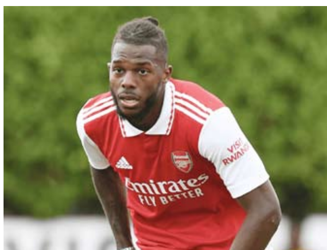
البرتغالي نونو تافاريس

أعلن نادي أرسنال الإنجليزي، انتقال مدافعه البرتغالي نونو تافاريس إلى صفوف الفريق الأول لكرة القدم بنادي لاتسيو الإيطالي على سبيل الإعارة لمدة موسم واحد. وقال النادي في بيان عبر موقعه الرسمي، إن تافاريس البالغ من العمر 24 عاما سيضم إلى لاتسيو بداية من الموسم المقبل بعد أن قضى الموسم الماضي معاراً مع نونتهغام فورست.