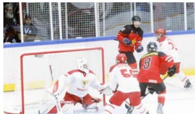
جانب من البطولة