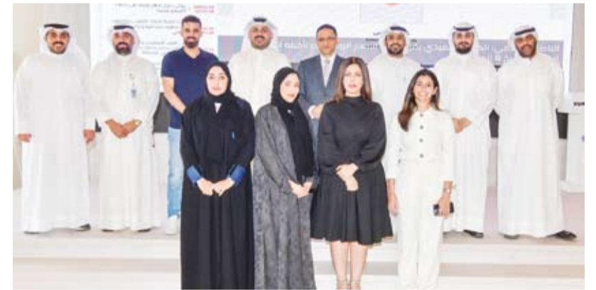
عدد من المشاركين في البرنامج التدريبي

اختتم مركز (كونا) لتطوير القدرات الإعلامية، أمس، البرنامج التدريبي (استخدام الذكاء الاصطناعي في إنتاج محتوى شبكات التواصل الاجتماعي) بمشاركة عدد من منتسبي وكالة الأنباء الكويتية (كونا) ووكالة الأنباء القطرية (قنا) ووكالة الأنباء السعودية (واس) وعدد من الجهات الكويتية في القطاعين العام والخاص.