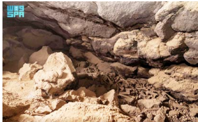
عظام الحيوانات في الكهف