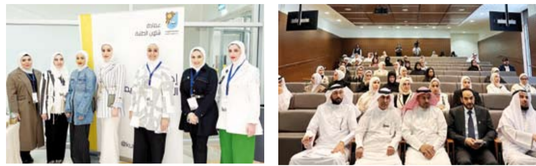
مجموعة من المشاركات