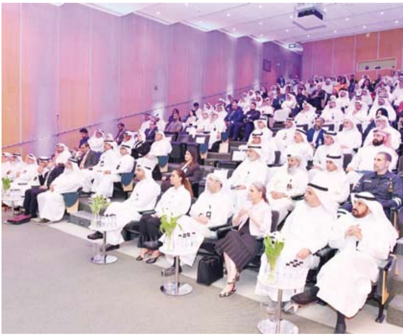
جانب من حضور حفل التدشين

الدوائر التجارية وتغذية المعلومات في الشركات التجارية الذين بذلوا جهوداً تستحق التقدير والثناء.