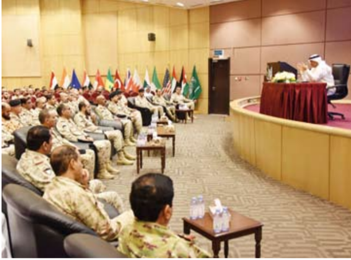
جانب من المحاضرة