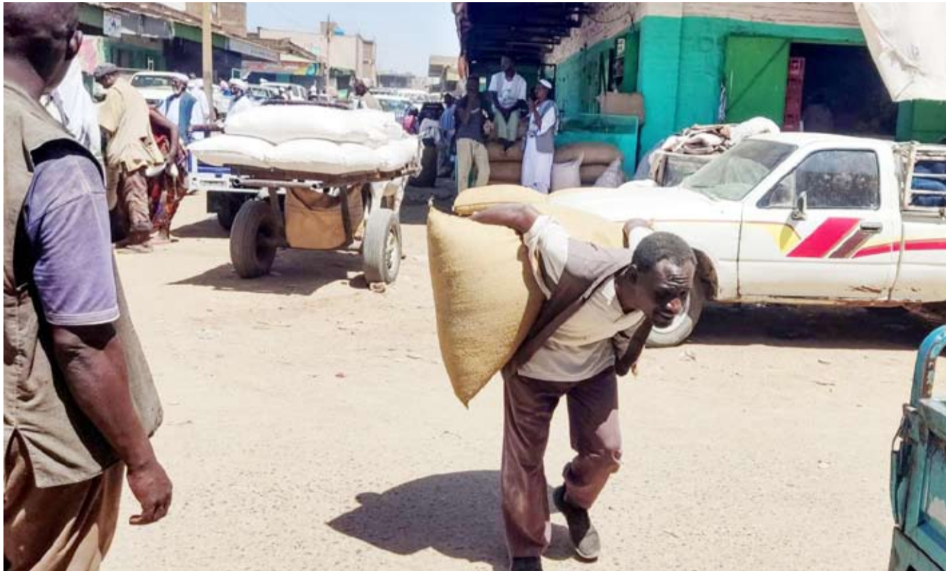
الشعب السوداني يتعرض لمجاعة كارثية

ونشرت منصات تابعة لـ«الدعم السريع» مقطع فيديو لأحد قادتها العسكريين يعلن تكوين إدارة في «مليط» التي تبعد نحو 50 كيلومتراً