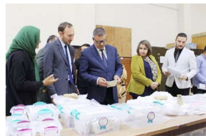
تسلم القطع الأثرية

أعلنت الهيئة العامة للآثار والتراث في العراق، أن المتحف الوطني العراقي يتسلم، أول أمس، 499 قطعة أثرية عثر عليها في موقع (تلو كرسو) في محافظة ذي قار جنوب العراق من قبل بعثة المتحف البريطاني العاملة هناك. وذكرت الهيئة في بيان أن القطع التي تم استلامها تضمنت 465 رقماً طينية تعود للحضارة الأكادية وعصر أور الأثري إضافة إلى أختام أسطوانية وأوان فخارية كانت تستخدم في الحياة اليومية آنذاك، فضلاً عن حلي وقلائد وكثير من القطع الأثرية. من ناحية أخرى انطلقت في مدينة أربيل بإقليم كردستان العراق اليوم، فعاليات السنخة الـ16 لمرش آربيل الدولي للكتاب، ويستمر لمدة 10 أيام. ويشارك في المعرض 300 دار نشر من 22 دولة، قدمت مليوناً و500 ألف عنوان في مختلف العلوم والآداب والفنون والمعارف.