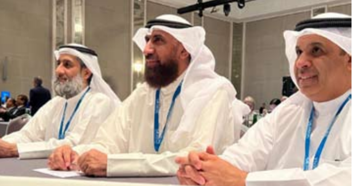
مسؤولي معهد الكويت للأبحاث العلمية خلال مشاركتهم في منتدى شرعي سياسات الطاقة

شأنها أن تضيف حوالي 5000 ميغاواط إلى الشبكة الوطنية للطاقة من المجمع إضافة إلى 2500 ميغاواط من أنظمة الطاقة الموزعة على مناطق الاستهلاك مما يعزز من إمكانيات الكويت في تحقيق أهدافها المعلنة للطاقة المتجددة بحلول 2030.