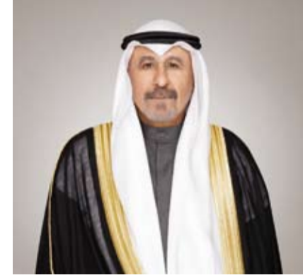
سمو الشيخ الدكتور محمد الصباح

بعث سمو الشيخ الدكتور محمد الصباح رئيس مجلس الوزراء المكلف بتصريف العاجل من الأمور، ببرقية تهنئة إلى الرئيس إيمرسون مانانغاوا رئيس جمهورية زيمبابوي الصديقة بمناسبة العيد الوطني لبلاده.