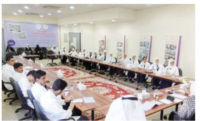
جانب من الحلقات النقاشية

كشفت المكتبة الإقليمي للمنظمة العالمية للعلوم والتكنولوجيا (ملست آسيا) عن إطلاق فعاليات الدورة الثالثة لـ «المؤتمر العلمي» للطلاب المتفوقين بالمرحلة الثانوية بدولة الكويت، بالتعاون مع توجيهه الفني العام للعلوم بدات يوم الإثنين «108» طلاب وطالبات، بينهم طلبة من ذوي الهمم وذلك في مجالات العلوم الأربعة (الكيمياء والفيزياء والأحياء والجيولوجيا)، وأن إقامة المؤتمر في يوم الأربعاء المقبل الموافق 24 من شهر أبريل الجاري بمدسة رقية المتوسطة بنات بمنطقة العمريه.