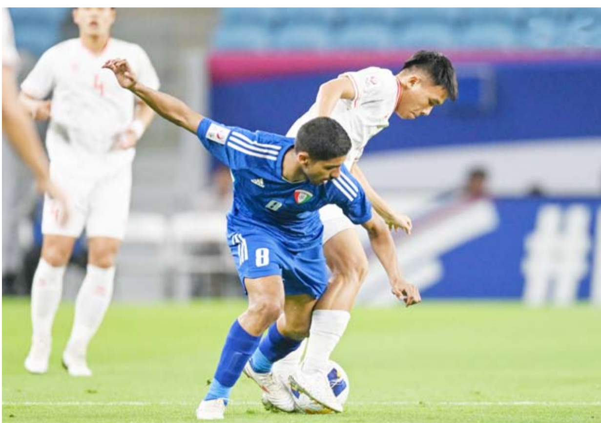
بداية متعثره للأزرق الكويتي

وانطلقت بطولة كأس آسيا لكرة القدم تحت 23 عاماً الإثنين الماضي وتستمر منافساتها لغاية الثالث من مايو المقبل.