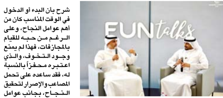
جانب من الجلسة الحوارية