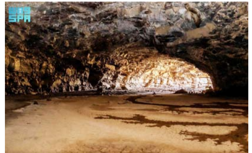
كهف أم جرسان

أظهر تحليل البقايا العظمية البشرية باستخدام النظائر المشعة اعتماد الجماعات البشرية على أكل اللحوم بشكل أساسي، وبمرور الزمن وجدت دلالات على أكلهم النباتات، مما يعطي مؤشرات على ظهور الزراعة، بينما أظهرت الدراسة تغذي الحيوانات مثل الأبقار والأغنام على الأعشاب والشجيرات البرية، بالإضافة إلى وجود تنوع حيواني كبير بالمنطقة عبر العصور. وأظهر تحليل البقايا العظمية البشرية إضافة إلى عدد من واجهات الفن الصخري عبارة عن مشاهد لرعي الماعز والغنم والبقر باستخدام الكلاب وأخرى للصيد والتي تُظهر أنواع مختلفة من الحيوانات البرية. وأوضحت الهيئة أن الاكتشافات العلمية أسفرت عن دلالات وجود استيطان بشري في الكهف، إضافة إلى غنى الكهف بعشرات الآلاف من عظام الحيوانات ومنها حيوان الضبع المخطط، والجمال والخيل والغزال والوعل والماعز والبقر إضافة إلى الحمير البرية المتوحشة منها والأليفة، وجميعها بحالة جيدة رغم مرور الزمن.