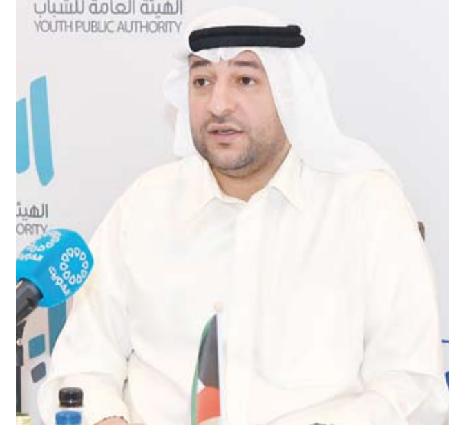
وزير الدولة لشؤون الشباب داود معرفي متحدثاً

الإمكانات لدعم وتمكين الشباب الذي شارف على تصميمه على الانتهاء ليبدأ العمل على تنفيذه هذا العام. وشدد الوزير معرفي على أن هذا الجهد الذي يأتي ضمن برنامج الخطوة تعد نقلة نوعية لصقل وتدريب الشباب المنخرط بمجال ريادة الأعمال بطريقة علمية مبتكرة،