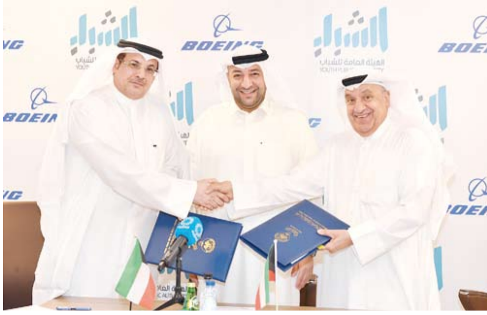
جانب من توقيع الهيئة العامة للشباب اتفاقية شراكة مع شركة «بوينغ»

وأوضح أن (بوينغ) لديها مشاركات مجتمعية مهمة، إذ تساهم سنوياً بتكريم المبتكرين في كلية الهندسة بجامعة الكويت كما تتعاون مع مؤسسات علمية في الكويت بتدريب نحو 15 ألف طالب في مجال الطيران والقضاء، معبراً عن تمنياته بنجاح هذه الجهود لرعاية الشباب الطموح لقيادة الأعمال التكنولوجية والرقمية بالبلاد.