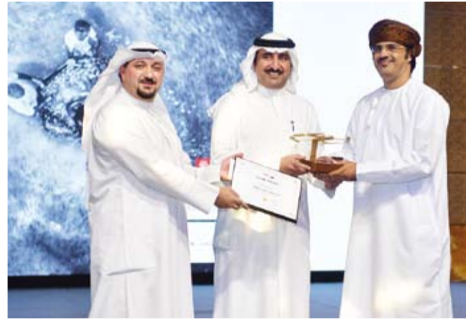
تكريم الفائز بالمرکز الأول عن فئة الأبيض والأسود