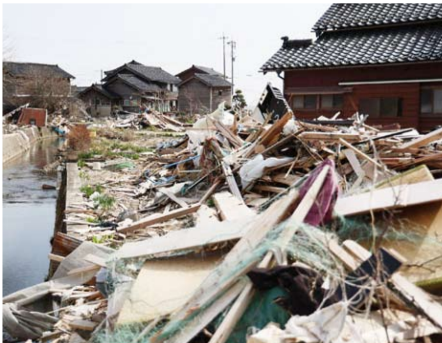
مدينة نوتو بعد 3 أشهر من وقوع زلزال بلغت شدته 7.5 درجات

ثلاثة مفاعلات في محطة فوكوشيما، في أسوأ كارثة في اليابان في فترة ما بعد الحرب العالمية الثانية وأخطر حادث نووي منذ تشرنوبيل عام 1986.