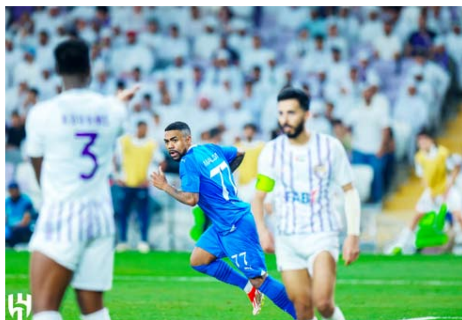
العين أوقف سلسلة الهلال التاريخية

وفي الدقيقة 78 قلص سالم الدوسري النتيجة بتسجيله الهدف الثاني الذي أنهت عليه المباراة، وتوقف سلسلة الهلال التاريخية عند 34 انتصاراً. وتلعب مباراة الإياب في الرياض الأسبوع المقبل.