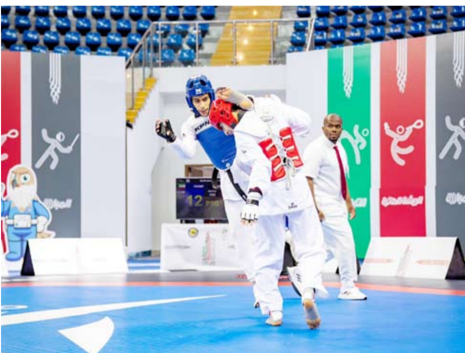
جانب من منافسات لعبة التايكوندو