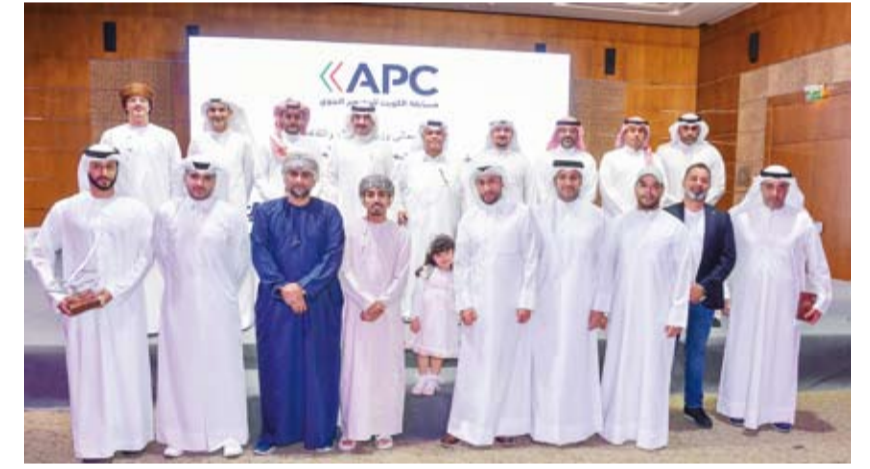
الفائزون بمسابقة الكويت للتصوير الجوي مع أعضاء لجنة التحكيم