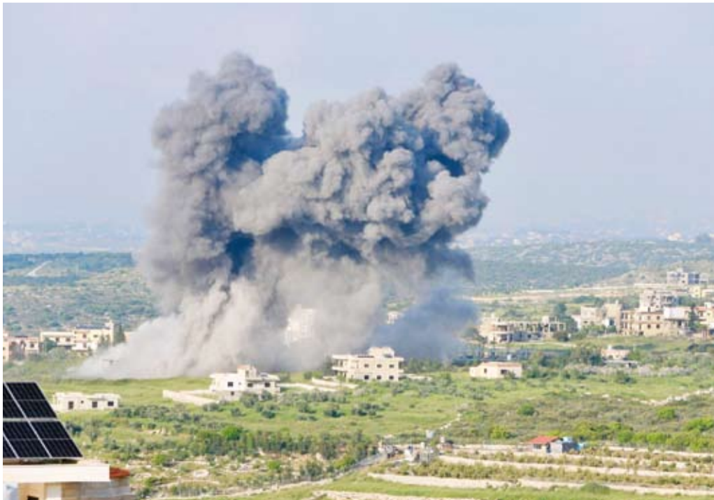
غارات صهيونية على لبنان

محاولتها سحب الآلية العسكرية التي تم استهدافها في موقع المطلة، إصابات مؤكدة. وأعلن «حزب الله»، في بيان، أنه استهدف قوة للعدو الإسرائيلي أثناء