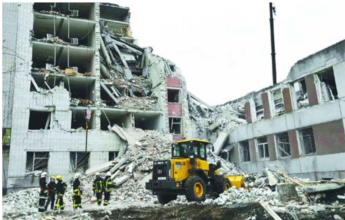
دمار في مدينة تشيرنيهيف بشمال أوكرانيا

وجه الرئيس الأوكراني فولوديمير زيلينسكي نداءات عاجلة إلى حلفائه الغربيين لتعزيز الدفاعات الجوية لبلاده في أسرع وقت مع اشتداد الهجمات الصاروخية الروسية ضد المدن الأوكرانية خلال الأسابيع الماضية، كان آخرها عندما قتل 17 شخصاً على الأقل وأصيب أكثر من 60 آخرين بجروح جراء استهداف مدينة تشيرنيهيف في شمال أوكرانيا.