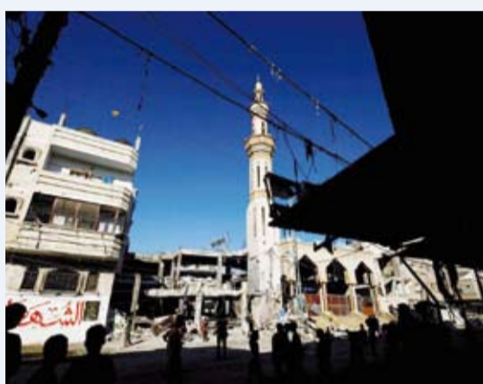
قصف صهيوني على منزل في رفح

أفادت وكالة الأنباء والعلوم الفلسطينية (وفا)، بمقتل سبعة أشخاص بينهم سيدة وثلاثة أطفال إثر قصف إسرائيلي استهدف أرضاً وغرفة سكنية شرق رفح بجنوب قطاع غزة. وذكرت الوكالة أن الغرفة السكنية كانت تؤوي نازحين. وكانت وزارة الصحة في قطاع غزة قد ذكرت في وقت سابق أن عدد الفلسطينيين الذين قتلوا جراء الحرب الإسرائيلية على القطاع منذ السابع من أكتوبر الماضي ارتفع إلى 33 ألفاً و899، بينما زاد عدد المصابين إلى 76 ألفاً و664 مصاباً.