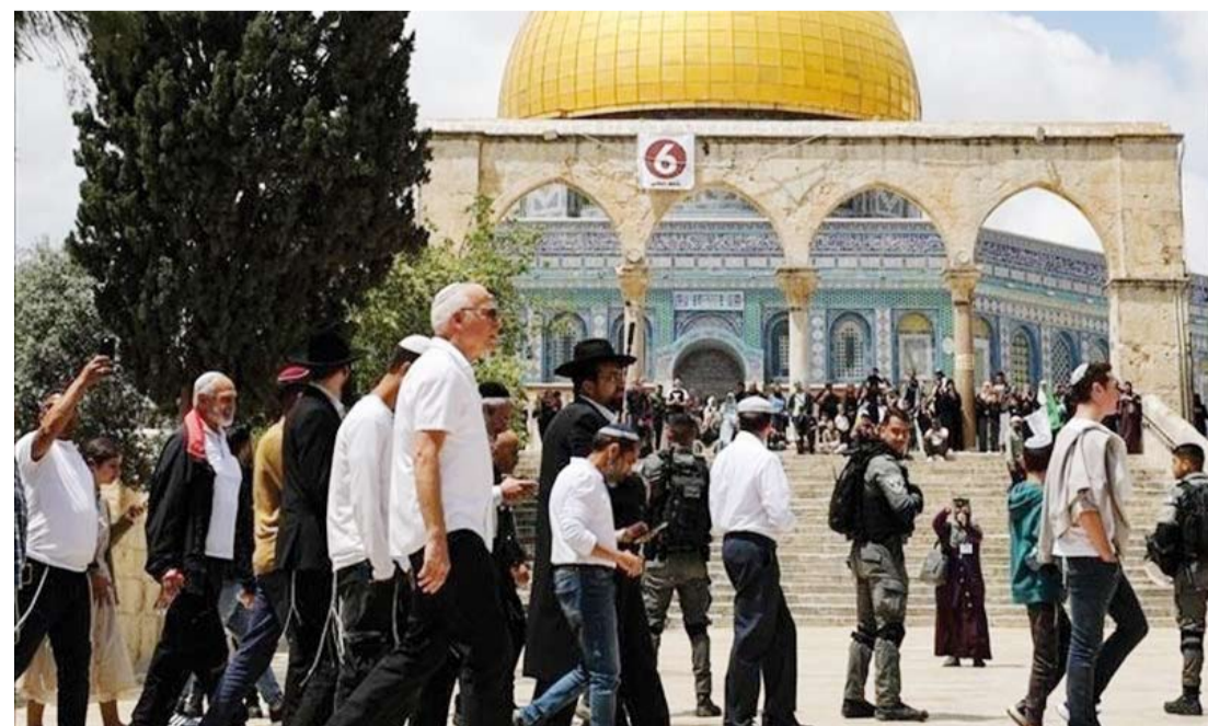
عدد من المستوطنين خلال اقتحام باحات الأقصى تحت حماية القوات الصهيونية

اقتحم عشرات المستوطنين المتطرفين أمس المسجد الأقصى من جهة باب المغاربة تحت حماية من شرطة الاحتلال الإسرائيلي. وقالت دائرة اعلام محافظة القدس في بيان صحفي إن الاحتلال لنذبح في المسجد الأقصى الأسبوع القادم.