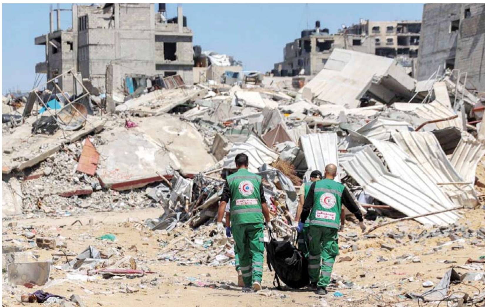
اكتشاف جثث شهداء بالقرب من مستشفى «الشفاء»

قال وزير الخارجية الإيراني إن بلاده بعثت «رسائل» عدّة إلى الولايات المتحدة للتأكيد على أن إيران «لا تسعى إلى توسيع التوترات» في الشرق الأوسط مع إسرائيل، حسبما أفادت وزارته. وقال حسين أمير عبدالمهيان لدى وصوله إلى نيويورك لحضور اجتماع لمجلس الأمن الدولي: «ما يمكن أن يزيد التوترات في المنطقة هو سلوك النظام الصهيوني». وكانت إسرائيل أعلنت أنها تحتفظ «بالحق في حماية نفسها» في مواجهة إيران، في أعقاب الهجوم الذي نفذته إيران ليل السبت الأحد على أراضيها بطائرات مسيرة وصواريخ، وفقاً لما ذكرته وكالة الصحافة الفرنسية. وشدد عبدالمهيان على أنه «تمّ بعث رسائل قبل العملية وبعدها» إلى الولايات المتحدة، خصوصاً عبر السفارة السويسرية في طهران التي تمثل المصالح الأميركية في إيران في ظل غياب العلاقات الدبلوماسية بين البلدين، موضحاً أن الهدف هو «التوصل إلى فهم صحيح لتصرفات إيران». وقال: «أبلغنا الأميركيين بوضوح أن قرار... الرد على النظام الإسرائيلي»، في أعقاب الضربة المنسوبة إلى إسرائيل ضد القنصلية الإيرانية في دمشق في الأول من أبريل، كان «نهائياً». وأضاف: «حاولنا أن نوضح للولايات المتحدة في هذه الرسائل أننا لا نسعى إلى توسيع التوترات في المنطقة». ومن المتوقع أن يلتقي أمير عبدالمهيان في نيويورك الأمين العام للأمم المتحدة أنطونيو غوتيريش ووزراء خارجية آخرين على هامش اجتماع مجلس الأمن لمناقشة طلب السلطة الفلسطينية نيل العضوية الكاملة في الأمم المتحدة.