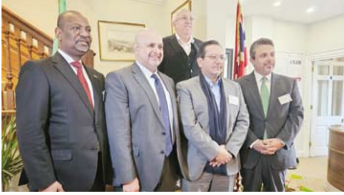
سفير الكويت لدى المملكة المتحدة والمشاركين في الحلقة النقاشية

لـ (كونا) بفتح باب النقاش مع السفير العوضي شيفافية حول توضيح النقاط الأساسية للفرص الاستثمارية في الكويت، حيث أشار إلى 26 مشروعا للفترة 2024 - 2025.