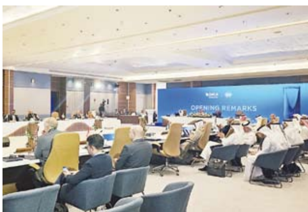
جانب من اجتماع المدراء العاميين للطيران المدني لدول الشرق الأوسط