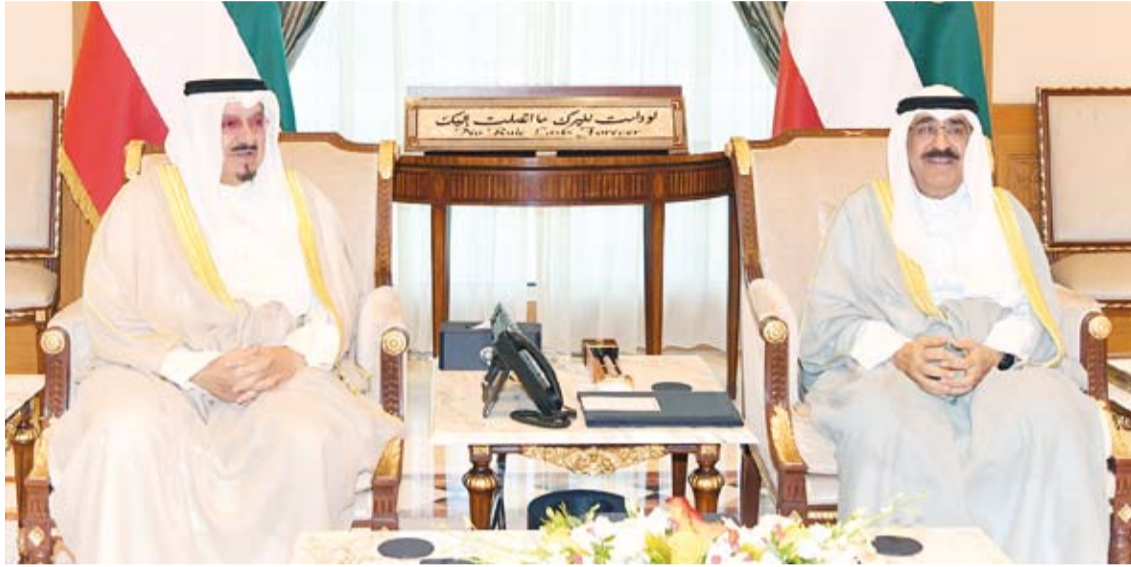
سمو أمير البلاد يستقبل سمو رئيس مجلس الوزراء

استقبل صاحب السمو أمير البلاد الشيخ مشعل الأحمد، بقصر السيف، صباح أمس، سمو الشيخ أحمد العبدالله رئيس مجلس الوزراء من جهة أخرى، بتفضل صاحب السمو أمير البلاد الشيخ مشعل الأحمد، فيقبل برعايته وحضوره (حفل تكريم متفوقين من خريجي كليات ومعاهد الهيئة العامة للتعليم التطبيقي والتدريب للعام الدراسي 2022/2023)، وذلك في تمام الساعة العاشرة من صباح اليوم الإثنين، على مسرح الهيئة العامة للتعليم التطبيقي والتدريب بديوان عام الهيئة الجديد بمنطقة الشويخ.