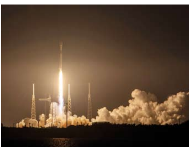
إطلاق أقمار صناعية

أطلقت مؤسسة تكنولوجيا استكشاف الفضاء الأمريكية "سبيس إكس"، أول أمس، 23 قمراً صناعياً جديداً من طراز "ستارلينك" إلى الفضاء لشبكات الإنترنت. وقالت المؤسسة: إن صاروخ "فالكون 9" الذي يحمل الأقمار الصناعية، أطلق من قاعدة "كيب كانافيرال" الفضائية بولاية فلوريدا الأمريكية، مشيرة إلى أن الصاروخ حمل الأقمار الصناعية إلى مدار أرضي منخفض، بعد حوالي 65 دقيقة من إقلاعه. وأضافت أن المرحلة الأولى من الصاروخ عادت إلى الأرض بنجاح بعد حوالي 8.5 دقيقة، وهبط على متن طائرة بدون طيار لشركة "سبيس إكس"، كانت متمركزة في المحيط الأطلسي. الجدير بالذكر أن مجموعة "ستارلينك" للأقمار الصناعية تعمل