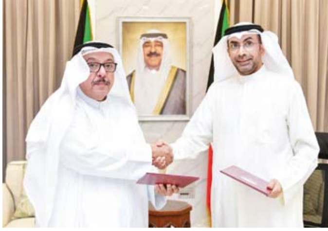
وكيل وزارة الإعلام مع رئيس مركز عبدالله العثمان التراثي

◆ محيسن: الوزارة تسعى إلى إيجاد شراكة تراثية وثقافية وفكرية مع مؤسسات ومتاحف المجتمع المدني