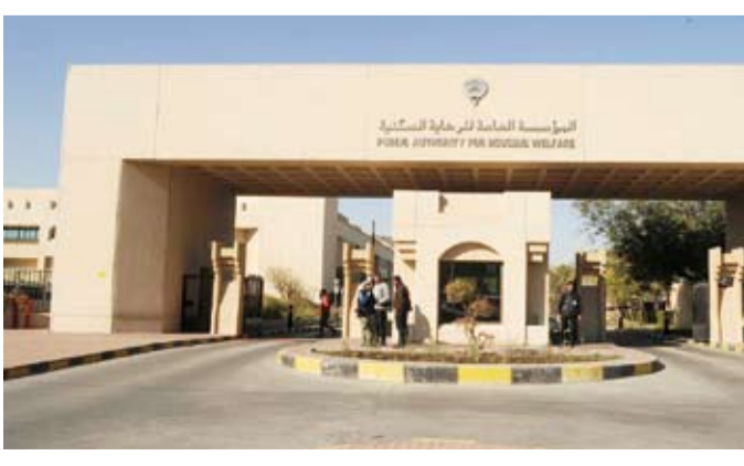
المؤسسة العامة للرعاية السكنية

تطبيق «سهل»، للخدمات الإلكترونية الحكومية، وذلك برفع المستندات المطلوبة دون الحضور للمؤسسة. ودعت المؤسسة العامة للرعاية السكنية، إلى مراجعة الفروع الخارجية للمؤسسة في الفترة الصباحية أو المبنى الرئيسي خلال فترة المسائية، في حال عدم تمكن طالب التخصيص من رفع المستندات المطلوبة في تطبيق «سهل»، الحكومي.