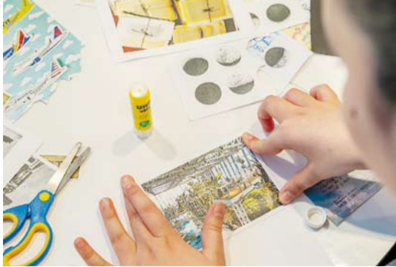
جانب من ورشة تعليمية للأطفال

احتفلت متاحف كويتية، أول أمس، (باليوم العالمي للمتاحف) الذي يصادف الـ 18 من مايو سنوياً، بتنظيم أنشطة وفعاليات متنوعة تحت شعار (متاحف للتعليم والبحث). وشمل احتفال دار الآثار الإسلامية بالمرکز الأميركي الثقافي على أنشطة للرسم والتصوير وأخرى تعليمية متخصصة في الفن الإسلامي وورش عمل في فن الخط العربي إضافة إلى أنشطة متخصصة في المتاحف بالاستعانة بمناهج جامعة هارفارد العريقة. كما شمل الاحتفال حلقات قراءة لفصوص الأطفال وجولات للأطفال ونوهم لاستكشاف قدراتهم الإبداعية والتعلم في بيئة ملهمة للجميع. واحتوت احتفالية مركز الشيخ عبدالله السالم الثقافي على سلسلة من البرامج المميزة لتعزيز دور المتاحف والمراكز الثقافية في العملية التعليمية والثقافية. وشمل احتفال المركز أنشطة تناسب الفئات العمرية إلى جانب عرض مباشر وورش عمل