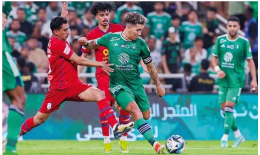
فيرمينو في حجمة اهلاوية