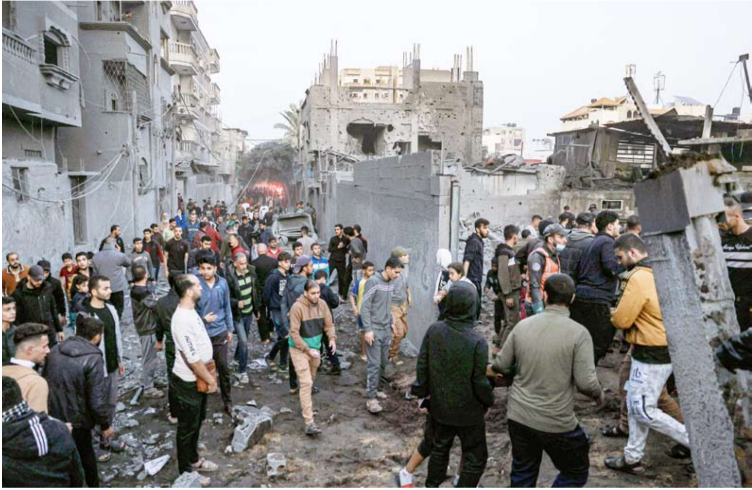
قصف صهيوني على جباليا في شمال قطاع غزة

وقتل إسرائيل في قطاع غزة منذ السابع من أكتوبر 35386 فلسطينياً، وجرحت 79366.