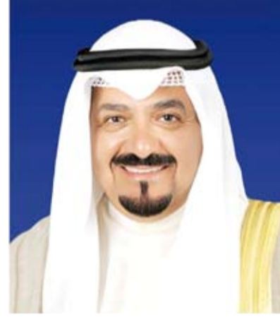
سمو الشيخ أحمد العبدالله

تلقى سمو الشيخ أحمد العبدالله رئيس مجلس الوزراء اتصالاً هاتفياً، أمس، من دولة رئيس مجلس الوزراء في جمهورية العراق الشقيق محمد شياع السوداني، أعرب فيه عن خالص تهنئته بمناسبة صدور الأمر الأميري بتعيين سموه رئيساً لمجلس الوزراء وتشكيل الحكومة الجديدة وتمنياته لسموه بالتوفيق والسداد ولدولة الكويت المزيد من التقدم والازدهار. من جهته عبر سمو رئيس مجلس الوزراء عن خالص شكره لدولة رئيس مجلس الوزراء في جمهورية العراق الشقيق على مشاعره الطيبة التي تؤكد عمق العلاقات الأخوية بين البلدين والشعبين الشقيقين، متمنياً لجمهورية العراق الشقيق دوام الاستقرار والازدهار.