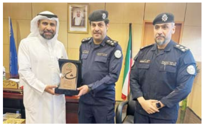
الدبوس يكرم مديرية أمن الأحمدى

الداخلية ممثلة في مديرية أمن الأحمدى والهيئة العامة للشباب والرياضة، ممفنا جهودهم البارزة في نجاح مشروع توزيع زكاة الفطر بكل يسر وسهولة. داعياً المولى جل وعلا أن يحفظ الكويت وأهلها والمقيمين فيها من كل شر وسائر بلاد المسلمين والعالم أجمع.