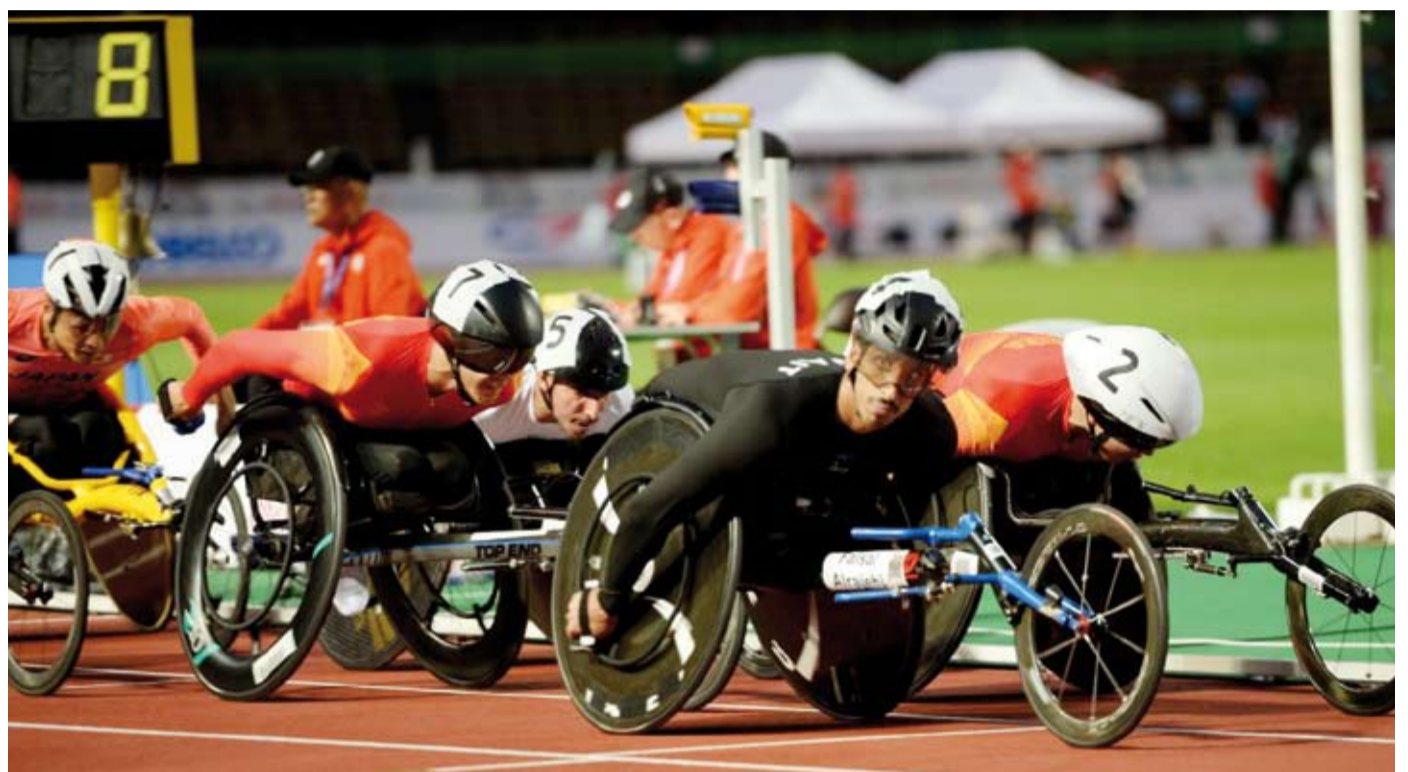
جانج من السباق