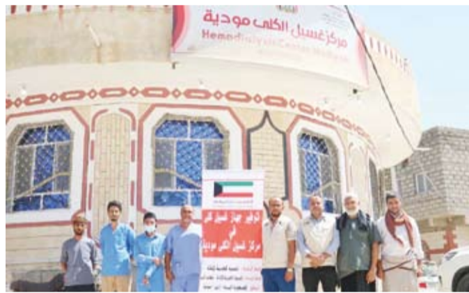
مركز غسيل الكلى في مودية بمحافظة أبين