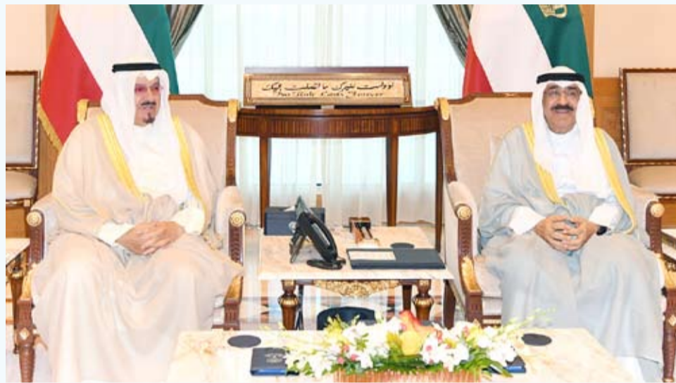
سمو الأمير يستقبل سمو رئيس مجلس الوزراء

استقبل سمو أمير البلاد الشيخ مشعل الأحمد بقصر السيف صباح أمس، سمو الشيخ أحمد العبدالله رئيس مجلس الوزراء. ويتفضل صاحب السمو الأمير فيشمل برعايته وحضوره حفل تكريم المتفوقين من خريجي كليات ومعاهد الهيئة العامة للتعليم التطبيقي والتدريب للعام الدراسي 2023/2022، وذلك في العاشرة من صباح اليوم، على مسرح الهيئة العامة للتعليم التطبيقي والتدريب بديوان عام الهيئة الجديد بمنطقة الشويخ.