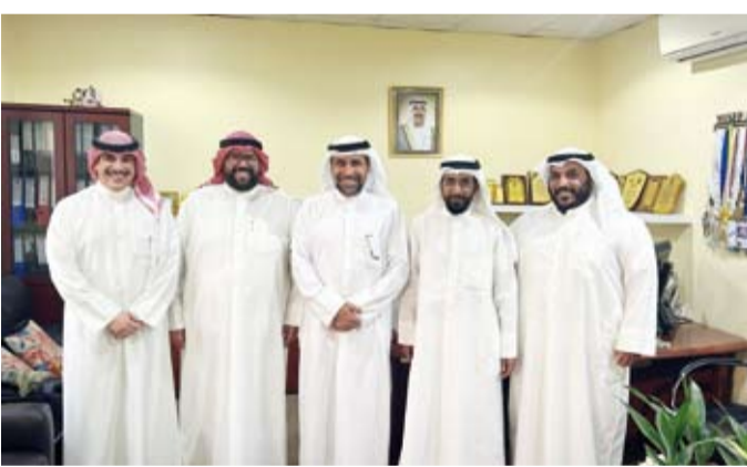
ويكرم الهيئة العامة للشباب