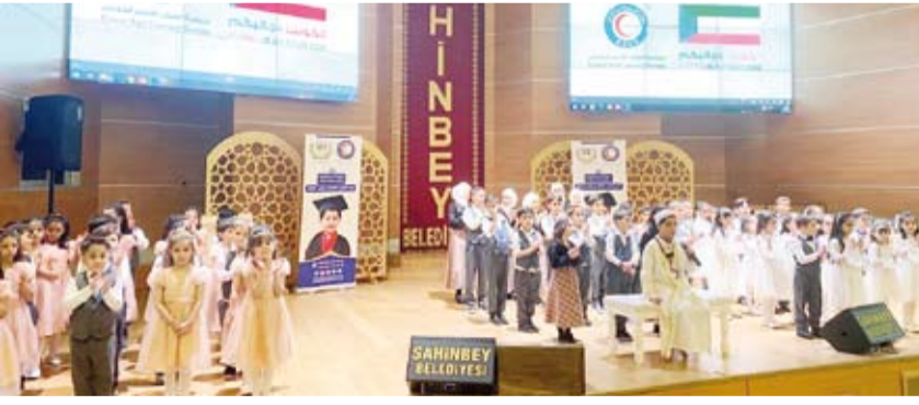
جانب من حفل تخريج المتفوقين

أن هذا المشروع ساهم بشكل كبير في توفير الدعم النفسي للأيتام وأسرهم، مشيداً بدور دولة الكويت حكومة وشعباً في مساهمتهم وجهودهم الكبيرة في مساندة أشقائهم السوريين داخل وخارج سوريا.