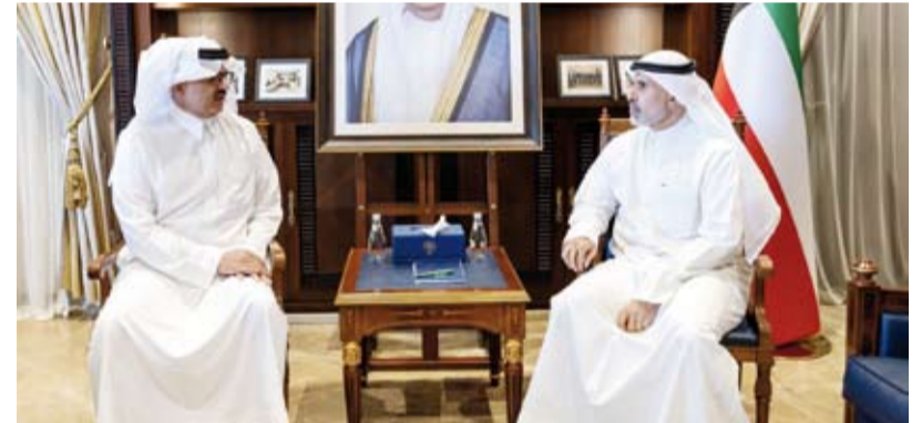
الشيخ جراح الصباح خلال استقبال الأمير سلطان بن سعد

استقبل نائب وزير الخارجية السفير الشيخ جراح جابر أحمد الصباح، أمس، سفير خادم الحرمين الشريفين لدى دولة الكويت الأمير