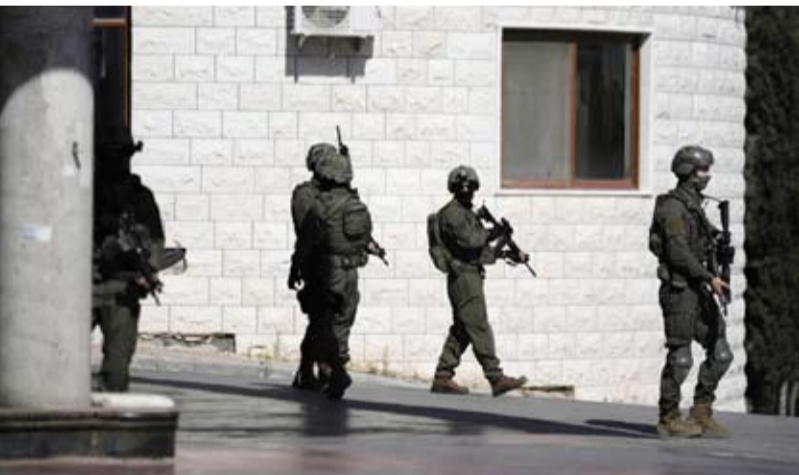
جنود صهاينة في الضفة الغربية

وعبر الحواجز العسكرية، ومن اضطروا للتسليم أنفسهم تحت الضغط، ومن احتجزوا رهائن». وفي سياق متصل، أفاد تقرير فلسطيني باقتحام مستعمرين، باحات المسجد الأقصى المبارك في مدينة القدس المحتلة، بحماية شرطة الاحتلال الإسرائيلي». ووفق وكالة الأنباء والمعلومات الفلسطينية (وفا)، «أدى مستعمرون طقوساً تلمودية خلال اقتحامهم المسجد الأقصى بحماية شرطة الاحتلال». وأفاد شهود عيان بأن «مستعمرين اقتحموا الأقصى بأكثر من مجموعة، عبر باب المغاربة، ونفذوا جولات استفزازية في باحاته، بينما شرطة الاحتلال حولت البلدة القديمة من مدينة القدس المحتلة إلى كتلة عسكرية».