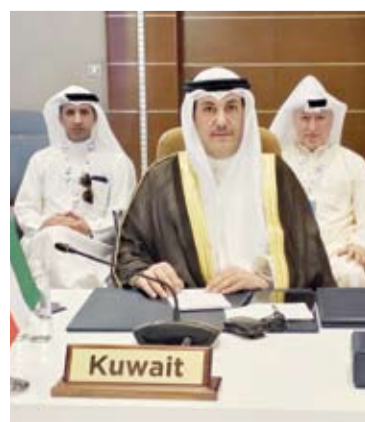
الوفد الكويتي خلال الاجتماع