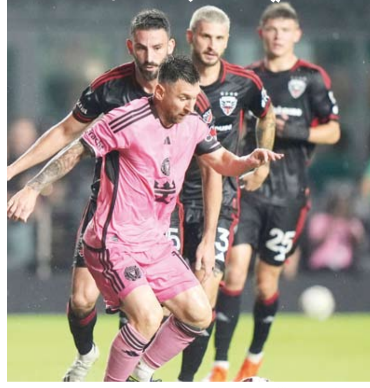
ميسي محاصر بعدد من اللاعبين

تغلب إنتر ميامي على دي سي يونايتد بهدف دون رد، خلال المواجهة التي جمعتها في الدوري الأميركي لكرة القدم للمحترفين، ويدين إنتر ميامي بالفضل في هذا الفوز لنجمه الإكوادوري ليوناردو كامبانا الذي سجل هدف الفوز الوحيد في الدقيقة الرابعة من الوقت بدل الضائع من عمر المباراة، لينجح إنتر ميامي في الحفاظ على مسيرته الخالية من الهزائم للمباراة التاسعة على