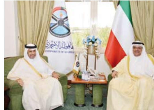
جانب من لقاء محافظ الاحمدي وسفير دولة قطر

وامتدانه لحفاوة الاستقبال، لبلاده، ومواطنو دولة قطر على وتقديره البالغ للرعاية التي تحظى بها البعثة الدبلوماسية