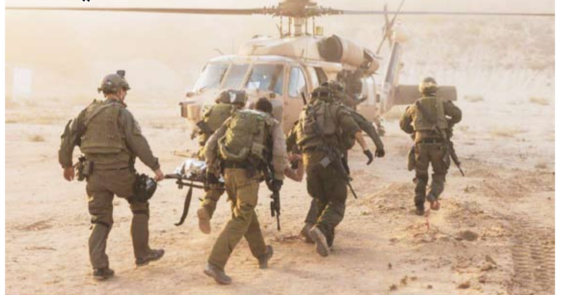
جانب من إخلاء قتل جيش الاحتلال في غزة

الإسرائيلية على قطاع غزة، في السابع من أكتوبر الماضي، منهم 282 جندياً سقطوا منذ بدء العملية البرية في قطاع غزة.