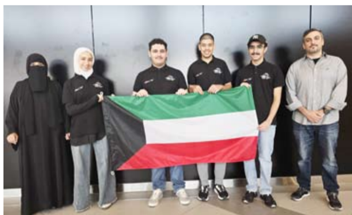
الطلبة المشاركون في الأولمبياد الدولية للكيمياء

وذكر أنه تم أيضاً التكفل باستقدام مدرب متخصص في الفيزياء هو الأستاذ حسين الراشد من جامعة سوانزي ببريطانيا لتدريب الطلبة على هذا النمط من الأسئلة حيث توليا كلاهما القيام بالتدريبات اللازمة للطلبة الكويتيين أعضاء اللجنة العليا لأولمبياد الكيمياء والفيزياء لهذا العام.