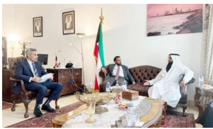
المطيري خلال لقائه القائم بأعمال السفارة الكويتية في بنين

تبرعات أهل الخير في الكويت. من جهته أكد القائم بأعمال السفير السيد عبد العزيز الدبوس تقديم كافة أنواع الدعم الدبلوماسي والإداري والقانوني للمؤسسات الخيرية الكويتية لإنجاز