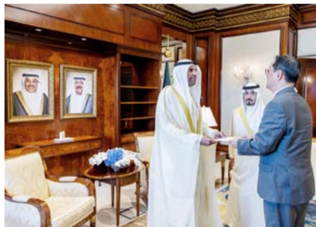
.. ويتسلم نسخة من أوراق اعتماد سفير جمهورية كوريا