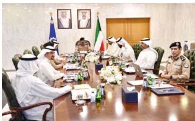
الفريق الشيخ سالم النواف خلال الاجتماع

المروية وبعض المشاكل المرورية. وذكر البيان أنه تم خلال الاجتماع تقديم عرض مرئي من قبل أمين سر المجلس الأعلى للمرور العميد سالم العجمي ورئيس لجنة النقل العام المنبثقة من المجلس الأعلى للمرور أشار خلاله إلى ملاحظات اللجنة على السلبيات والعيوب التي أدت لانخفاض وتردي خدمات النقل العام المرورية وبعض المشاكل المرورية. وأضاف أنه تم كذلك عرض اقتراحات اللجنة وتوصياتها لتحسين وتطوير خدمات النقل العام لما فيه مصلحة المواطنين والمقيمين ومواكبة رؤية دولة الكويت الإنمائية لتحولها إلى مركز مالي وتجاري وتحقيق هدف إدارة حكومية فعالة وبنية تحتية متطورة ومكانة دولية متميزة.