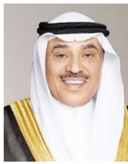
سمو ولي العهد الشيخ صباح الخالد

استقبل سمو الشيخ أحمد العبدالله رئيس مجلس الوزراء، في قصر السيف، أمس، سفير دولة قطر الشقيقة لدى دولة الكويت علي بن عبدالله آل محمود. وحضر المقابلة رئيس ديوان رئيس مجلس الوزراء عبدالعزيز الدخيل. من جهة أخرى، بعث سمو الشيخ أحمد العبدالله رئيس مجلس الوزراء ببرقية تهنئة إلى صاحب الجلالة الملك فيليب ملك البلجيكيين بمناسبة العيد الوطني لبلادهم.