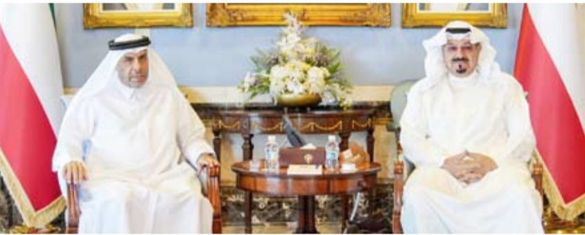
سمو رئيس مجلس الوزراء يستقبل السفير القطري

استقبل سمو الشيخ أحمد العبدالله رئيس مجلس الوزراء، في قصر السيف، أمس، سفير دولة قطر الشقيقة لدى دولة الكويت علي بن عبدالله آل محمود. وحضر المقابلة رئيس ديوان رئيس مجلس الوزراء عبدالعزيز الدخيل. من جهة أخرى، بعث سمو الشيخ أحمد العبدالله رئيس مجلس الوزراء ببرقية تهنئة إلى صاحب الجلالة الملك فيليب ملك البلجيكيين بمناسبة العيد الوطني لبلادهم.