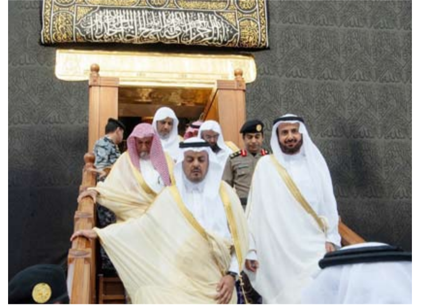
الأمير سعود بن مشعل مع عبدالعزيز مع المشاركين في غسل الكعبة

كما شارك الأمين العام لرابطة العالم الإسلامي الدكتور محمد العيسى وأعضاء السلك الدبلوماسي الإسلامي المعتمدون لدى المملكة وسنة بيت الله الحرام. وأكد رئيس الشؤون الدينية في المسجد الحرام والمسجد النبوي الدكتور عبدالرحمن السديس في منشور على حساب رئاسة الشؤون الدينية بمنصة (أكس) للتواصل الاجتماعي