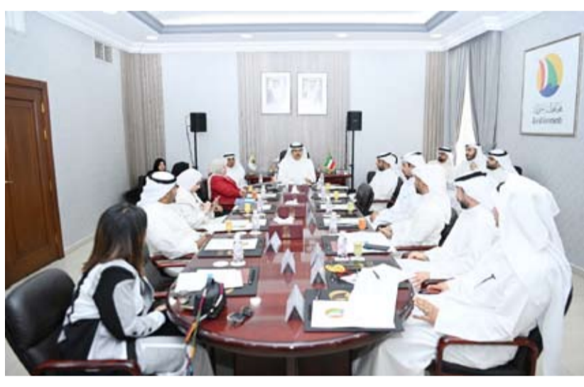
جانب من اجتماع الأصفر وأعضاء لجنة الترشيد بوزارة الكهرباء والماء

وأشار المحافظ إلى توفير كافة الإمكانيات من قبل المحافظة لتوعية المجتمع على أهمية ترشيد الطاقة مؤكداً على سعي المحافظة لمخاطبة الجمعيات التعاونية في مناطق المحافظة لتطبيق القرار الوزاري رقم (159) لسنة 2023 بتعديل لائحة تنظيم العمل التعاوني الصادر بموجب القرار الوزاري رقم (46) ت/ لسنة 2021، لاستنزاع الأشجار وتجميل المناطق. وأعرب عن خالص تقديره وشكره لأعضاء اللجنة متمنياً لهم التوفيق والنجاح لخدمة هذا الوطن الغالي.