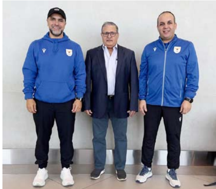
مدير بعثة الكويت على المري قبل التوجه إلى باريس

أعلنت اللجنة الأولمبية الدولية أنه تم بيع أكثر من 8.8 ملايين تذكرة للالعاب الأولمبية التي تنطلق الجمعة المقبل في فرنسا. وقال المدير الرياضي في اللجنة الأولمبية الدولية كيت ماکونيل خلال مؤتمر صحفي بعد اجتماع المجلس التنفيذي للجنة الأولمبية الدولية «يمكننا أن نرى الإثارة المذهلة في الشارع فقد تم بيع أكثر من 8.8 ملايين تذكرة وهو رقم لا يصدق لهذه الألعاب». وبين أن عدد التذاكر التي تم بيعها في «الأكثر على الإطلاق من أي وقت مضى لحدث رياضي في فرنسا». وعن تجاوب الفرنسيين مع الحدث أكد ماکونيل أنه يمكن الشعور «بالاستجابة الإيجابية» مشيراً إلى ستة ملايين شخص اصطفوا في الشوارع من أجل الشعلة الأولمبية. ومن جهته أكد مدير العلاقات باللجنة الأولمبية الدولية جيمس ماکلويد للصحفيين أنه تم نقل الآلاف من الرياضيين ومئات من اللجان الأولمبية الوطنية إلى القرية الأولمبية للاستعداد للألعاب التي تنطلق قريباً. وكشف أن المجلس التنفيذي للجنة الأولمبية الدولية وافق على زيادة في ميزانية التضامن الأولمبي الإجمالية للفتره (2025 - 2028) بنسبة 10 بالمئة لتصل إلى إجمالي غير مسبوق قدره 650 مليون دولار أمريكي لمساعدة جميع اللجان الأولمبية الوطنية وبرامج تطوير الرياضيين.