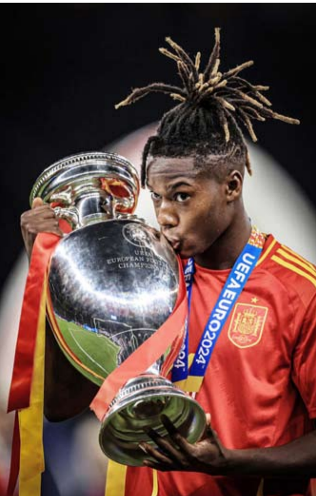
المهاجم الإسباني نيكو ويليامز

أكدت نتائج أداة ذكاء اصطناعي أن المهاجم الإسباني نيكو ويليامز سيكون أكثر اللاعبين تأخيراً في هجوم برشلونة في الموسم المقبل حال انتقاله إلى الأخير. ومنذ تألقه في كأس أوروبا وتشكيله ثنائية حاسمة مع لامين يامال لاعب برشلونة، بات اسم مهاجم أتلتيك بلباو يتردد كثيراً في برشلونة ما دعا رئيس الاتحاد الإسباني خافيير تيباس وجوان لابورتا رئيس مجلس إدارة برشلونة إلى التحدث صراحة عن إمكانية حدوث الانتقال. ونشرت «ماركا» الإسبانية نقلاً عن منصة «أولوكيب» للذكاء الاصطناعي أن ويليامز سيحقق أداءً أفضل من 96% من مهاجمي برشلونة وأنه لن يكون ملتزماً كثيراً في الجانب الدفاعي ما قد يعد نقلة سلبية. وأضاف بيانات أولوكيب أن نيكو سيساهم في أهداف برشلونة في كل 257 دقيقة، وأن الجناح سيكون متوسط تسجيل الأهداف لديه هو 0.31 هدف لكل مباراة في الدوري الإسباني وأيضاً صناعة 0.18 لكل 90 دقيقة. ويملك ويليامز عقداً مع بلباو يمتد حتى عام 2027 وبشرط جزائي بـ58 مليون يورو، وتُسبب مستواه الرائع يجذب أنظار 4 أندية أوروبية كبرى وهي برشلونة وبايرن ميونخ وليفربول وتشيلسي.