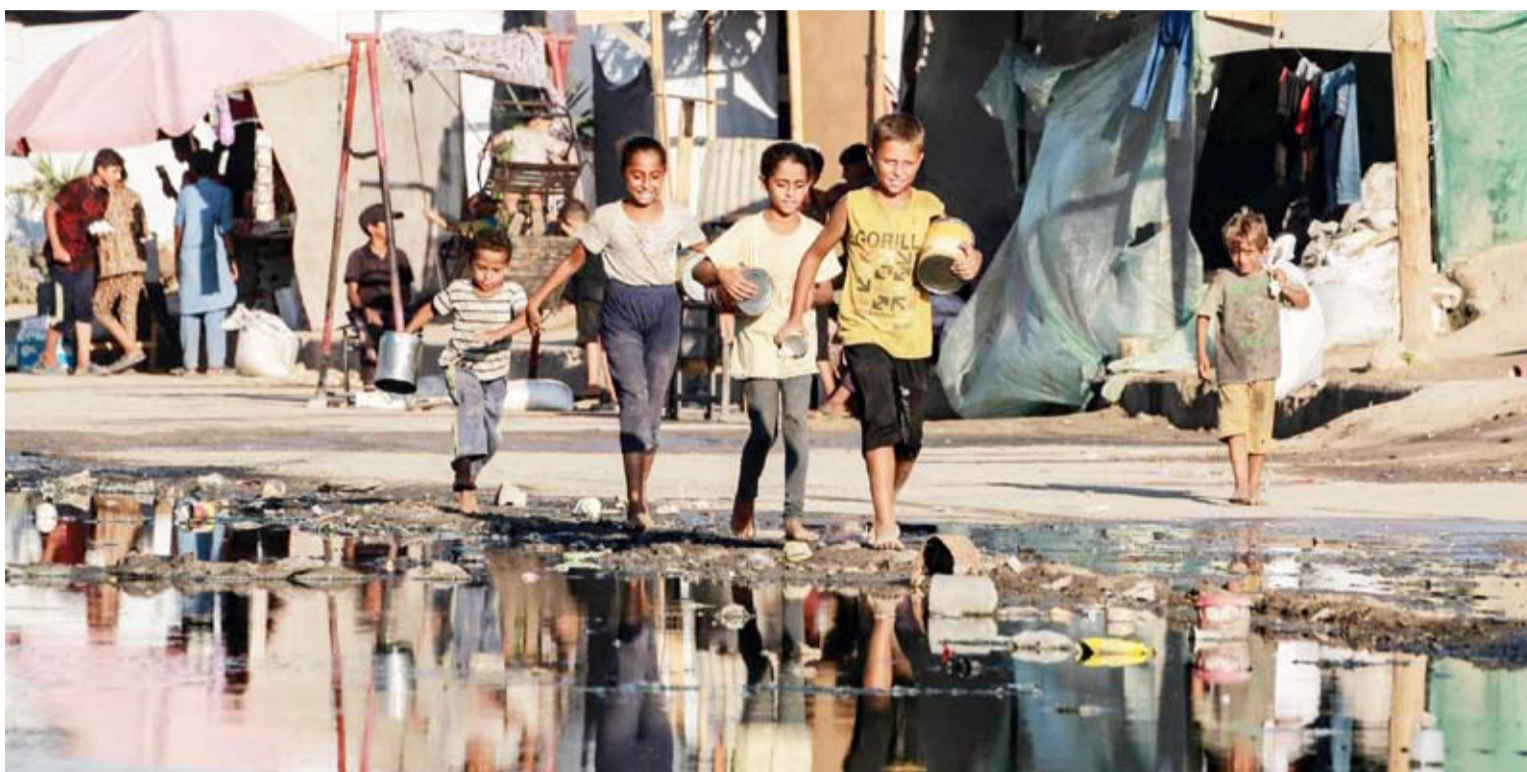
أطفال يسعون للحصول على الغذاء في ظل الجوع المنتشر في قطاع غزة

مباشرة، قضية المحتجزين الإسرائيليين لدى حركة «حماس» في غزة، وسيحاول حسم بعض النقاط الخلافية، بحيث تصبح القضية على الجانب الأمريكي أكثر منها على الجانب القطري. وحتى عودة نتنياهو من واشنطن، لن يسافر رئيس «الموساد» ديفيد برنيان، إلى قطر، بعكس ما كان مقرراً، لإكمال التفاوض على صفقة غزة. وأوضحت مصادر إسرائيلية أن الخلافات مع «حماس» لم تنته، لكن يمكن الحديث عن تقدم فيما يتعلق بمحور فيلادلفيا على عودة غزة من مصر. وفي حين يُصّر نتنياهو على البقاء في هذا المحور، ترفض مصر و«حماس» والسلطة الفلسطينية ذلك، وتقرح ترتيبات أمنية وضمانات مختلفة. أما النقطة العالقة بشكل أكبر الآن فهي عودة الفلسطينيين من جنوب القطاع إلى شماله، فنتنياهو يصر على وجود لقواته في الشمال لمنع آلاف المسلحين من العودة، وهو أمر ترفضه «حماس»، وترى المؤسسة الأمنية الإسرائيلية أنه يمكن إيجاد حلول لهذه القضية.