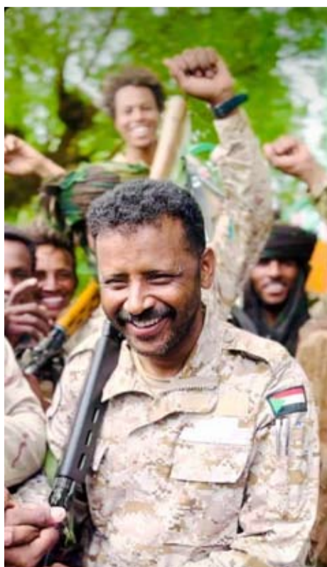
القائد عبد الرحمن البيشي

نعت مواقع تابعة لـ«قوات الدعم السريع»، السبت، أحد قادة العسكريين البارزين، الذي قُتل خلال المعارك الدائرة ضد الجيش السوداني في سنار، جنوب شرقي البلاد. ولم يصدر أي تعليق رسمي من «الدعم السريع» على حسابها الموقف في منصة «إكس» يؤكد تلك الأنباء. وتشير معلومات أولية حصلت عليها «الشرق الأوسط» إلى أن قائد «الدعم السريع» في قطاع النيل الأزرق، عبد الرحمن البيشي، ربما قُتل في غارات جوية شنها طيران الجيش السوداني في وقت مبكر من صباح السبت على القوات المتقدمة باتجاه سنار. ويتحدث البيشي من قبيلة «رفاعة» بولاية النيل الأزرق، في الجنوب الشرقي للبلاد، التي لها امتدادات كبيرة في وسط السودان. وقاد البيشي القوات التي استولت على رئاسة «الفرقة 17 مشاة» في مدينة سنجة عاصمة ولاية سنار، بعد انسحاب قوات الجيش منها دون خوض المعركة، وكان قبلها قد سيطر على منطقة جبل موية الاستراتيجية التي تعد ملتقى ثلاث ولايات مهمة في جنوب وسط البلاد. وأكد قائد عسكري بارز في «الدعم السريع»، تحدث لـ«الشرق الأوسط»، بشكل قاطع مقتل القائد عبد الرحمن البيشي، لكنه أحجم عن الخوض في المزيد من التفاصيل. ويعد البيشي ثاني أبرز قادة «الدعم السريع» الذين قُتلوا في معارك ضد الجيش، بعد مقتل قائد وسط دارفور الجنرال علي يعقوب جبريل، في مدينة الفاشر عاصمة ولاية شمال دارفور.