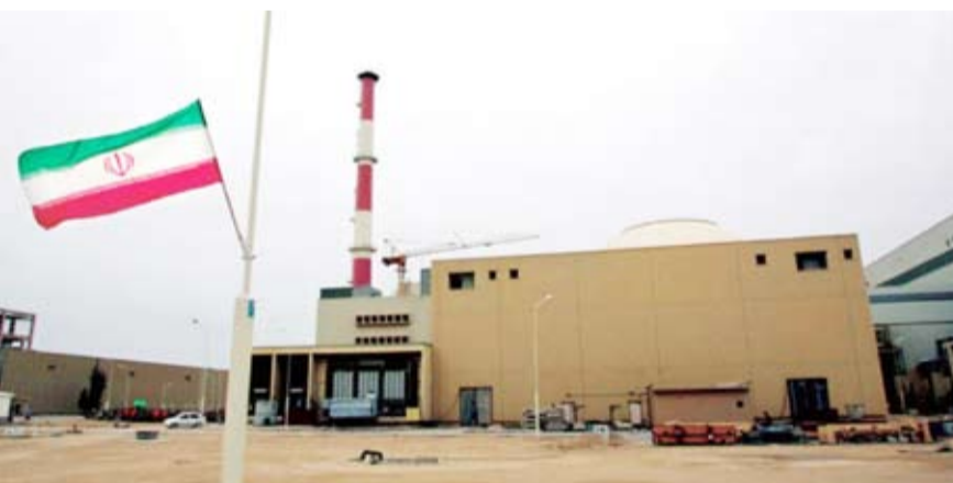
مشاة بوشهر النووية الإيرانية

أعلن وزير الخارجية الأميركي أنتوني بلينكن أن إيران قادرة على إنتاج مواد انشطارية بهدف صنع قنبلة نووية «خلال أسبوع أو اثنين»، مكرراً التزام الولايات المتحدة منع طهران من تحقيق ذلك.