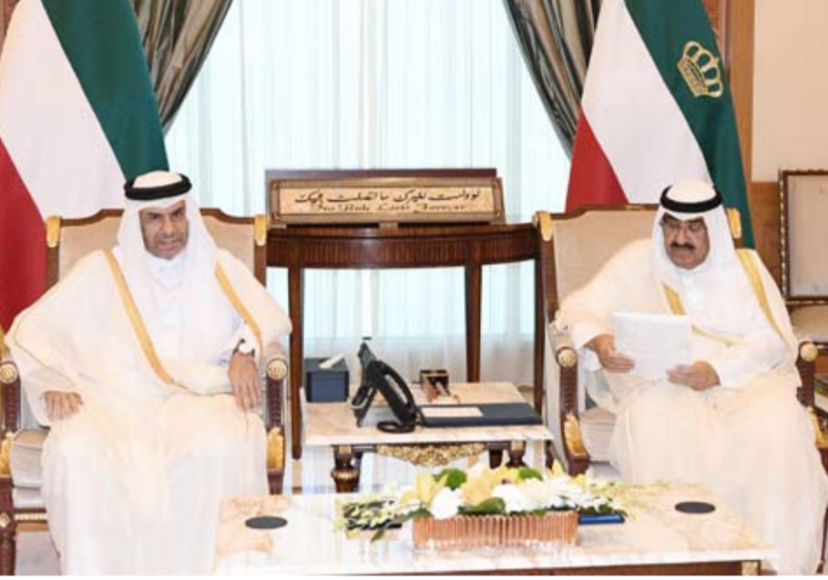
أمير البلاد يتسلم دعوة من أمير قطر للمشاركة في قمة حوار التعاون الآسيوي بالدوحة

التعاون الآسيوي بعنوان (الدبلوماسية الرياضية) والتي ستعقد في العاصمة الدوحة خلال شهر أكتوبر المقبل. وقد قام بتسليم الرسالة لسموه، سفير دولة قطر لدى دولة الكويت علي بن عبدالله آل محمود. حضر المقابلة كبار المسؤولين بالدولة.