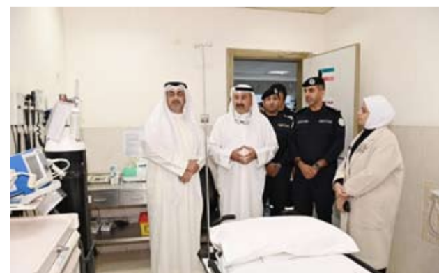
محافظ «العاصمة» خلال الجولة

كما أشاد المحافظ في الدور الكبير والجهود الفاعلة للمركز في تقديم الرعاية الصحية للمرضى، واستقبال المراجعين، وتوفير كافة المتطلبات، بما يجعله من المراكز الصحية المتميزة في البلاد. وذكر المحافظ في ختام الجولة على تسخير كافة أطر التعاون والتنسيق بين محافظة العاصمة وإدارة الطوارئ الطبية، لمواصلة العمل بما يحكم الوطن والمواطن، فنحن نعمل معاً من أجل توفير سبل السلامة والصحة والوقاية للمجهور