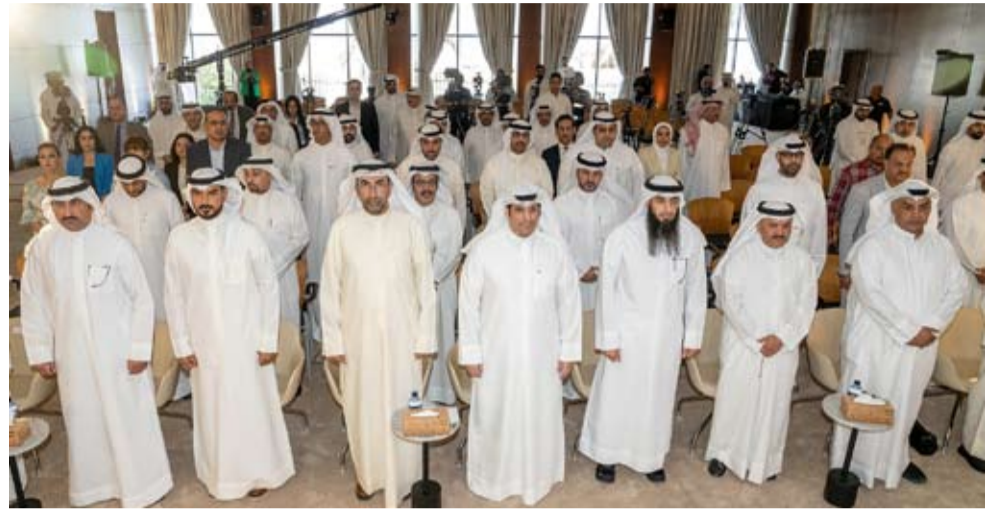
وزير الإعلام والثقافة عبدالرحمن المطيري يتقدم الحضور

أكد وزير الإعلام والثقافة عبدالرحمن المطيري، أن الوزارة تبنت في إعدادها لاستراتيجيتها (2021 - 2026) نهجاً تشاركياً في التخطيط وهو منهجية علمية معتمدة عالمياً وتنموية ومستدامة بالتجربة يهدف إلى إشراك جميع الأطراف المعنية في عملية صنع القرار ما يضمن تحقيق الأهداف بشكل فعال ومستدام.