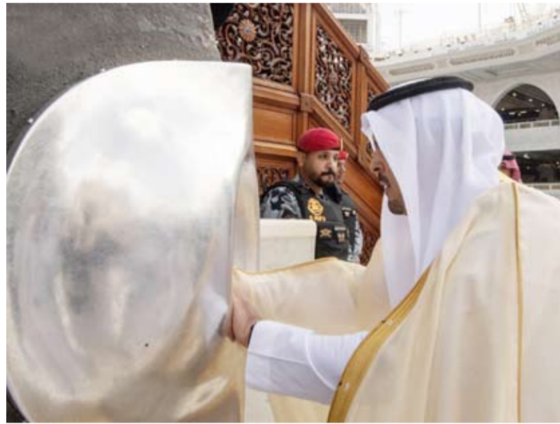
الأمير سعود بن مشعل مع عبدالعزيز مع المشاركين في غسل الكعبة