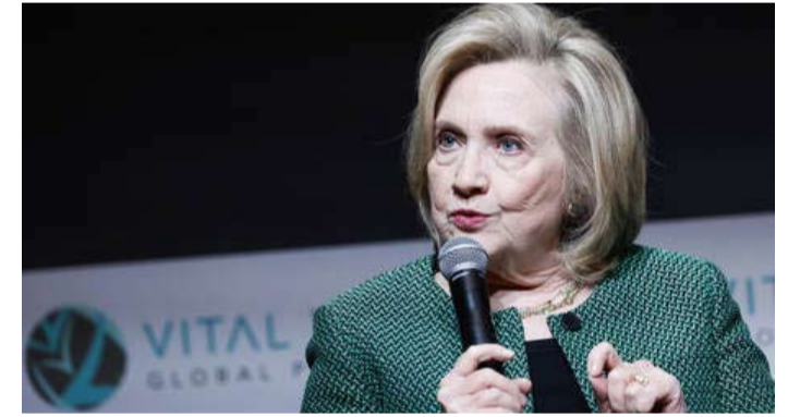
كلينتون خلال إحدى الندوات التي ظهرت فيها مؤخرًا

وقال كاتب الرأي بابلو أوهانا في مقاله الذي نشر يوم أمس الأول بعنوان «مستعدون للجولة الثانية: لماذا نحتاج إلى هيلاري أكثر منا في أي وقت مضى؟»، إن وزيرة الخارجية الأمريكية السابقة التي كانت قد خسرت الرئاسة أمام الرئيس السابق ترامب في عام 2016، هي الشخص الأكثر ملاءمة ليحل محل بايدن مع تشديد الدعوة إليه لتعليق مسالة إعادة انتخابه.