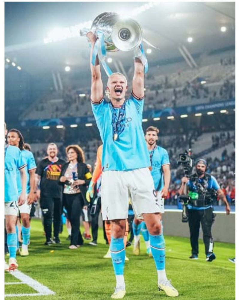
النرويجي إربينغ هالاند

لجأ النرويجي إربينغ هالاند هدف مانشستر سيتي الإنجليزي إلى تقطيع الخشب ضمن استعداداته للموسم الجديد. وغاب هالاند عن منافسات كأس أوروبا بعد فشل منتخب بلاده النرويج بالتأهل إلى البطولة القارية، بعد موسم توج خلاله ببطولتي كأس العالم لاندنية والدوري الإنجليزي. وكشف هالاند أن الطريقة غير الاعتيادية للتخصيص لموسم كرة القدم كانت بنصبة من والده الغني. وانتشر فيديو لهالاند وهو يجلس بالقرب من نهر وهو يمارس رياضة «اليوغا» قبل انتشار مقاطع أخرى له وهو يقطع الخشب بمنشار آلي. وأبان إربينغ؛ والدي أجبرني على تقطيع الخشب للعمل على قوتي بشكل أكبر، لم يكن لدي خيار. وانضم هالاند لطاقمة سيتي المغادرة إلى أميركا استعداداً للموسم الجديد حيث سيلعب «السماوي» أمام أندية سلتيك الإسكتلندي وإي سي ميلان الإيطالي وبرشلونة الإسباني ومانشستر يونائتد