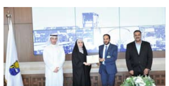
تكريم إحدى الفائزات