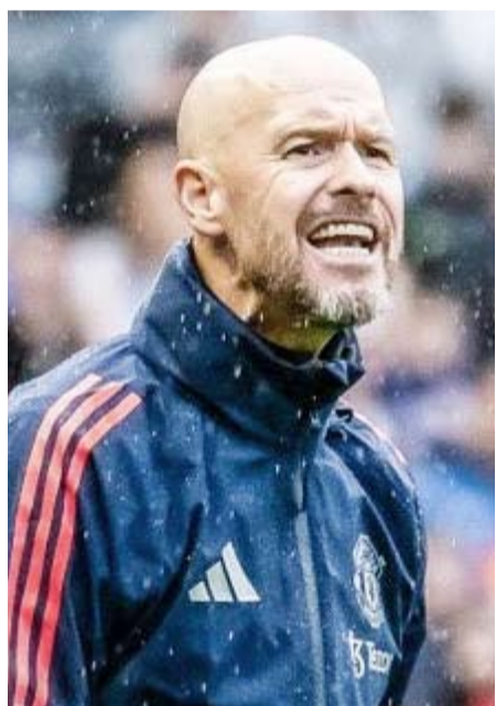
تن هاج مدرب مانشستر يونايتد

قال إريك تن هاج مدرب مانشستر يونايتد المنافس في الدوري الإنجليزي الممتاز لكرة القدم إن التعاقد مع ليني يورو وجوشوا زيركزي تحقق بسبب سرعة قيادة النادي في اتخاذ قرارات سريعة وحاسمة لتأمين التعاقدات الجديدة التي يحتاجها النادي مبكراً. وحدث تغيير في هيكل إدارة النادي كما استفاد الفريق من أفكار جديدة بعد أن استحوذ الملياردير البريطاني جيم راتكليف على حصة 25 بالمئة من أسهم النادي وسيطر على عمليات كرة القدم. وتعاقد يونائتد مع المدافع الفرنسي يورو لمدة خمس سنوات مقابل 62 مليون يورو (67 مليون دولار) الخميس الماضي. وكان يورو (18 عاماً) هدفاً للكثير من الأندية الأوروبية الكبيرة ومن بينها ريال مدريد. وحسم يونائتد أيضاً تعاقدته مع المهاجم زيركزي (23 عاماً) لخمس سنوات قادماً من بولونيا الإيطالي في صفقة بلغت قيمتها 42.5 مليون يورو (46.35 مليون دولار). وقدم زيركزي أداءً لافتاً مع النادي الإيطالي الموسم الماضي كما شارك مع منتخب هولندا في بطولة أوروبا 2024 في ألمانيا مؤخراً. وقال تن هاج أمس السبت «من الجيد جداً أن نكون في مقدمة سوق الانتقالات، كنا سابقين كثيراً.. وهكذا تؤدي الإدارة دوراً هاملاً في الوقت الحالي وهذا هو أسلوب العمل الذي نريده في يونائتد..» «طموحنا كبير جداً وعليه أن نكون في المقدمة وأن تكون جاهزاً للموسم. كلما أسرعت في تجهيز فريقك كلما كان بوسعك الاستعداد مبكراً (للموسم)..» وترك يورو انطباعاً جيداً في ظهوره الأول مع فريقه الجديد خلال فوز يونائتد 2-0 صفر ودياً على رينجرز الإسكتلندي في إطار الاستعدادات للموسم الجديد أمس السبت. ومن المرجح أن ينضم زيركزي الذي حصل على عطلة بعد بطولة أوروبا إلى الفريق في أغسطس المقبل.