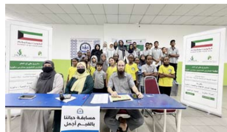
مسابقة «حياتنا بالقيم أجمل»

في إطار حرصها على توفير فرص تعليمية عالية الجودة للطلبة الأشد احتياجاً، وفي سياق مشروع تعليمي جديد، كفلت الهيئة الخيرية الإسلامية العالمية 100 طالب وطالبة من الطلبة المميزين في 7 مدارس عربية بماليزيا، تحت شعار "حقي أن أتعلم"، عبر تسديد رسومهم الدراسية، إلى جانب إطلاق برنامج تروي مصاحب، انتفع به 3300 طالب وطالبة، وذلك بالتعاون مع مؤسسة إنسان للإغاثة والتنمية.