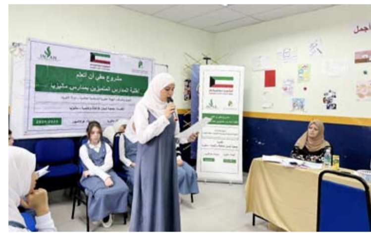
جانب من مشروع «حياتنا بالقيم أجمل»