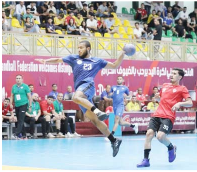
مستوى قوي لشباب اليد رغم الهزيمة