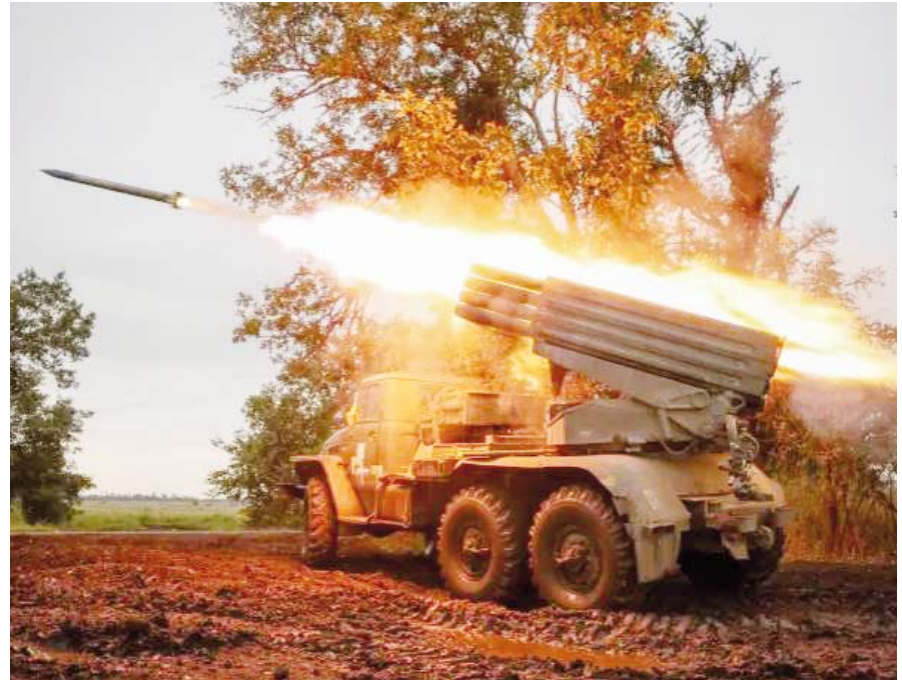
قوات أوكرانية تتشن هجمات مضادة على مواقع يتمركز فيها الروس

أعلنت وزارة الدفاع البريطانية أمس الإثنين قيامها بتدريب أكثر من 23 ألف جندي أوكراني منذ بداية العام الماضي. وأكدت الوزارة في بيان أنها تخطط لتدريب 20 ألف جندي أوكراني خلال هذا العام وذلك ضمن خطة الدعم المالي واللوجستي الذي تعهدت به المملكة المتحدة لأوكرانيا. وأضافت أنه يتم حالياً تدريب عشرات الجنود الأوكرانيين في بولندا على عمليات البحث عن الألغام وتفكيكها مشيرة إلى تقديم 1500 جهاز كشف عن الألغام إلى أوكرانيا بجانب المساعدات الطبية الميدانية المتخصصة.