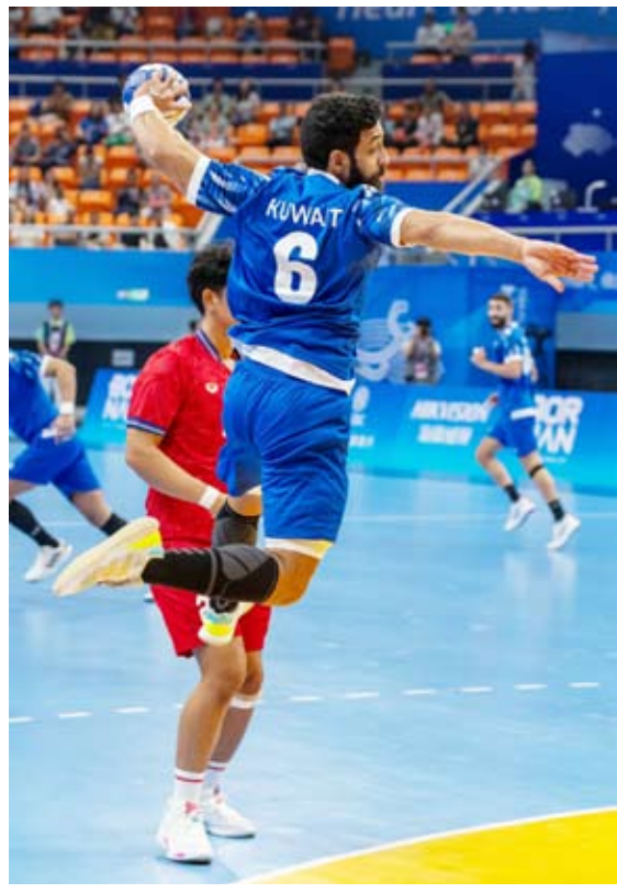
تألق فريق اليد في مستهل المشوار