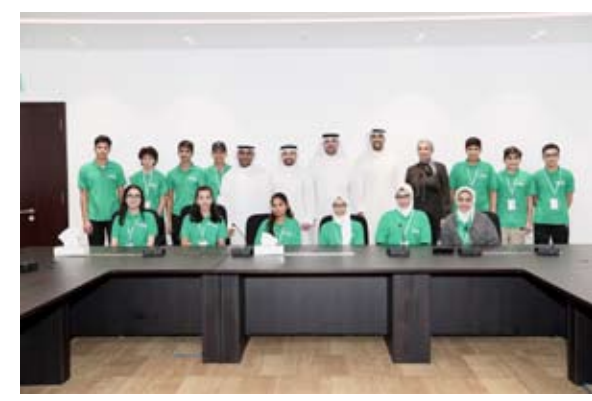
صورة جماعية للمشاركين في الورشة

مع طموحاتهم ومؤهلاتهم في القطاع المصرفي. وأضاف أن البرنامج تضمن استضافة الطلبة المشاركين من خلال ورشة عمل أقيمت في مركز التدريب الرئيسي للبنك قام خلالها مجموعة من