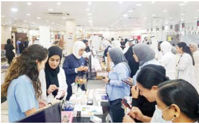
جانب من احتفال مستشفى مبارك بيوم الصيدلي العالمي