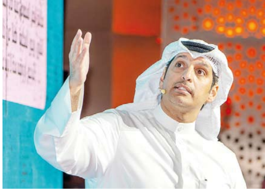
وزير الإعلام : سيتم استقبال أي مقترحات أو ملاحظات لمدة أسبوعين

قال وزير الإعلام ووزير الأوقاف والشؤون الإسلامية عبدالرحمن المطيري أمس إن الحلقة النقاشية لمسودة مشروع قانون تنظيم الإعلام تأتي ترجمة للخطاب السامي لسمو أمير البلاد الشيخ نواف الأحمد، الذي ألقاه بالنيابة عنه سمو ولي العهد الشيخ مشعل الأحمد. وأضاف المطيري خلال الحلقة النقاشية لمسودة قانون تنظيم الإعلام بعنوان «قانون تنظيم الإعلام.. مسؤولية الجميع» أن الجهاز الرسمي الإعلامي للدولة ملك للشعب وترجمة لاستراتيجية وزارة الإعلام التي أطلقها منذ قرابة عامين، موضحاً المحظورات الخاصة بالبنود المتعلقة بقوانين الإعلام الثلاثة التي تطبقها وزارة الإعلام حالياً وقارنها بمسودة قانون تنظيم الإعلام مع تسليط الضوء على عقوباتها السابقة والعقوبات المطروحة في المسودة مضيفاً أنه سيتم استقبال أي مقترحات أو ملاحظات لتعديل هذه المسودة لمدة أسبوعين.