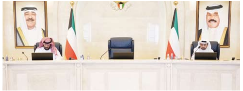
طلال الخالد مترئسا اجتماع مجلس الوزراء اس

1 - منطقة الكويت الحضرية 2 - المنطقة الإقليمية الاقتصادية الشمالية 3 - المنطقة الإقليمية الجنوبية 4 - المنطقة الإقليمية الغربية. كما اطلع مجلس الوزراء على توصية اللجنة الوزارية للخدمات العامة بشأن طلب الهيئة العامة لشؤون الزراعة والثروة السمكية قبول المبادرات المقدمة من عدد من الشركات بشأن إعادة تشجير وزراعة بعض المواقع والميادين العامة بدولة الكويت وقرر مجلس الوزراء الموافقة على هذه المبادرات وتكليف الهيئة بالتنسيق مع الجهات ذات الصلة واتخاذ ما يلزم وفق اللوائح والإجراءات المتبعة بهذا الشأن.