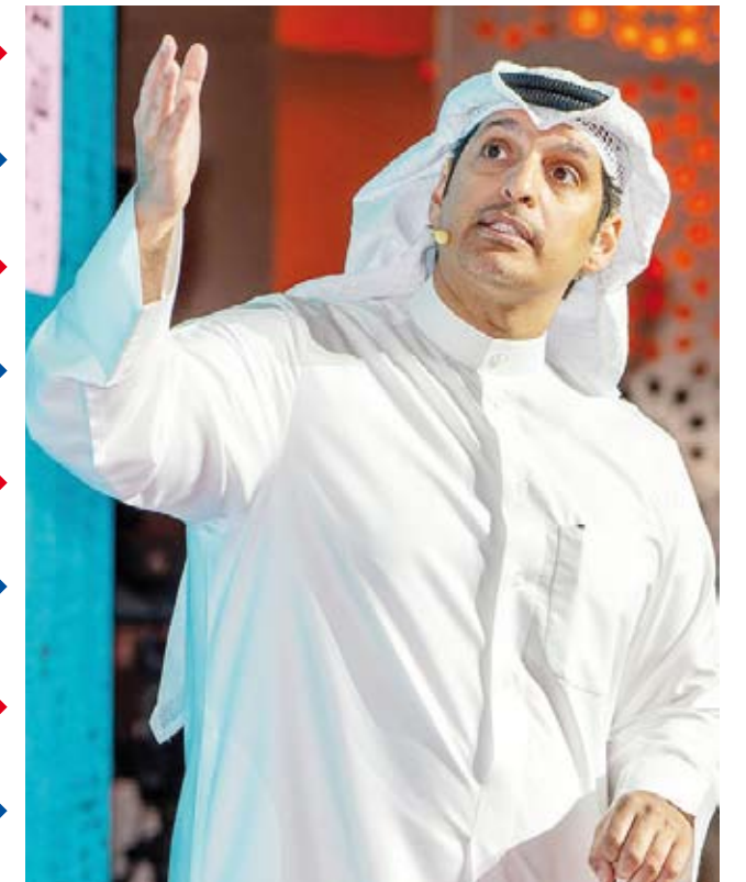
الوزير عبد الرحمن المطيري متحدثا