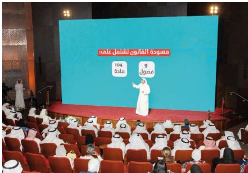
... ويسهب في شرح مواد القانون

أكد وزير الإعلام ووزير الأوقاف والشؤون الإسلامية عبدالرحمن المطيري، خلال حلقة نقاشية بعنوان «قانون تنظيم الإعلام.. مسؤولة الجميع»، الاستماع لكل فكرة يتم طرحها حتى تصل لمنظومة إعلامية تستحقها الكويت، لافتاً إلى أن تاريخنا الإعلامي يشار له بالبنان. وخلال الحلقة النقاشية التي أقيمت بحضور كوكبة من الإعلاميين رؤساء تحرير الصحف المحلية والمهتمين والعاملين في القطاعات الإعلامية المختلفة، قال الوزير المطيري إن هذه الحلقة النقاشية تطبيق وترجمة للخطاب السامي لصاحب السمو والذي القاه نيابة عنه سمو ولي العهد بان جهاز الإعلام ملك للشعب، مبدياً أن استراتيجية الإعلام هي اشتراكية بين المختصين والجمهور، والفاعل الأساسي في الإعلام الفاعلون في المجال الإعلامي. وأضاف إن طريقة عملنا في المسودة مرت بثلاثة مراحل، المرحلة الأولى تم فيها جمع كل الآراء والتجارب والتحديات في المسودة الأولى، وخطابنا بها جهات الدولة ذات العلاقة إلى أن وصلنا للمرحلة الثانية، وهي كيف نطبق قانوننا بلبي احتياجات القطاعات الإعلامية وهي قانون تنظيم الإعلام، واليوم هي المرحلة الثالثة. وقال المطيري: لدينا ثلاثة قوانين مطبقة حالياً، واليوم تجري مقارنة بين القوانين الثلاثة وقانون تنظيم الإعلام، والمعابر التي بنيت عليها القوانين ذات العلاقة والتي حرص على تنظيم الإعلام وتعزيز الحرية والتجارب السابقة. وتابع: المهم لنا أن نسمع التجارب في القوانين الثلاثة المطبقة حالياً في وزارة الإعلام وعلى ضوءها تم إعداد المسودة، ومسودة القانون تشتمل على 9 فصول و104 مواد ومدة العرض سارية لمدة أسبوعين لاستقبال الملاحظات على موقع الوزارة.