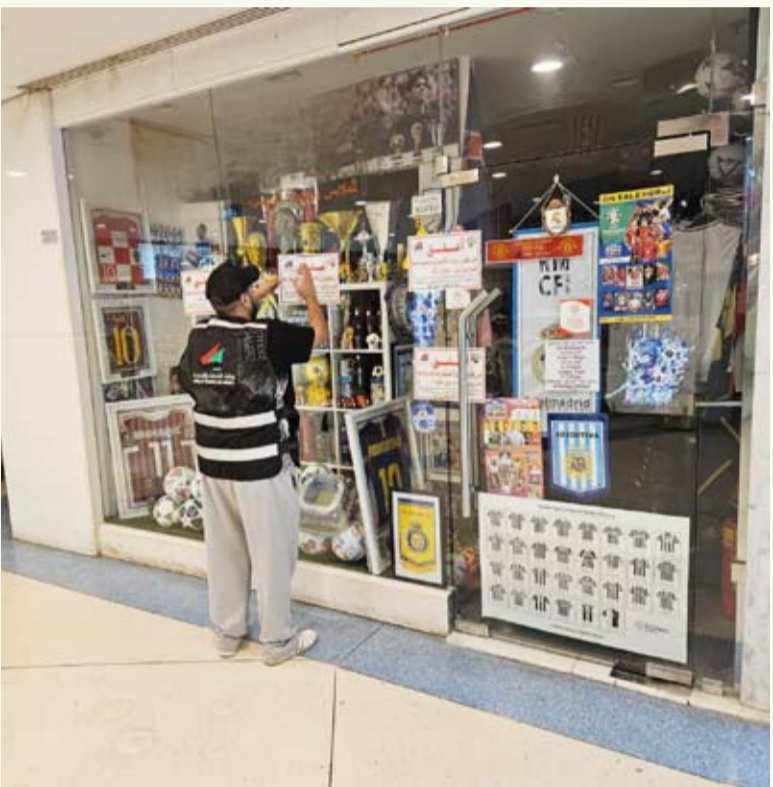
جانب من الجولة التفتيشية

أعلنت وزارة التجارة والصناعة، عن ضبط وإغلاق بالإمر الإداري المباشر محل يحتوي على 3000 قطعة ملابس رياضية تحمل علامات تجارية مقلدة لإحدى الشركات بقصد بيعها على المستهلك. وقالت الوزارة في بيان صحفي أن أمر الإغلاق جاء خلال جولة مفتشي مركز الرقابة التجارية في منطقة السالمية اليومية على الشركات والمحلات التجارية المختصة بمستلزمات الرياضة، وأثناء التدقيق تبين وجود 3000 قطعة ملابس ولوازم رياضية مقلدة تحمل علامات لماركات عالمية، مؤكدة استكمال الإجراءات القانونية من قبل الوزارة وإحالة المخالفة إلى الجهات المختصة لاتخاذ الإجراءات القانونية المعنية في هذا الشأن.