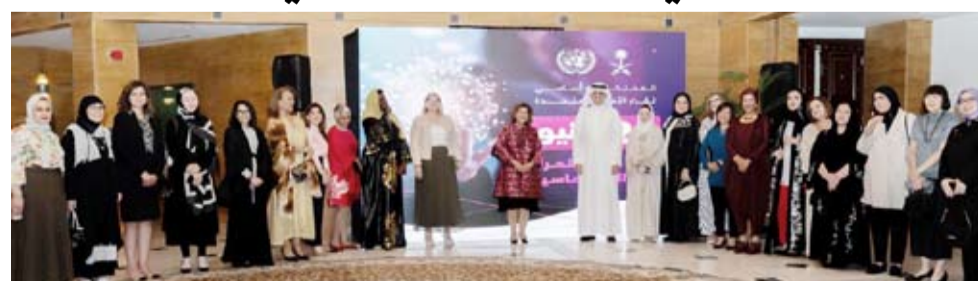
لقطة جماعية خلال الاحتفالية التي أقيمت في مقر سفارة المملكة العربية السعودية

وأوضحت القويبي أنه في ظل قيادة خادم الحرمين الشريفين الملك سلمان بن عبدالعزيز وولي العهد الأمير محمد بن سلمان وفي إطار الرؤية الطموحة للمملكة العربية السعودية 2030 شهدت المرأة السعودية خطوات فعالة مشهودة ولموسة في كافة المجالات والميادين. وأشارت إلى زيادة نسبة النساء السعوديات المنتسبات للسلك الدبلوماسي منوهة بدورهن في وزارة الخارجية والمملكة وقيادتهن ملفات سياسية ومنظمات مهمة إلى جانب العديد من المهام السياسية. ولفقت إلى أن «المرأة السعودية تمثل وطنها بمهنية عالية وتنبوأ اليوم عدداً من المناصب الدولية وقد أثبتت قدرتها على العطاء بكفاءة ومهنية».