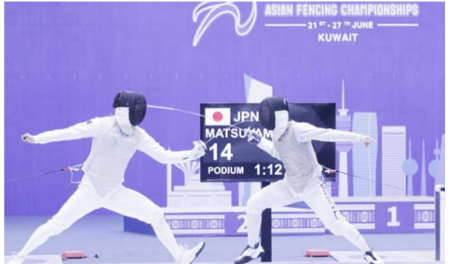
منافسات قوية من بطولة الكويت للمبارزة

وفي منافسات سلاح (سابر) للسيدات فازت اليابانية ميساكي إيمورا بالميدالية الذهبية بتغلبها على الكورية الجنوبية ييسو يوون التي أحرزت الميدالية الفضية فيما نالت اليابانية سيربي أوزاكي والكورية الجنوبية هايونغ جيون الميدالية البرونزية. وتنتقل غداً الثلاثاء منافسات الفرق في سلاح (سابر) للرجال إذ يواجه منتخبنا الوطني نظيره السعودي في حين يخوض منتخبنا الوطني للسيدات منافسات سلاح (إيبهه) أمام سنغافورة.