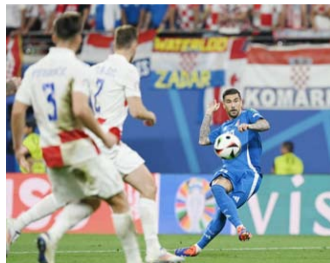
هدف إيطالي في الوقت القاتل

تأهل المنتخب الإيطالي إلى دور الستة عشر ببطولة كأس أمم أوروبا لكرة القدم، وذلك عقب تعادله مع نظيره الكرواتي 1-1، ضمن منافسات الجولة الثالثة بالمجموعة الثانية بالبطولة المقامة حالياً في ألمانيا.