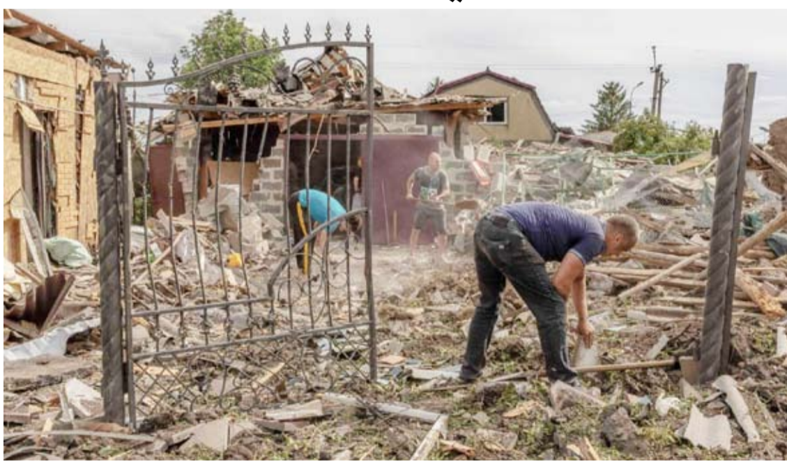
قصف شديد في بوكوفسك منطقة دونيتسك الشرقية