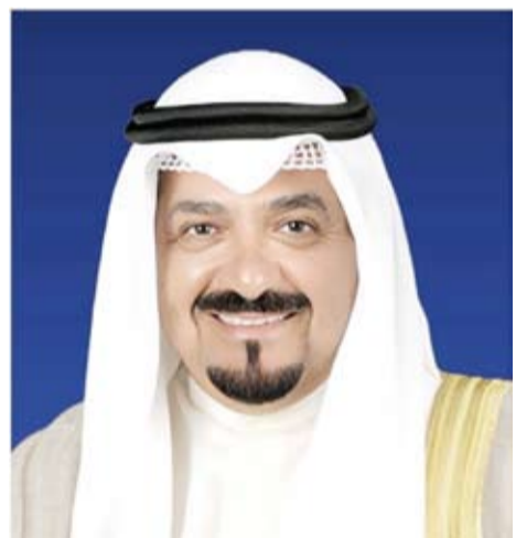
سمو الشيخ أحمد عبدالله

بعث سمو الشيخ أحمد عبدالله رئيس مجلس الوزراء، ببرقية تعزية إلى صاحب الجلالة الملك عبدالله الثاني ابن الحسين ملك المملكة الأردنية الهاشمية الشقيقة، ضمنها سموه خالص تعازيه وصادق مواساته بضحايا حادث شاحنات عسكرية كانت متجهة لقطاع غزة ضمن قافلة مساعدات إغاثية وإنسانية والذي أسفر عن سقوط عدد من الضحايا وإصابة آخرين.