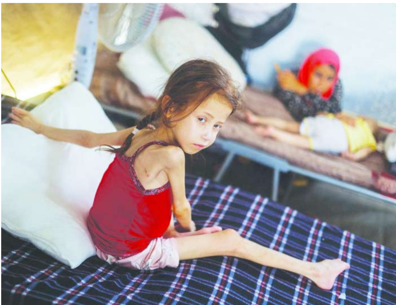
طفلة فلسطينية تعاني سوء التغذية

أعلنت «كتائب القسام» في طولكرم بالضفة الغربية، أن وحدة النخبة المشتركة فيها و«شهداء الأقصى» تمكنت الليلة الماضية من استدراج قوة من الجيش الإسرائيلي لكمين محكم. وقالت «القسام»، في بيان صحافي أورده «المركز الفلسطيني للإعلام»، أنه «في عملية مركبة ودقيقة من خلال الرصد والمتابعة والتسلل الدقيق، جرى