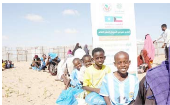
تنفيذ مشروع الأضحى في الصومال