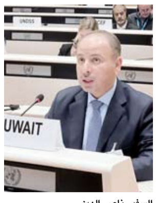
السفير ناصر الهين

وتطرق السفير الهين في كلمته إلى استمرار العدوان الوحشي والسافر من قبل القوة القائمة بالاحتلال في غزة ورفح والتي لا يمكن وصفها إلا بالانتهاك الدولي لكافة الأعراف والقوانين الدولية والإنسانية. وقال في هذا الصدد: إن هذا العدوان المستمر أسفر عنه أكثر من