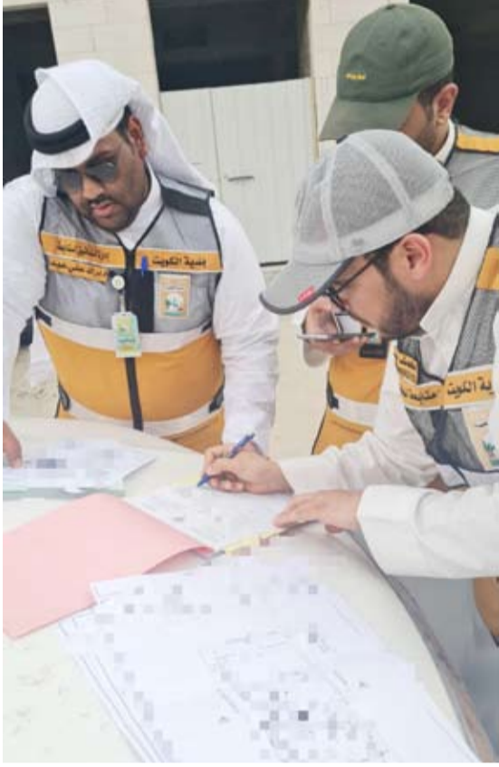
مفتشو البلدية يسجلون مخالفة بناء