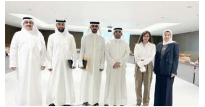
أعضاء فنية البلدي