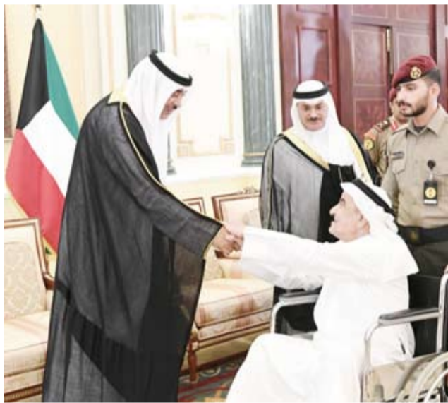
سمو ولي العهد يستقبل أحد المواطنين