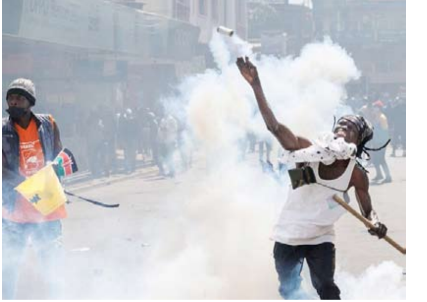
المحتجون اقتحموا مبنى البرلمان بعد مصادمات مع الأمن

لقي 6 أشخاص على الأقل مصرعهم وأصيب آخرون بعد أن أطلقت الشرطة الكينية رصاصاً حياً على متظاهرين في نيروبي احتجاجاً على مشروع لفرض ضرائب جديدة، على ما قالت منظمة العفو في كينيا. وقال المدير التنفيذي للمنظمة في كينيا: رغم تأكيد الحكومة الكينية احترامها الحق في التجمع، يشير مراقبو حقوق الإنسان إلى استخدام متزايد للرصاصة الحي من قبل الشرطة الوطنية في العاصمة نيروبي، مضيفاً: من الملح الآن أن يتمكن الأطباء من المرور بشكل آمن لمعالجة الجرحى العديدين. وقال الإعلام المحلي إن المحتجين اقتحموا مبنى البرلمان الكيني واندلعت حرائق داخل مبناه.