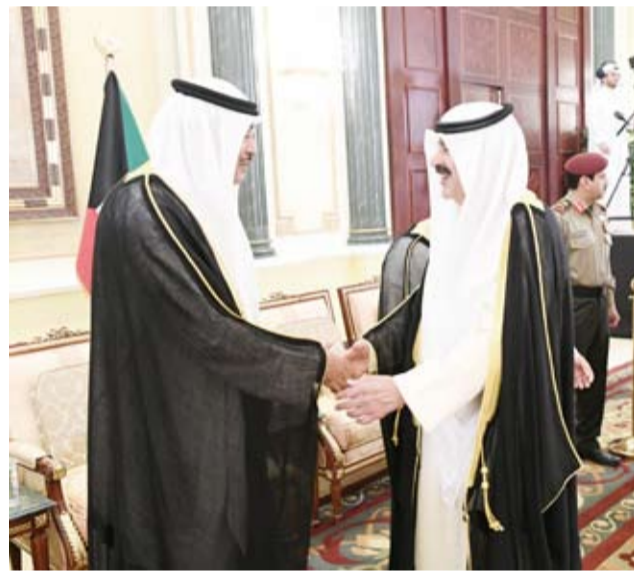
خالد الجارالله يهنئ ولي العهد