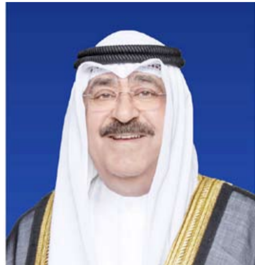
سمو أمير البلاد الشيخ مشعل الأحمد

أعربت وزارة الخارجية، أمس، عن تضامن وتعاطف دولة الكويت مع المملكة الأردنية الهاشمية الشقيقة إثر حادث الشاحنات العسكرية التي كانت متجهة لقطاع غزة ضمن قافلة مساعدات إغاثية وإنسانية مما أدى إلى سقوط