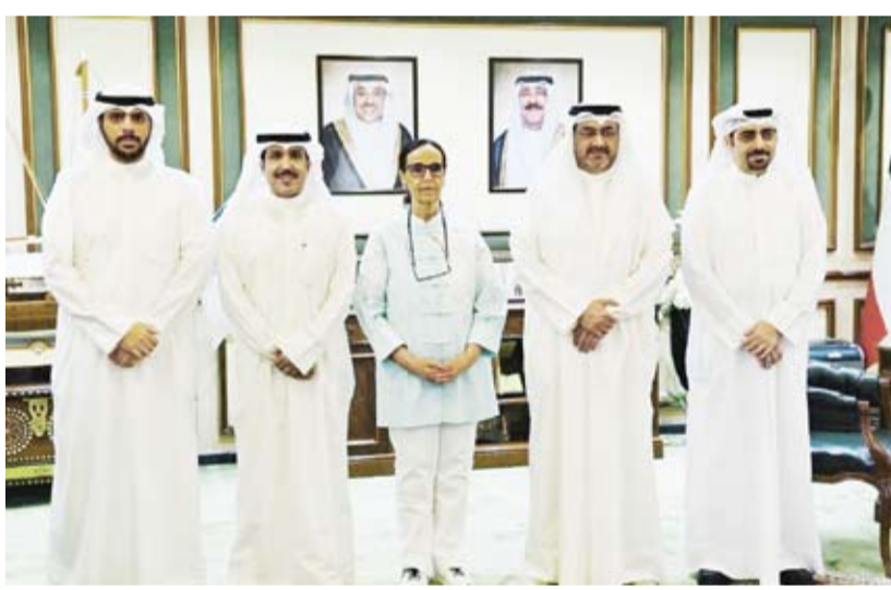
الشيخ عبد الله سالم العلي الصباح مستقبلاً وكيلى «الكهرباء والماء» بحضور الشقيقة أمثال الأحمد

هذه الأزمة المؤقتة بأقل الأضرار. وذكر أن محافظة العاصمة على استعداد تام للتعاون مع وزارة الكهرباء والماء والطاقة المتجددة، وتسخير كافة إمكانياتها للمساعدة في