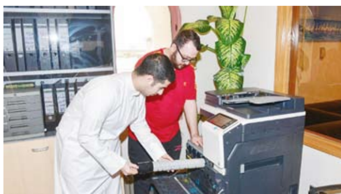
الطلبة المتدربين ضمن برنامج التدريب الميداني في كونا

استضافت وكالة الأنباء الكويتية (كونا)، عدداً من الطلبة المتدربين من الهيئة العامة للتعليم التطبيقي والتدريب ضمن برنامج التدريب الميداني للهيئة قبيل تخرجهم للعام الدراسي 2023-2024.