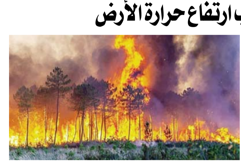
حرائق الغابات تضاعفت خلال السنوات الأخيرة

وخلال نموه، يمتص الغطاء الحرجي ثاني أكسيد الكربون، لكنه يعود بقوة إلى الغلاف الجوي عندما تحترق النباتات، مما يؤدي إلى تفاقم ارتفاع حرارة الأرض الناجمة عن انبعاث غازات الدفيئة. سجلت منذ عام 2017، وأن عام 2023 وهو الأحدث، شهد أعنف حرائق الغابات خلال الفترة التي تمت دراستها. وتستعر الحرائق الشديدة بسبب الجفاف المتزايد نتيجة لارتفاع حرارة الأرض.