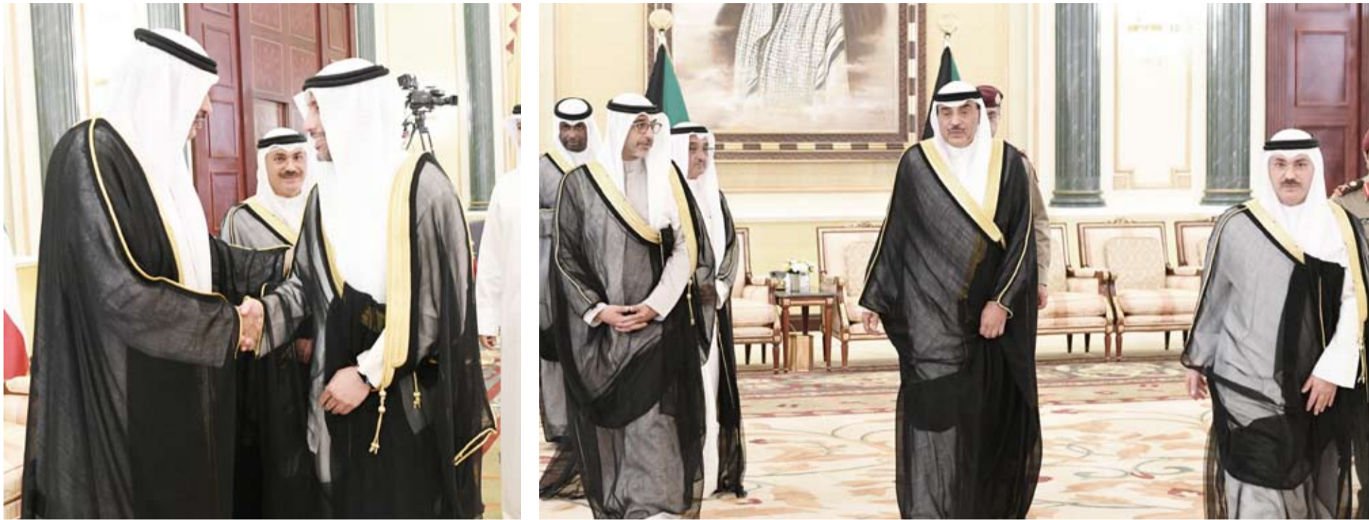
ولي العهد يستقبل مرزوق الغانم

◆ القيادة السياسية تحرص على إشاعة روح المحبة والتسامح ونبذ الفرقة وترسيخ قيم الوفاق ◆ مبدأ الإيمان بروح الأسرة الواحدة في التكوين الكويتي قيادة وشعباً أصبح جسراً ممتداً بين الحاكم والشعب