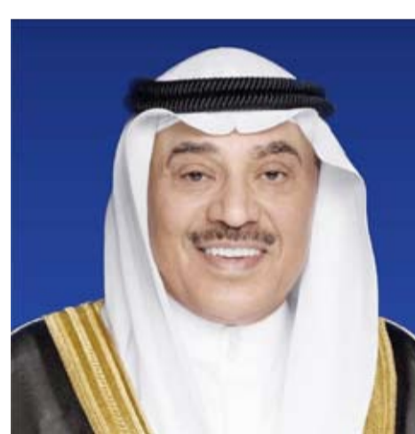
سمو ولي العهد الشيخ صباح الخالد

ببرقية تهنئة إلى الرئيس فيليببي نيوسي رئيس جمهورية موزمبيق الصديقة، ضمنها سموه خالص تهنائه بمناسبة العيد الوطني لبلادها وراجياً لفخامته دوام الصحة والعافية.