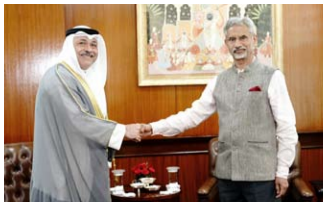
سفير الكويت لدى الهند خلال لقائه وزير الشؤون الخارجية الهندية

الكويت تعد تاسع أكبر مورد للنفط بتوفيرها ثلاثة في المئة من إجمالي احتياجات الهند من الطاقة. وقال السفير الشمالي: إن الوزير الهندي حرص على تقديم الشكر إلى الكويت قيادة وحكومة إزاء اهتمامها بخلفيات حادث الحريق المأساوي الذي وقع في منطقة المتكف جنوبي البلاد وراح ضحيته قرابة 49 شخصاً من المقيمين من الجالية الهندية.