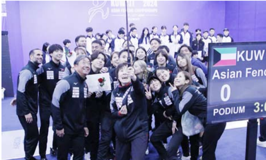
فرحة الفريق الياباني بذهبيته الفردي

تواصلت البطولة الآسيوية للمبارزة التي تستضيفها دولة الكويت حتى الخميس المقبل بمشاركة 350 لاعباً يمثلون 36 دولة وذلك بإقامة منافسات الفردي في لعبتي سلاح (فويل) للرجال و (سابر) للسيدات.