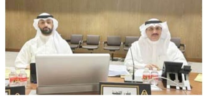
متابعة من أعضاء البلدي

وافقت اللجنة الفنية في المجلس البلدي على طلب وزارة المواصلات تخصيص موقع لمشروع شبكة الألياف الضوئية الكبرى الثالثة في منطقة الصبية.