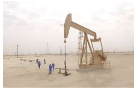
إحدى المنصات النفطية التابعة للشركة

أكدت الشركة الكويتية لفظ الخليج أسس الثلاثاء مواصلتها تنفيذ سلسلة من الإجراءات التقنيةية بهدف الحد من استهلاك الكهرباء في مواقع عملها بما في ذلك مكنتها الرئيسي وعملياتها المشتركة. وذكرت الشركة في بيان صحفي أن هذه الإجراءات تأتي تماشياً مع توجيهات الدولة لتقليل استهلاك الكهرباء وتخفيف الأحمال الكهربائية ومن أجل الحفاظ على استدامة موارد الدولة.