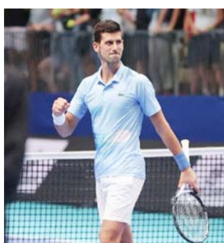
الصربي نوفاك دجوكوفيتش

وقال دجوكوفيتش بطل ويمبلدون سبع مرات: "إنه لن يشارك في البطولة الكبرى على الملاعب العشبية الشهر المقبل إلا إذا كان قادراً على المنافسة على اللقب". وتعرض اللاعب الصربي (37 عاماً) لإصابة في ركبته اليمنى خلال فوزه بالدور الرابع لبطولة فرنسا المفتوحة، وانسحب من دور الثمانية قبل أن يخضع للجراحة في السادس من يونيو الجاري.