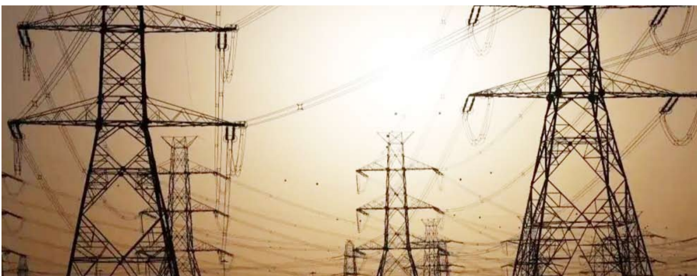
شبكة ضغط عال

ودعت المصادر إلى عدم توقف حملات البلدية على العقارات المخالفة في بقية القطاعات بالدولة، التي تستهلك أحمالاً زائدة لم يكن من المخطط لها وفقاً لمخططات البلدية، والتي يستفيد منها أصحاب تلك العقارات.