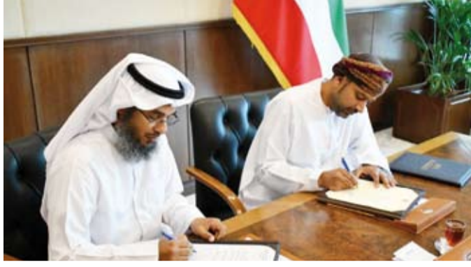
جانب من توقيع الاتفاقية