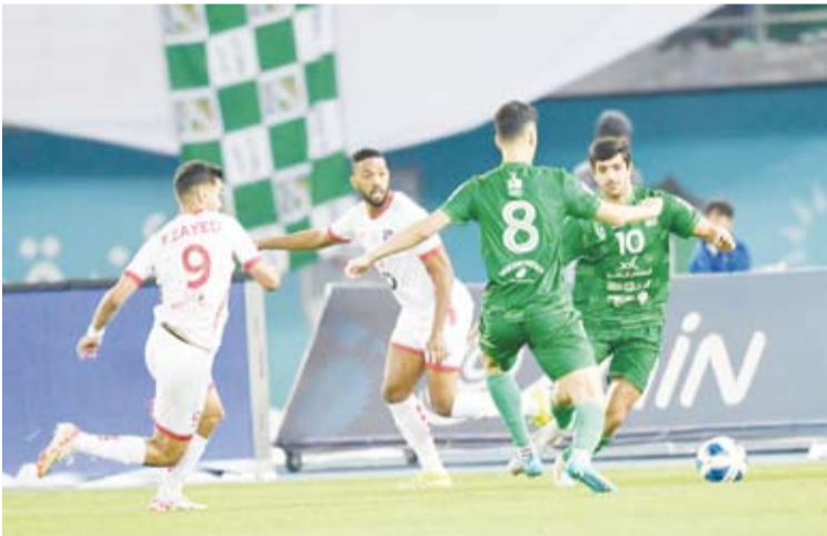
الإثارة عنوان لقاء العربي والكويت

يصطدم طموح فريق العربي لكرة القدم، لبلوغ صدارة الدوري الممتاز، بالكويت حامل اللقب والمتربع على قمة الترتيب بفارق 3 نقاط عن الأخضر، وذلك في المباراة التي ستجمع بينهما اليوم الخميس على استاد صباح السالم بالنادي العربي ضمن منافسات الجولة الأخيرة لمنافسات القسم الثالث لمجموعة البطولة، والتي تشهد أيضاً مواجهة بين السالمية والفحيحيل، والقادسية والنصر، وفي مجموعة الهبوط بالممتاز يلتقي خيطان والشباب، وكاظمة والجبراء.