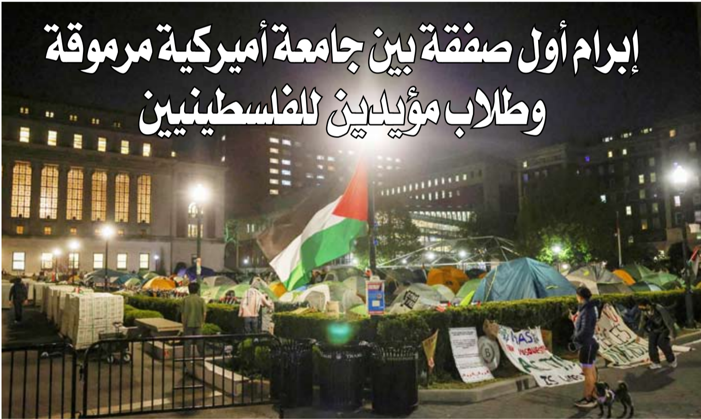
الطلاب يوسعون مخيمًا احتجاجياً لدعم الفلسطينيين