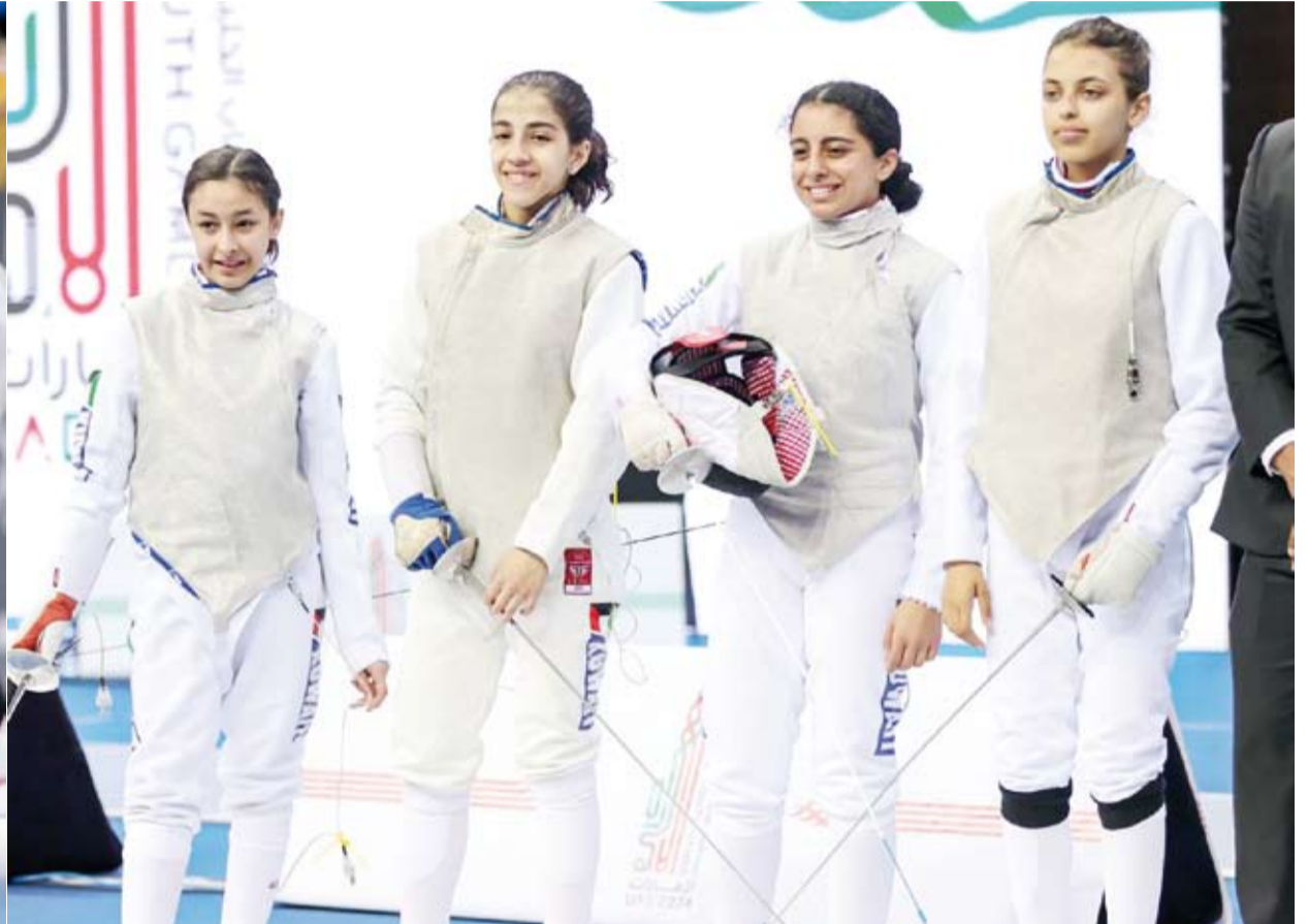
لاعبات الكويت في المباراة حصدن 5 ميداليات متنوعة

3 (X) والملاكمة والتايكوندو والجوجيتسو وكرة الطاولة والمبارزة والكاراتيه والعب القوي والشطرنج والسباحة والريشة الطائرة والترايثلون والجودو والغولف والرياضات الإلكترونية والقوس والسهم. وانطلقت الدورة في 16 أبريل الجاري بمشاركة 3500 رياضي ورياضية من دول مجلس التعاون الخليجي وتشهد منافسات في 24 لعبة رياضية.