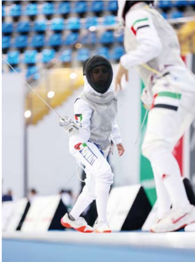
أداء مهبر للاعبات الكويت في المباراة

وأحرز المنتخب التونسي في وقت سابق من اليوم الثلاثاء المركز الثالث في البطولة بعد فوزه على نظيره السعودي بنتيجة (28 - 27) الذي حل رابعاً.