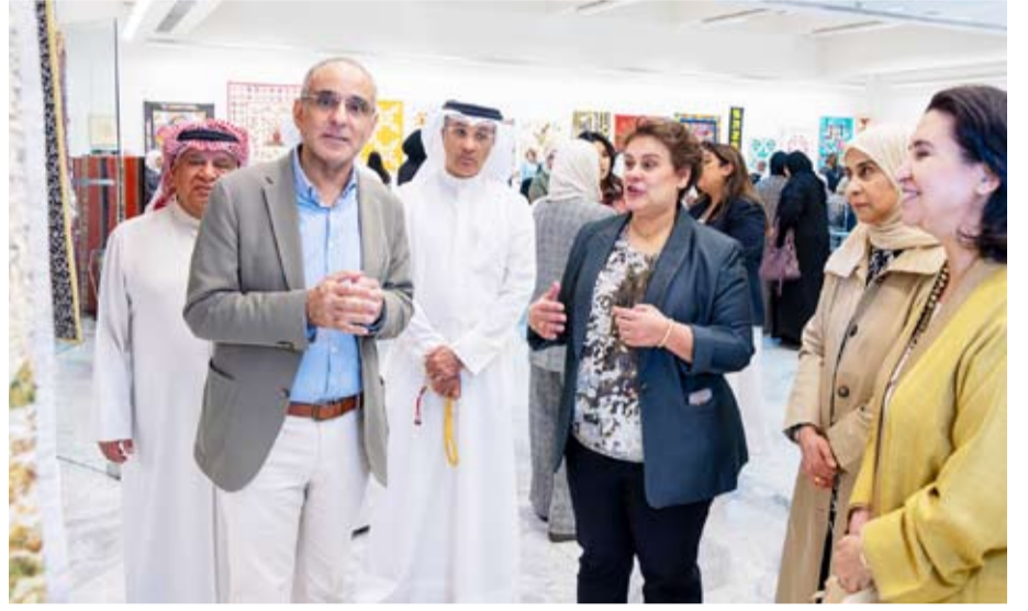
أعمال مميزة في المعرض