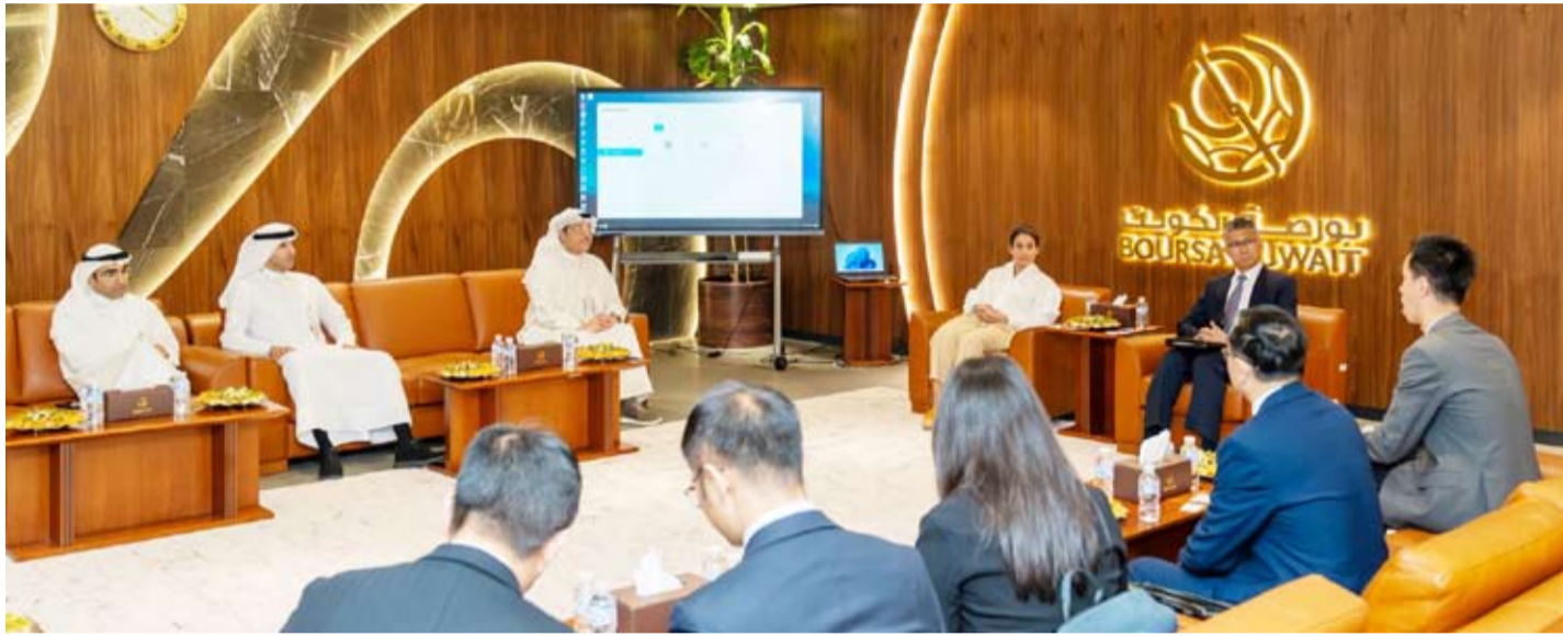
ممثلو وفود الشركات الصينية