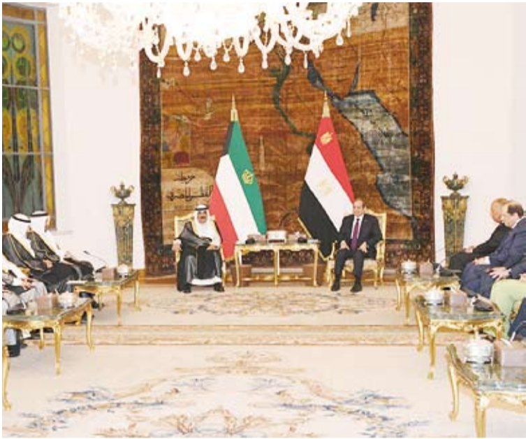
سمو أمير البلاد ورئيس مصر يترأسان جلسة المباحثات الرسمية