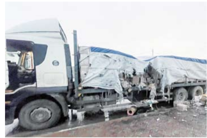
إحدى الشاحنات بعد الاعتداء عليها وتخريب محتوياتها

وقال البيان إن المعتدين على القافلتين ألقوا بعض حمولتهما في الشارع، لكنهما تابعتا مهمتهما حرصاً على إيصال المساعدات في ضوء الكارثة الإنسانية التي تحيق بغزة.