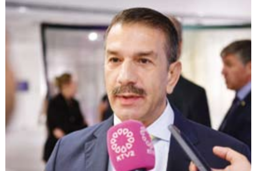
سفير جمهورية قبرص لدى الكويت مايكل مافروس

الحدوث وتشابهان بآثار الصراعات والحروب التي تركت ندوباً في جسد الأرض وفي نفوس ساكنيها. وأوضح مافروس أن معرض (التوازيات الجزرية) يقدم مجموعة متنوعة من الفنانين المعاصرين الذين يدرسون عن كتب الجوانب المعقدة للثقافة القبرصية والكويتية المعاصرة فضلاً عن