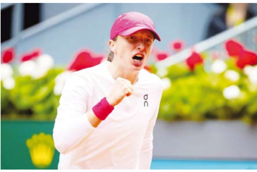
البولندية إيجا شفيونيتك

تأهلت لاعبة التنس البولندية إيجا شفيونيتك المصنفة الأولى عالمياً، إلى الدور نصف النهائي في بطولة مدريد المفتوحة للتنس، بعد فوزها على البرازيلية بياتريس حداد مايا، بمجموعتين مقابل واحدة خلال المباراة التي جمعتهما في دور الثمانية. واستطاعت اللاعبة البولندية تحويل تأخرها بنتيجة 4-6 في المجموعة الأولى، إلى فوز بمجموعتين متتاليتين بواقع 6-0 / 6-2، وتنتظر شفيونيتك في الدور قبل النهائي الفائز من مواجهة التونسية أنس جابر ضد الأمريكية ماديسون كين.