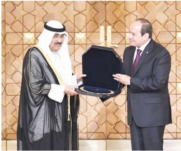
الرئيس المصري يقبل سمو أمير البلاد وسام «قلادة النيل»