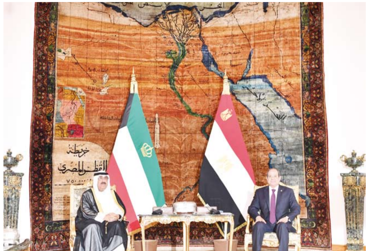
سمو الأمير خلال زيارة الدولة التي استمرت ليومين والرئيس السيسي

ولا شك أن هذه الزيارة تجسد حرص القائمين على الارتقاء بالتعاون المشترك في كافة المجالات بما يخدم مصالح الشعبين الكويتي والمصري، ونأمل أن تترجم حكومة البلدين هذا التقارب بتعاون حقيقي يعكس إيجاباً على كل منهما.