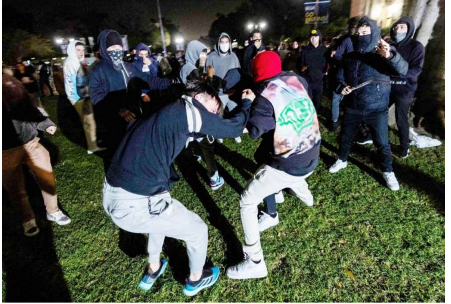
جانب من الصدامات في الجامعة

قال سامي أبو زهري، رئيس الدائرة السياسية لحركة «حماس» في الخارج، عن تصريحات وزير الخارجية الأميركي أنتوني بليكن، إنها «تصريحات مخالفة للحقيقة، وليس غريباً أن تصدر من بليكن المعروف عنه أنه وزير خارجية إسرائيل وليس أميركا، وهي محاولة لممارسة الضغط على حركة (حماس) وتبرئه الاحتلال». وأضاف في تصريحات لـ«رويترز» أن «حماس» لا تزال تبحث أحدث عرض مطروح بشأن وقف إطلاق النار. وقال إن رئيس الوزراء الإسرائيلي بنيامين نتنياهو، باعتراف الوفد المفاوض الإسرائيلي، هو من يعطل التوصل لاتفاق،