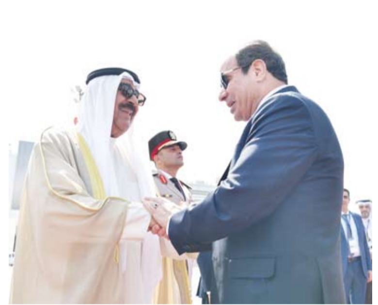
سمو أمير البلاد الشيخ مشعل الأحمد والرئيس عبدالفتاح السيسي قبيل مغادرة سموه القاهرة