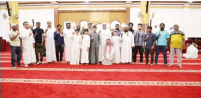
إشهار إسلام في أحد المساجد