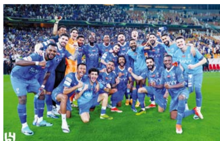
فرحة لاعبي الهلال بالفوز

جدير بالذكر أن آخر فوز للاتحاد على الهلال كان في إبريل 2021 لحساب الجولة 25 من الدوري السعودي، وفاز الاتحاد وقتها (2-0 صفر). ويملك الأهلي الرقم القياسي في عدد مرات الفوز بلقب مسابقة كأس خادم الحرمين الشريفين برصيد 13 لقباً مقابل 10 ألقاب للهلال و9 ألقاب للاتحاد و6 ألقاب للنصر و3 ألقاب للشباب، ولقبين لكل من الاتفاق والوحدة ولقب واحد لكل من الفيحاء والقصيبي والتعاون.