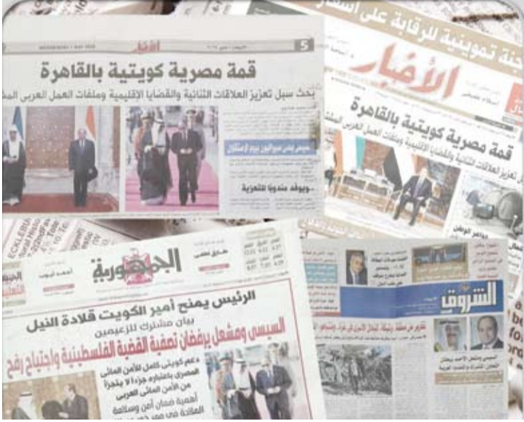
زيارة سمو أمير البلاد تتصدر صفحات الصحف المصرية