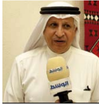
مدير عام مكتب الشهيد متحدثاً لـ «الوسط»