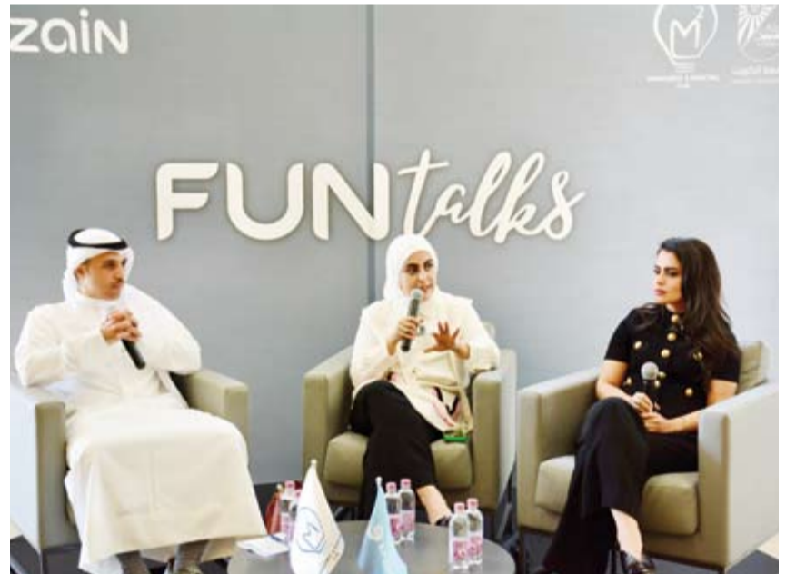
جانب من الجلسة الحوارية