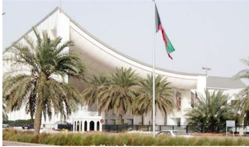
مبنى مجلس الأمة

تتناول الوسط أحداث جرت في مجالس الأمة الكويتي على مدار مراحل مختلفة واليوم نتناول حقيقة ساخنة من الأحداث التي حدثت خلال مجالس الأمة الكويتي من تاريخ 2006 حتى اليوم والبيانية كانت في مجلس 2006