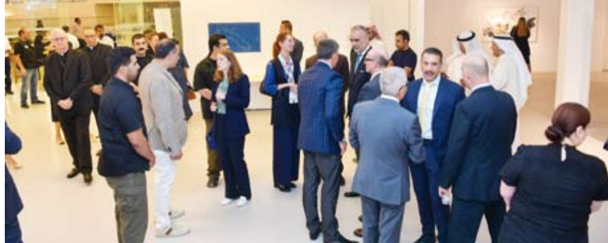
حضور لافت في المعرض