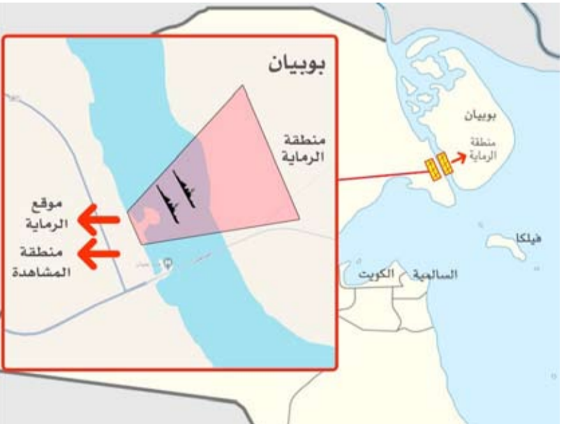
خريطة توضيحية لمنطقة الرماية

أعلن الجيش الكويتي، أمس، أن القوة البرية بمباركة الإدارة العامة لخفر السواحل ستفقدان رماية ساحلية تدريبية بالذخيرة الحية في منطقة الصبية وبويان في الفترة بين 1 و3 يوليو المقبل. وقال الجيش في بيان لمديرية التوجيه المعنوي والعلاقات العامة: إن الرماية وفق الخريطة الميمنة ستفقد من الساعة 5:30 صباحاً ولغاية الساعة 1:30 ظهراً. ودعا جميع المواطنين والمقيمين من مرتادي البر والبحر إلى عدم الاقتراب من المنطقة المذكورة خلال الفترة المعلنه حرصاً منه على سلامة الجميع.