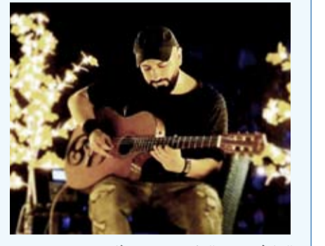
العازف حسين الكندري يبهر عرفا