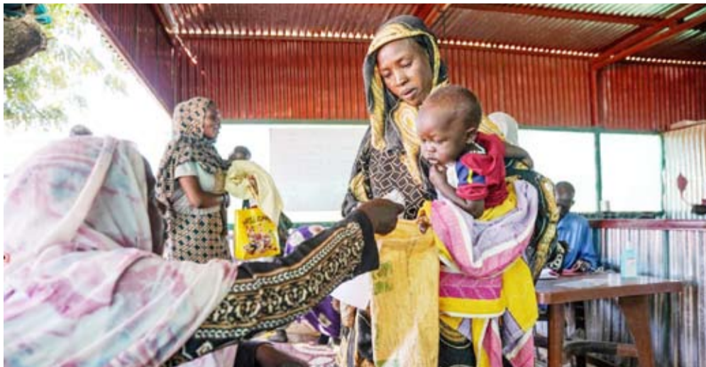
امراة تحمل طفلاً في مخيم مزمز للنازحين

الاتحاد الأفريقي تشكيل لجنة يقودها الرئيس الأوغندي يوري موسيفيني للوساطة بين طرفي الصراع. وقال إن المقترح يمكن أن يأتي في حال فشلت الوساطة الأفريقية في الجمع بين الأطراف السودانية، بعدها سيتجه مجلس الأمن والسلم الأفريقي إلى مجلس الأمن الدولي لاتخاذ قرار وسلطة العديد من وسائل الإعلام الضوء على إنقاذ المدنيين. وأضاف أن المجتمع الدولي يتحدث فقط عن إقليم دارفور، ولا يذكر بقية المناطق في البلاد التي توسعت فيها الحرب، وهذا يعني أن التدخل الأممي يمكن أن يقتصر على دارفور، ويمهد عملياً لفصله. ورأى الخبير العسكري أمين إسماعيل أن نشر قوات لحماية المدنيين تدخل أممي، بدأت خطواته بفرض عقوبات على مسؤولين في الجيش و«الدعم السريع»، وتلى ذلك قرار