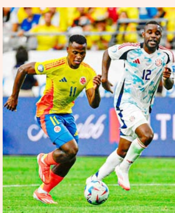
كولومبيا تصدر المجموعة الرابعة بـ6 نقاط

وفي الوقت الذي تسعى فيها إسبانيا لحصد لقب أوروبا للمرة الرابعة والإنفراد بالرغم من القياسي، يامل جمال في أن يتمكن الفريق من المضي قدما مع حلول عيد ميلاده 17 عشية المباراة النهائية.