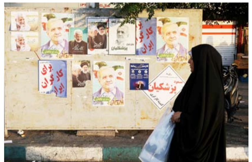
بزشكيان حصل على 10.4 ملايين صوت بينما حصل جليلي على 9.4 ملايين صوت

أعلنت لجنة الانتخابات الإيرانية أمس إجراء جولة ثانية للانتخابات الرئاسية المبكرة بين المرشحين الإصلاحيين مسعود بزشكيان والأصوليين سعيد جليلي يوم الجمعة المقبل لعدم إحراز أي مرشح النسبة المطلوبة من أصوات الناخبين (50 بالمئة + 1) للفوز بالجولة الأولى. وقال المتحدث باسم اللجنة محسن إسلامي في مؤتمر صحفي إنه لم يتمكن أي من المرشحين من الحصول على الغالبية المطلقة من الأصوات في الجولة الأولى وبالتالي سيتم حسم منصب الرئاسة في الجولة الثانية.