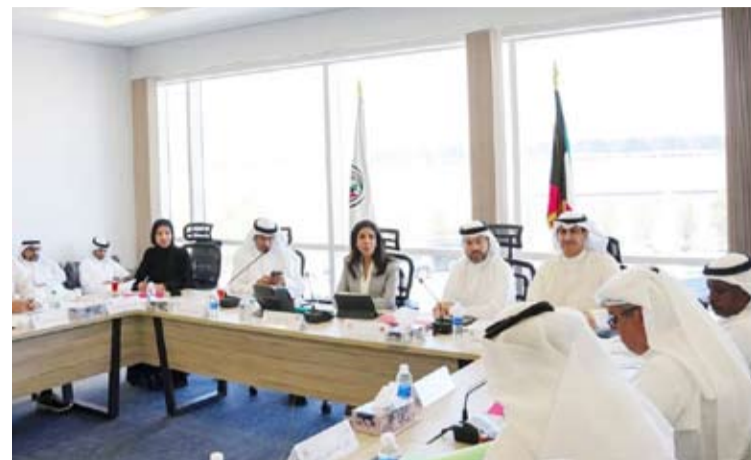
دورة المشعان خلال الاجتماع مع رئيس الإدارة العامة للطيران المدني الشيخ حمود المبارك

وتعزيز الاقتصاد. وأضاف «نحن عازمون على العمل بشكل تعاوني ومكثف لضمان الانتهاء من مبنى الركاب الجديد الذي سيسهم بشكل كبير في تحسين تجربة المسافرين وتوسيع قدرتنا لاستيعاب الزيادة المتوقعة في حركة النقل الجوي». وأشارت إلى أن المشروع يأتي «تأكيداً على التزامنا بتطوير قطاع الطيران المدني ودوره الحيوي في دعم النمو الاقتصادي للبلاد». وأكدت المشعان أهمية هذا المشروع ليس فقط لقطاع الطيران، بل كجزء من استراتيجية أوسع لتحديث وتوسيع البنية التحتية الوطنية مشددة على التزام الوزارة بالعمل الجاد لتحقيق هذه الأهداف المهمة.