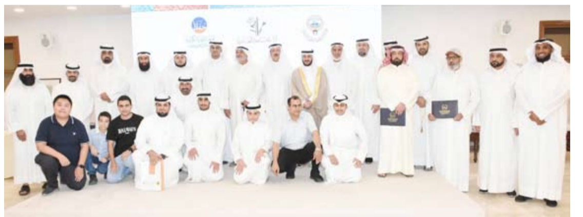
تكريم المشاركين في المسابقة