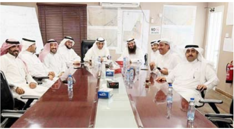
الوزير محمود بوشهري خلال متابعة الموقف التنفيذي للمشروع

محدد، وأهمها الانتهاء من محطة تعبئة المياه وإنارة الطرق في القريب العاجل، إضافة إلى محطات معالجة مياه الصرف الصحي بعد أن تم التنسيق والتعاون بشأنها مع وزارة الأشغال العامة. وأوضح بوشهري بأنه وجه القائمين على المؤسسة على ضرورة التسريع في إجراءات طرح مشاريع المباني العامة والأسواق المركزية والحدائق العامة والزراعات التجميلية التي تخدم سكان المدينة. وأكد بيان كافة القضايا التي تم الإشارة إليها من قبل المواطنين يجري العمل على تنفيذها وفقاً لجدول زمني