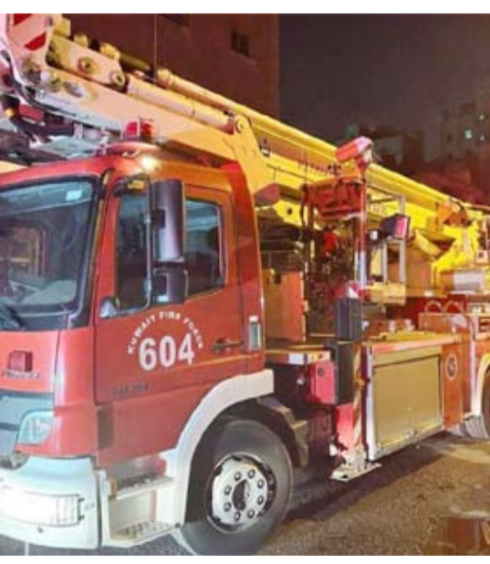
آليات الإطفاء بالموقع