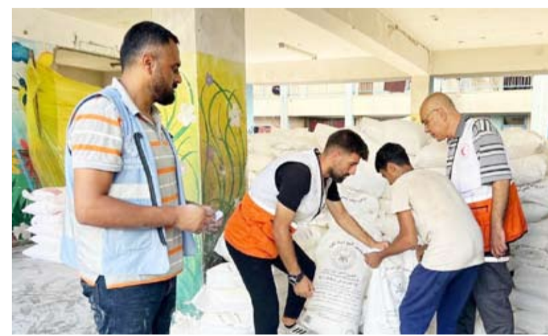
دخول 40 طناً من الطحين إلى «غزة» لمساعدة آلاف النازحين

دولة الكويت آلاف الأطنان من المساعدات الإغاثية والإنسانية لقطاع غزة ولا يزال الجسر الجوي الإغاثي الكويتي مستمراً إلى جانب إرسال عشرات سيارات الإسعاف منذ بدء عدوان الاحتلال الإسرائيلي على القطاع في السابع من أكتوبر الماضي.