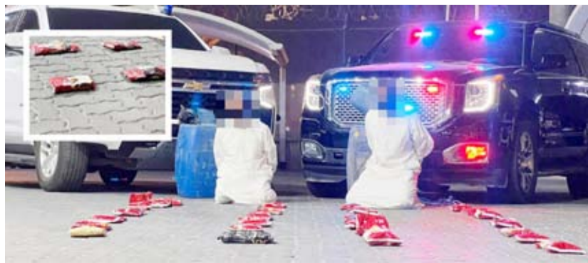
المتهمان مع المضبوطات

تمكنت الإدارة العامة لمكافحة المخدرات وبالتعاون مع الإدارة العامة لخفر السواحل من ضبط شخصين من أرباب السوايق بحقل الاتجار بالمواد المخدرة متورطان بجلب حوالي (30) كيلو جراماً من مادة الحشيش المخدرة وذلك بقصد الاتجار بها بالبلاد، وجرى إحالتهم إلى جهة الاختصاص لاتخاذ كافة الإجراءات القانونية اللازمة بحقهما. ويأتي ذلك استمراراً لجهود وزارة الداخلية في مكافحة آفة المخدرات وتخفيف التعاون الأمني بين الجهات الأمنية المعنية لضبط مهربي وتجار السموم حفاظاً على المجتمع من هذه الآفة المدمرة. وأكدت وزارة الداخلية، أن رجال الأمن مستمرون في التعاون الأمني تصدياً لروحي ومهربي المواد المخدرة وحماية المجتمع والحفاظ عليه، مهيباً بالجميع التعاون مع رجال الأمن والإبلاغ عن أي ظواهر سلبية على هاتف الطوارئ (112) والخط الساخن للإدارة العامة لمكافحة المخدرات 1884141.