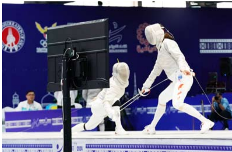
جانب من منافسات نهائي فرق الرجال

أما في منافسات سلاح (سابر) للفرق السيدات فاز الفريق الصيني بالميدالية الذهبية بعد تغلبه على الفريق الكازاخستاني الذي أحرز الميدالية الفضية فيما حققت كوريا الجنوبية الميدالية البرونزية.