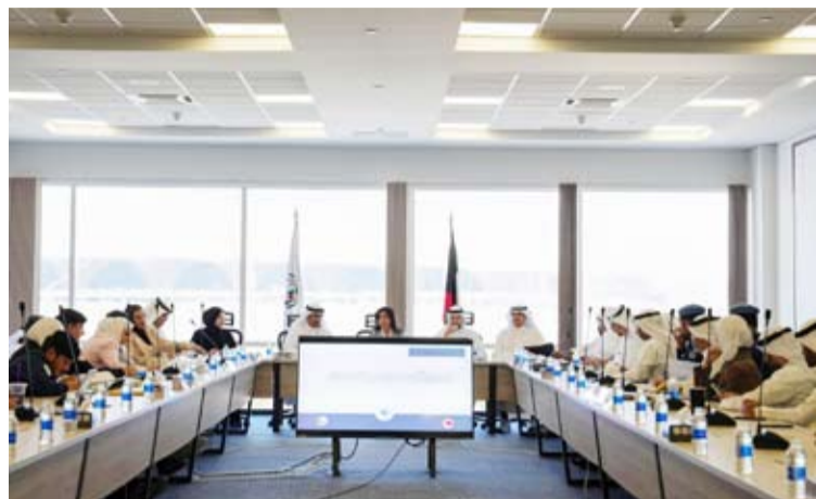
قيادات الطيران المدني والأشغال ومؤسسة الموانئ الكويتية