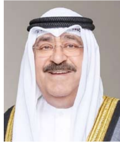
سمو ولي العهد الشيخ صباح خالد

بعث سمو ولي العهد الشيخ صباح خالد، ببرقية تهنئة إلى الرئيس وأفيل رامكالوان رئيس جمهورية سيشل الصديقة، ضمنها سموه خالص تهانئه بمناسبة العيد الوطني لبلاده وراجيا لفخامته دوام الصحة والعافية.