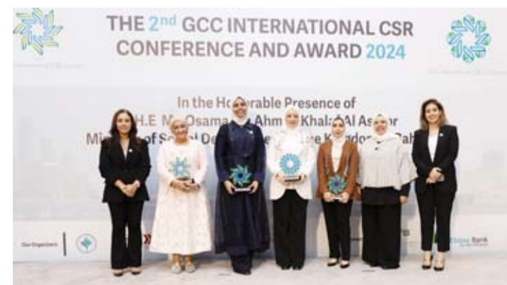
تكريم 3 مؤسسات كويتية بجوائز تقديرية في المؤتمر