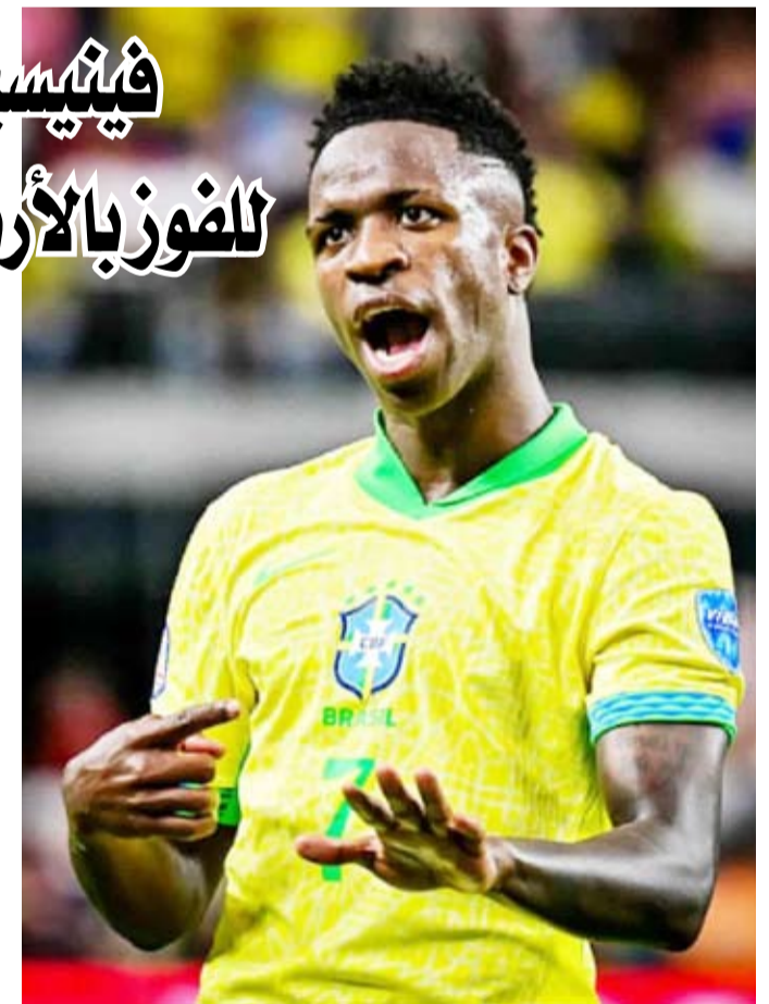
فينيسوس جونيور يحتفل بإحراز هدفين

أحرز فينيسوس جونيور هدفين ليقود منتخب بلاده البرازيل للفوز 4-1 على باراجواي ضمن المجموعة الرابعة في بطولة كوبا أمريكا لكرة القدم في ولاية نيفادا الأمريكية ليعوض الفريق الفائز بلقب البطولة تسع مرات ظهوره الباهت في مباراته الأولى بالبطولة القارية. وكان مهاجم ريال مدريد مصدر تهديد دائم لباراجواي في الجهة اليسرى وهز الشباك أول مرة في الدقيقة 35 عندما أرسل تمريرة لوكاس باكييتا إلى شباك الخصوم منهي بذلك هجمة لفرقه.