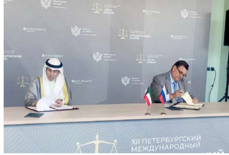
التوقيع على اتفاقيتي التعاون القانوني والقضائي في المسائل الجزائية

في منتدى سانت بطرسبرغ القانوني الدولي الذي يساهم في إبراز القضايا المستحدثة في مجال الفقه القانوني ومواكبة التطورات الدولية والمتغيرات التطبيقية وإمكانية التحديث في مجالات القانون. وأكد حرصه على إبراز دور الكويت في قضية تطبيق النظم الإلكترونية في مختلف الجهات الحكومية في ظل "سياسية حكومة الدولة" في كافة القطاعات.