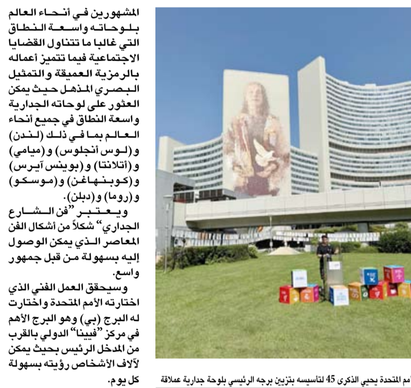
مركز الأمم المتحدة يحيى الذكرى 45 لتأسيسه بتزيين برجه الرئيسي بلوحة جدارية عملاقة

تزينت جدران الأبنية التابعة لمركز الأمم المتحدة في (فيينا) بلوحة فنية عملاقة مميزة 2030 أهداف التنمية المستدامة وقمة المستقبل المقررة إقامتها في (نيويورك) في سبتمبر القادم. وقال الفنان الأسترالي فينتان ماجي في تصريح لـ (كوونا)، أول أسس: إنه يعمل من خلال هذا العمل الفني على تسليط الضوء على دور الأمم المتحدة في تحقيق السلام والحيلولة دون زعزعة عبر عمل جماعي شاق. ويتزامن هذا العمل الفني المعملق مع الاحتفالات الجارية بالذكرى السنوية الـ 45 على افتتاح مركز فيينا الدولي في الـ 23 من أغسطس عام 1979. ويحظى هذا المشروع الفني الذي يقوم به الفنان ماجي ضمن ما يعرف بـ "فن الشارع" بدعم من رؤساء منظمات الأمم المتحدة الرئيسية التي تتخذ من (فيينا) مقراً لها وهي مكتب الأمم المتحدة المعنى بالمخدرات والجريمة والوكالة الدولية للطاقة الذرية ومنظمة معاهدة الحظر الشامل للتجارب النووية ومنظمة الأمم المتحدة للتنمية الصناعية إلى جانب البلد المضيف النمسا وبلدية فيينا، وتمثل اللوحة الجدارية التي تزين مداخل الأمم المتحدة في فيينا رمز التحقيق وأهداف التنمية المستدامة الـ 17 وخاصة الهدف الـ 16 الذي يتعلق بالسلام والعدالة وبناء