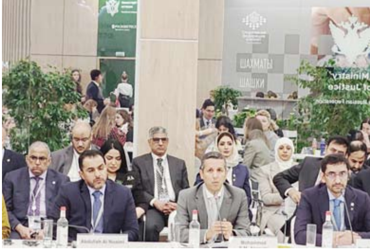
وزير العدل الدكتور محمد الوسمي خلال مشاركته في منتدى بطرسبورغ القانوني الدولي

مضيفاً أن المشاركين في الجلسة عن حكومات الدول استعرضوا تجاربهم وممارساتهم وناقشوا التطورات المتخصصة والمسائل المتعلقة باستخدام الوسائل الرقمية الحديثة في مجال العدالة وهو من الموضوعات التي شغلت حيزاً مهماً من أعمال المنتدى. وأشعار الوسمي إلى "تدشين نظام الكروني لتنفيذ المحاكمات عن بعد" مشيراً إلى تعديل القانون رقم 9 لسنة 2020 ببعض مواد مقل "قانون المرافعات المدنية والتجارية" بحيث يتم إعلان الخصوم في الدعاوى بالإضافة إلى الدعاوى الخاصة بالأحوال الشخصية ومنازعات الأسرة من خلال البريد الإلكتروني أو من خلال أية وسيلة اتصال "إلكترونية حديثة" تسهلاً على المتقاضين وتقليصاً لآمن المحاكمات. وفي سياق منفصل وعلى هامش أعمال المنتدى قام الوزير الوسمي بعقد لقاء معني بتعزيز سياقات التعاون الثنائي في المجال القانوني والقضائي حيث تم عقد لقاء مشترك لوزراء العدل بدول مجلس التعاون الخليجي ضم مشاورات لتوحيد الرؤى حيال قضايا أساسية شملها جدول أعمال المنتدى القانوني الدولي.