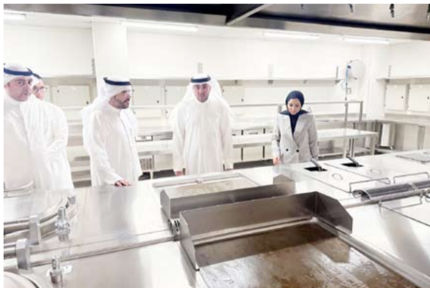
د.أمال الحويطة خلال الجولة التفقدية

يساهم في تأهيلهم لسوق العمل مستقبلاً. كما شملت قسم الدعم النفسي والاجتماعي الذي يضم فريقاً من الاختصاصيين لتقديم جلسات دعم وإرشاد للأحداث لمساعدتهم على تجاوز التحديات النفسية والاجتماعية التي يواجهونها. وجالت الوزيرة أيضاً على المرافق الترفيهية والرياضية ومنها الملاعب والصالات المجهزة التي تتيح للأحداث ممارسة الأنشطة البدنية والترفيهية ما يعزز صحتهم الجسدية والنفسية إضافة إلى المكتبة التي توفر مجموعة واسعة من الكتب والمواد التعليمية التي تهدف إلى تحفيز الأحداث على القراءة وتنمية مهاراتهم الفكرية والثقافية.