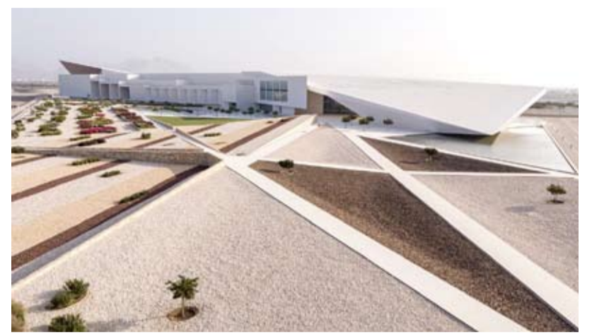
متحف «عُمان عبر الزمان»