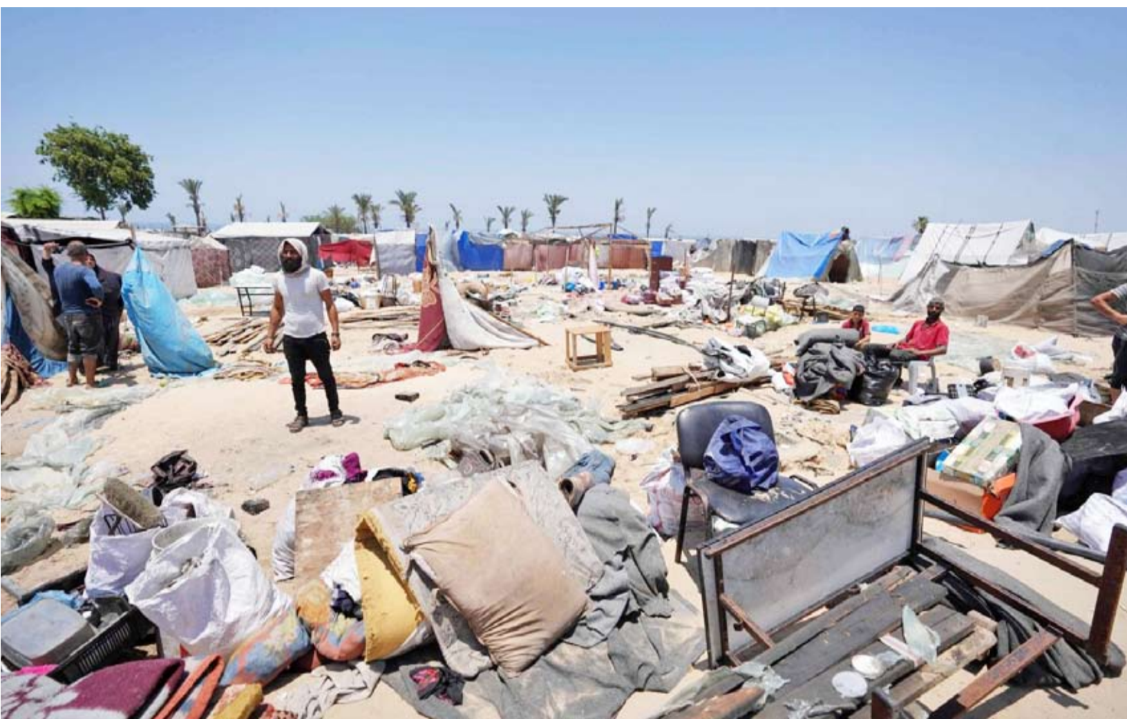
نازحون فلسطينيون يستعدون لإخلاء منطقة المواصي