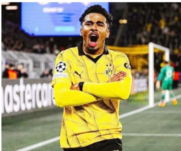
المدافع الهولندي ايان ماتسن

وساعد اللاعب الفريق الألماني على بلوغ نهائي دوري أبطال أوروبا أمام ريال مدريد في وقت سابق من هذا الشهر بعد أن هز الشباك في الفوز بدور الثمانية على أثلتيكو مدريد.