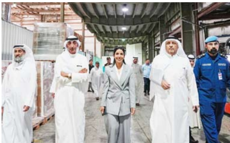
جولة الوزراء التقفدية لمخازن الأمن الغذائي التابعة لمؤسسة الموانئ الكويتية في ميناء عبد الله