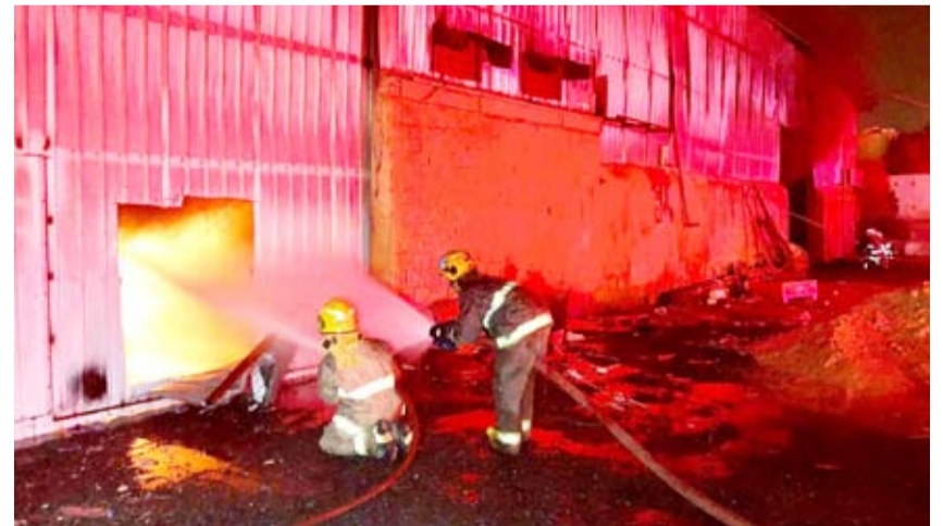
رجال الإطفاء يخمدون النيران