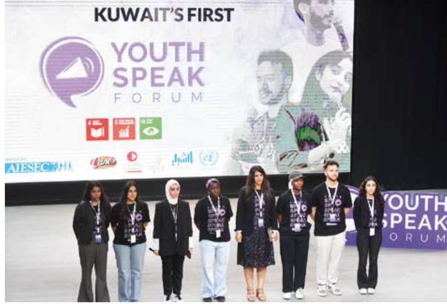
بعض الشباب المشارك في المنتدى