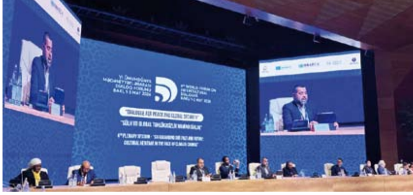
مندوب الكويت الدائم بـ«يونيسكو» السفير د.آدم الملا متحدثاً

وتحديث وثيقة سياسة بشأن دمج اعتبارات تغير المناخ في ممارسات الحفاظ على التراث. وكأنت (الوثيقة السياسية المحدثة بشأن العمل المناخي للتراث العالمي) اعتمدت بعد مناقشات متعمقة وتوصية الدول الأعضاء في عام 2023. وأشار السفير الملا في مداخلة إلى البعد العالمي، موضحاً أن مواجهة تغير المناخ يتطلب عملاً متعدد الأبعاد وتعاوناً متعدد الأطراف، فيما أكد أن هذا يستدعي مشاركة (يونيسكو) الدول الأعضاء مع أصحاب المصلحة الدوليين. كما دعا إلى تعاون «فعلي وعميق» مع قطاعات التعليم والثقافة والعلوم الاجتماعية والإنسانية لليونسكو عبر برامج وممارسات جديدة وتعبئة الموارد. وأعرب عن أمه في أن يشكل هذا الحوار بذرة لتعزير العمل على المستوى العالمي في الحفاظ على التراث في مواجهة تغير المناخ.