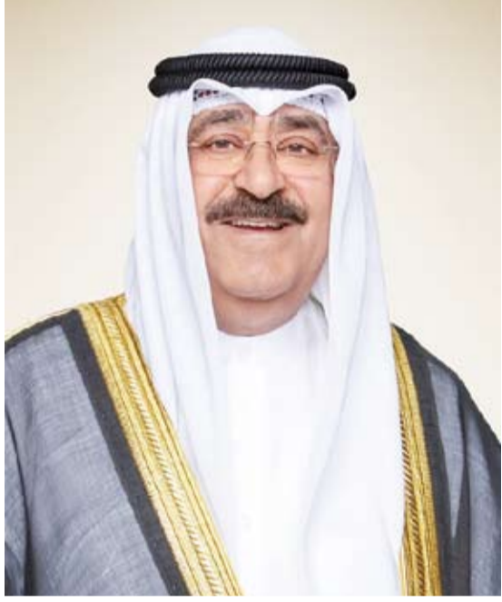
سمو أمير البلاد الشيخ مشعل الأحمد

كما بعث صاحب السمو أمير البلاد الشيخ مشعل الأحمد، ببرقية تعزية إلى أخيه صاحب السمو الملكي الأمير محمد بن سلمان ولي العهد رئيس مجلس الوزراء في المملكة العربية السعودية الشقيقة، أعرب فيها عن خالص تعازيه وصادق مواساته بوفاة المغفور له بإذن الله تعالى صاحب السمو الملكي الأمير بدر بن عبدالمحسن بن عبدالعزيز. سائلاً سموه، المولى تعالى، أن يتغمده بواسع رحمته ويسكنه فسيح جناته وأن يلهم الأسرة المالكة الكريمة جميل الصبر وحسن العزاء.