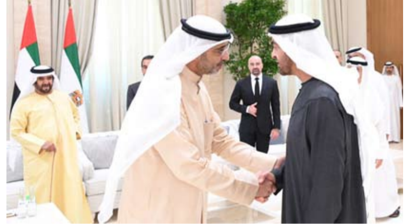
ممثل سمو أمير البلاد يقدم العزاء لرئيس دولة الإمارات

قام ممثل صاحب السمو أمير البلاد الشيخ مشعل الأحمد، وزير شؤون الديوان الأميري الشيخ محمد العبدالله، صباح أمس، بتقديم واجب العزاء إلى صاحب السمو الشيخ محمد بن زايد آل نهيان رئيس دولة الإمارات العربية المتحدة الشقيقة وأسرة آل نهيان الكرام بوفاة المغفور له بإذن الله تعالى، سمو الشيخ طحنون بن محمد آل نهيان ممثل الحاكم في منطقة العين (طيب الله ثراه وجعل الجنة مثواه)، وذلك في قصر المشرف بالعاصمة أبوظبي.