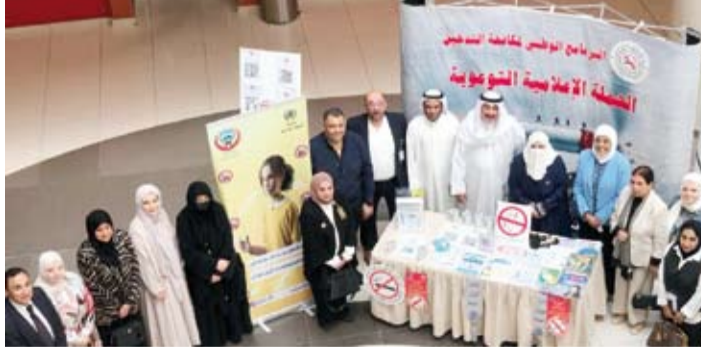
المشاركون في فعاليات الحملة التوعوية

قال نائب رئيس البرنامج الوطني لمكافحة التدخين، الدكتور أحمد الشطي: إن الحملة التوعوية للبرنامج المقامة حالياً بالتعاون مع إدارة تعزيز الصحة في وزارة الصحة، تضم أكثر من 30 فعالية على مدار شهر مايو الجاري تحت شعار (حماية الأطفال من تدخلات صناعة التبغ). وأضاف الشطي لـ (كونا)، أول أمس، أن الفعاليات تقام في المجمعات التجارية والمدارس ومراكز تنمية المجتمع ومركز الرعاية الصحية الأولية ودورات تدريب للفريق الطبي وأفراد الصحة المدرسية لتعزيز ثقافة التوعية الصحية للتحذير من مخاطر التدخين عموماً ووسائل تعاطيها التي تنتشر بين الأطفال واليافعين خصوصاً. وأوضح أن هناك ثمانية ملايين وفاة سنوياً في العالم بسبب استهلاك التبغ يناواعة