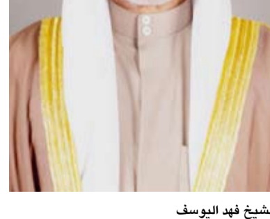
الشيخ فهد اليوسف

بعث نائب رئيس مجلس الوزراء وزير الدفاع ووزير الداخلية بالوكالة الشيخ فهد اليوسف ببرقية تعزية إلى صاحب السمو الملكي الأمير خالد بن سلمان وزير الدفاع بالمملكة العربية السعودية الشقيقة ضمنها معاليه خالص تعازيه وصادق مواساته بوفاة المغفور له بإذن الله تعالى صاحب السمو الملكي الأمير بدر بن عبدالمحسن (طيب الله ثراه). داعياً المولى عز وجل أن يتغمده الفيد بواسع رحمته ويسكنه فسيح جناته وأن يلهم الأسرة المالكة الكريمة جميل الصبر وحسن العزاء.