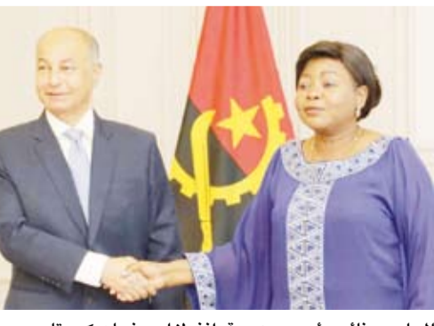
المسلم مع نائب رئيس جمهورية انغولا سبرنسا ديكوستا

طلب انغولا تنظيم بطولة العالم للسباحة ناشئين عام 2027 إلى جانب استمرار دعم الاتحاد الدولي لحوض الأمانة للسباحة في انغولا. استفاد من برنامج محو أمية السباحة أكثر من 300 ألف طفل و150 مدرس تربية بدنية منذ عام 2023.