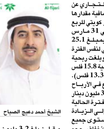
الشيخ أحمد دعيج الصباح

أعلن البنك التجاري عن تسجيل أرباح صافية مقدارها 28.3 مليون دينار كويتي للربع الأول المنتهي في 31 مارس 2024 مقارنة بمبلغ 25.1 مليون دينار كويتي لنفس الفترة من العام الماضي، وبلغت ربحية السهم للفترة الحادية 15.8 فلس (مارس 2023: 13.3 فلس). ويعود الارتفاع في الأرباح الصافية بمقدار 3.2 مليون دينار كويتي خلال الفترة الحالية بشكل رئيسي إلى الزيادة المسجلة على مستوى جميع قطاعات النشاط وانخفاض حجم المخصصات. وتحققاً على النتائج المالية للبنك، أعرب رئيس مجلس الإدارة الشيخ أحمد دعيج الصباح عن سعادته بالنتائج التي حققها البنك التجاري للفترة المنتهية في 31 مارس 2024 حيث بلغت الأرباح الصافية 28.3 مليون دينار كويتي، وهذه تعكس نمواً على أساس سنوي