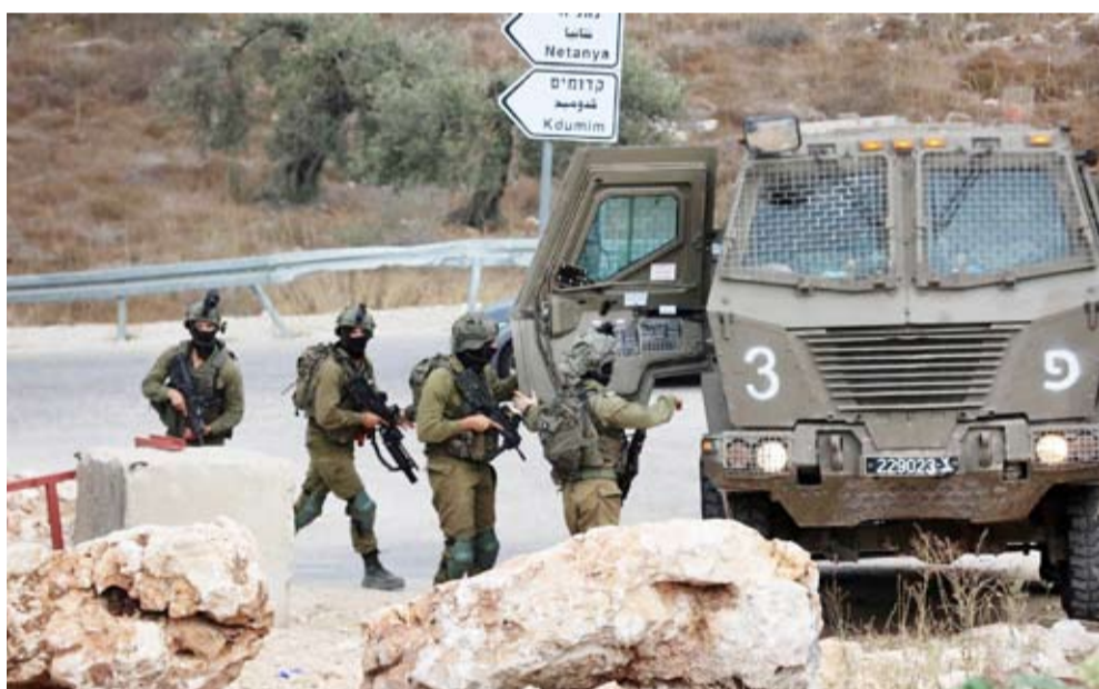
صهاينة يتقحمون بلدات فلسطينية