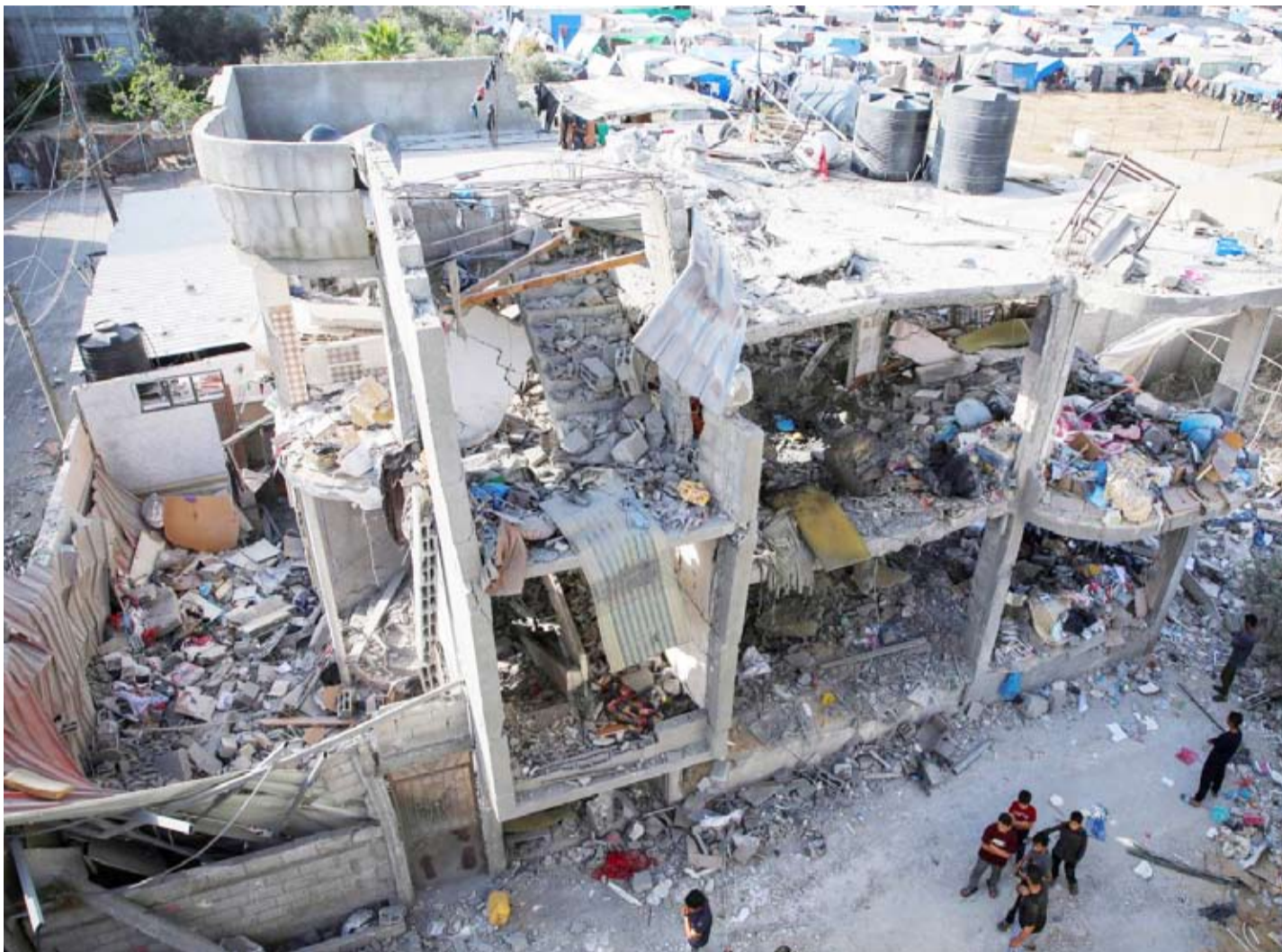
الكيان الصهيوني يواصل قصف المنازل

نقلت قناة «القاهرة الإخبارية» التلفزيونية عن مصدر رفيع المستوى قوله إن الوفد الأمني المصري الذي يتوسط في عملية التفاوض بين إسرائيل وحركة «حماس»، وصل إلى صيغة توافقية حول الكثير من نقاط الخلاف». وقال المصدر للقناة إن وفد «حماس» وصل إلى مصر وإن هناك تقدماً ملحوظاً في المفاوضات. وفي وقت سابق، كشف مصدر عربي مطلع لوكالة أنباء العالم العربي، أن الاتفاق بين حركة «حماس» وإسرائيل «بات وشيكاً»، في حال لم تطرأ أية عقبات جديدة، مؤكداً أن «حماس تعاملت مع المقترح المصري