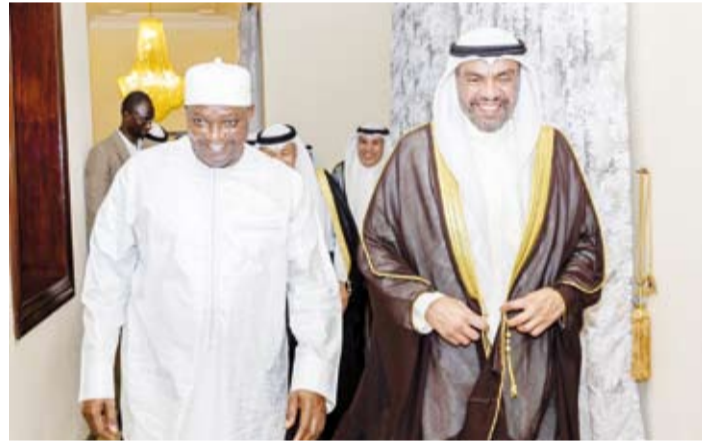
ممثل سمو أمير البلاد يلتقي رئيس غامبيا

يشهد تطورات بالغة الأهمية مختلف القضايا المرتبطة بالعالم الإسلامي لإسما قضية المنظمة المركزية الأ وهي القضية الفلسطينية. وتبحث القمة القضايا والتحديات التي تواجه الدول الأعضاء وهي القضايا الاقتصادية والإنسانية والاجتماعية والثقافية وقضايا الشباب والمرأة والأسرة والعلوم والتكنولوجيا والإعلام والمجتمعات والأقليات المسلمة في الدول غير الأعضاء بالمنظمة. كما ستناقش القمة المسائل المتعلقة بنيد خطاب الكراهية وظاهرة كراهية الإسلام (الإسلاموفوبيا) وتعزيز الحوار وقضايا التغيير المناخي والأمن الغذائي. ومن المتوقع أن يتضمن البيان الختامي لندورة مواقف المنظمة إزاء القضايا المعروضة على القمة وقرار بشأن فلسطين والقدس الشريف و(إعلان بانجول).