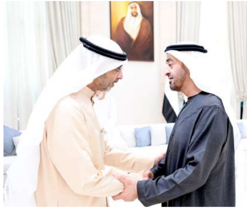
سمو الشيخ محمد بن زايد يتلقى العزاء من ممثل سمو أمير البلاد

قام ممثل سمو أمير البلاد الشيخ مشعل الأحمد ، وزير شؤون الديوان الأميري الشيخ محمد العبدالله ، صباح أمس بتقديم واجب العزاء إلى سمو الشيخ محمد بن زايد آل نهيان رئيس دولة الإمارات العربية المتحدة الشقيقة وأسرة آل نهيان ، بوفاء المغفور له بإذن الله تعالى سمو الشيخ طحون بن محمد آل نهيان ممثل الحاكم في منطقة العين ، وذلك في قصر المشرف بالعاصمة أبوظبي .