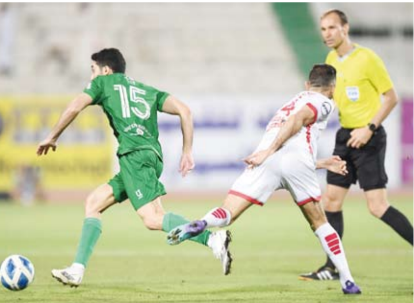
جانج من المباراة

انتهاء الموسم الكروي. وتمكن العربي من خطف هدف في الدقيقة الـ 96 من المباراة ليخرج متعادلاً مع الكويت متصدر الترتيب بـ 54 نقطة فيما ظل العربي محافظاً على المركز الثاني بـ 51 نقطة. وتستكمل مواجهات الجولة يوم غد الجمعة بقاء القادسية مع النصر على استاد محمد الحمد.