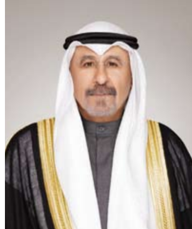
سمو الشيخ الدكتور محمد الصباح

بعث سمو الشيخ الدكتور محمد الصباح رئيس مجلس الوزراء المكلف بتصريف العاجل من الأمور، ببرقية تعزية إلى خادم الحرمين الشريفين الملك سلمان بن عبدالعزيز ملك المملكة العربية السعودية الشقيقة، ضمنها سموه خالص تعازيه وصادق مواساته بوفاة المغفور له بإذن الله تعالى صاحب السمو الملكي الأمير بدر بن عبدالمحسن بن عبدالعزيز. كما بعث سمو الشيخ الدكتور محمد الصباح رئيس مجلس الوزراء المكلف بتصريف العاجل من الأمور، ببرقية تعزية إلى أخيه صاحب السمو الملكي الأمير محمد بن سلمان ولي العهد رئيس مجلس الوزراء في المملكة العربية السعودية الشقيقة، ضمنها سموه خالص تعازيه وصادق مواساته بوفاة المغفور له بإذن الله تعالى صاحب السمو الملكي الأمير بدر بن عبدالمحسن بن عبدالعزيز.