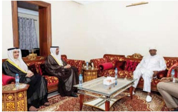
جانب من اللقاء