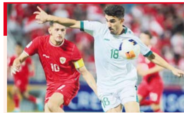
مراقبة من لاعب أندونيسيا للاعب العراق

تاهل منتخب العراق الأولمبي لكرة القدم إلى أولمبياد باريس التي ستقام في شهر يوليو المقبل بعد حصوله على المركز الثالث في بطولة كأس آسيا تحت 23 عاماً إثر فوزه على نظيره الأندونيسي (1-2). وخطف المنتخب العراقي إحدى بطاقات التأهل الثلاث بعد تمديد الوقت الأصلي للمباراة التي شوطين إضافيين