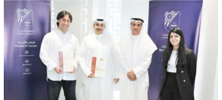
جانين من التكريم

أعلنت مؤسسة الكويت للتقدم العلمي، أسماء الفائزين بجائزة الكويت في دورتها الـ42 لعام 2023، التي تمنحها المؤسسة سنوياً للعلماء الكويتيين والعرب ممن حققوا إنجازات بارزة ومساهمات علمية وفكرية متميزة في مسيرتهم البحثية على المستوى العالمي.