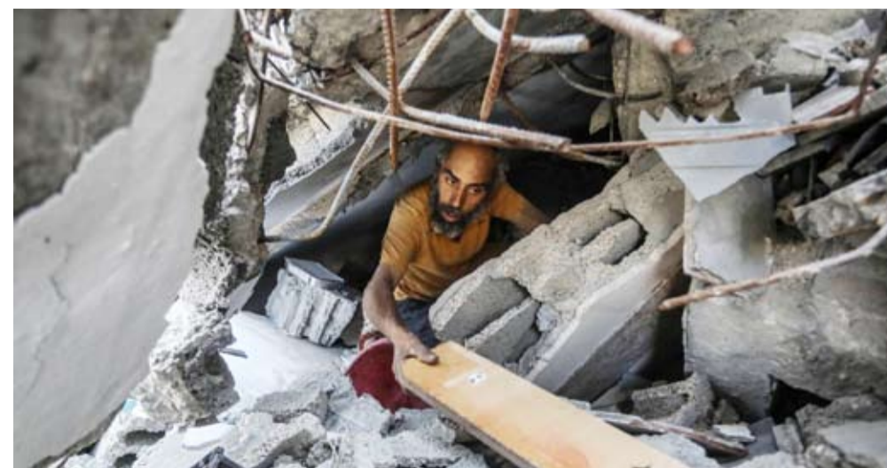
الكيان الصهيوني مسؤول عن الجازر في غزة