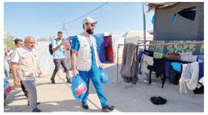
جانب من توزيع المساعدات الصحية والغذائية في غزة

وبجمعية دار اليتيم الفلسطيني، ويجري الوفد الطبي الكويتي الثاني عشرات العمليات الجراحية في مختلف التخصصات في مستشفيات جنوب غزة منذ وصوله يوم الثلاثاء الماضي عبر معبر رفح البري مع مصر لدعم صمود الشعب الفلسطيني ومساندة القطاع الصحي الفلسطيني. وهذا هو الفريق الطبي الكويتي الثاني بعد الفريق الطبي الأول الذي زار غزة مطلع إبريل الماضي لمدة أسبوع وأجرى عشرات العمليات الجراحية وقدم مساعدات طبية وإغاثية. ومنذ بدء عدوان الاحتلال الإسرائيلي على قطاع غزة وصلت وفود ومساعدات كويتية مختلفة عبر جسور مسانية للشعب الفلسطيني ومساندة القطاع الصحي الفلسطيني. وهذا هو الفريق الطبي الكويتي