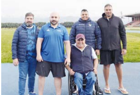
منتخب الكويت لالعاب القوى يبدأ معسكراً تدريبياً في تركيا