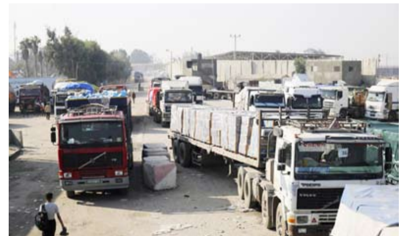
حماس أعلنت مسؤوليتها عن قصف قاعدة عسكرية لجيش الاحتلال في كرم أبو سالم

أصيب 10 أشخاص في قصف صاروخي شنته حركة حماس باتجاه منطقة كرم أبو سالم بغلاف قطاع غزة، بينما أعلنت الحكومة الإسرائيلية عن منع مرور المساعدات الإنسانية عبر المعبر، وأفاد جيش الاحتلال أن 10 صواريخ أطلقت تجاه منطقة كرم أبو سالم. وأشار إلى أن الصواريخ انطلقت من منطقة رفح، مؤكدا إصابة عدد من الأشخاص، بعضهم في حالة خطيرة. من جانبها أعلنت حركة حماس مسؤوليتها عن الهجوم، وقالت إنها استهدفت قاعدة لجيش الاحتلال الإسرائيلي.