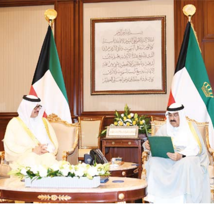
سمو أمير البلاد يتسلم من سفير خادم الحرمين الشريفين رسالة ولي العهد السعودي

سموه تسلم رسالة من ولي العهد السعودي تتضمن دعوة الكويت للانضمام إلى المنظمة العالمية للمياه