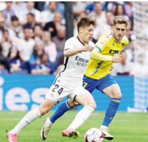
ريال مدريد يحسم اللقب

وقد يتوج الريال بلقب الدوري الإسباني الليلة حال تعثر برشلونة الذي يحل ضيفاً على قادش صاحب المركز الثالث برصيد 71 نقطة في