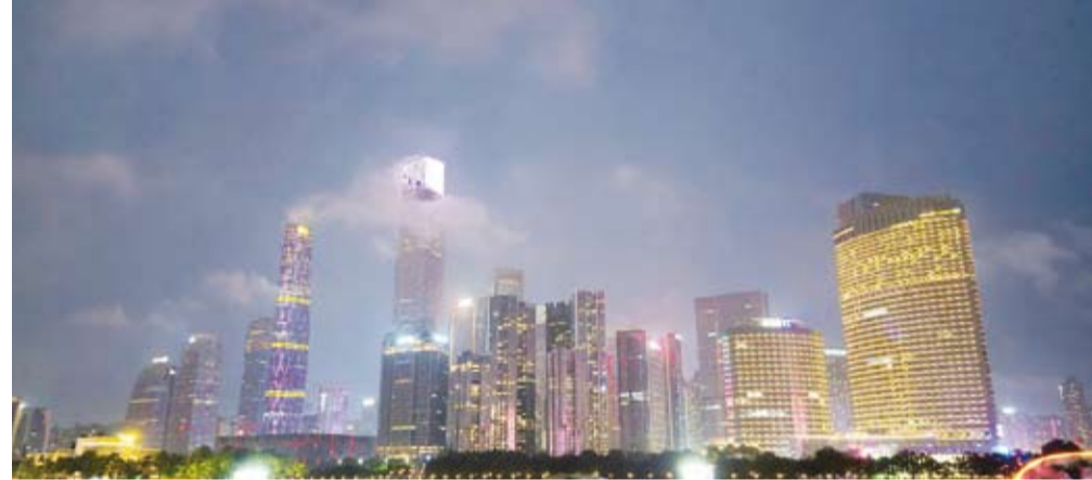
مدينة غوانغتشو.. تاريخ حافل وحضارة متنوعة

الصناعية والتجارية في الصين والعالم. ويرتبط الجانب الجمالي للمدينة من خلال معالمها التاريخية الرائعة والهندسة المعمارية الفريدة وحدائقها الخضراء الجميلة وبحيراتها وأنهارها الساحرة.