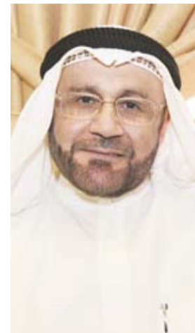
عبدالله بن باني

أعلنت بورصة الكويت في اجتماع مجلس إدارتها المنعقد بتاريخ 5 مايو 2024 عن نتائجها المالية للفترة المنتهية في 31 مارس 2024، حيث ارتفع صافي ربح الشركة بنسبة 8.63 بالمئة ليبلغ حوالي 4.68 مليون دينار كويتي في الربع الأول من العام 2024، وذلك مقارنة بمبلغ 4.31 مليون دينار كويتي في نفس الفترة للعام 2023. كما ارتفع صافي الربح التشغيلي بنسبة 9.81 بالمئة من 5.08 مليون دينار كويتي في الربع الأول من 2023 إلى 5.58 مليون دينار كويتي في الربع الأول من هذا العام.