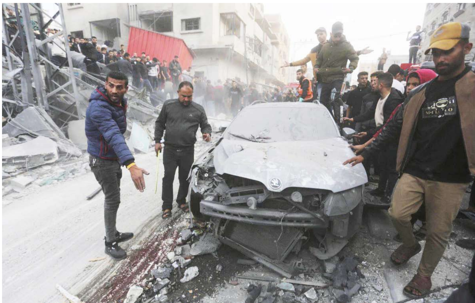
الغارات الصهيونية تسبب دمار هائل في رفح