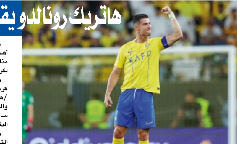
رونالدو يعبر عن سعادته بالهاتريك

الثاني عشر. واصل الشباب انتصاراته بفوز ثالث توالياً على ضيفه الرائد بهدفين دون تسجيلهما البرازيلي كارلوس جونور في الدقيقة (56)، والبلجيكي يانك كاراسكو في الدقيقة (81). وتقدم الشباب إلى المركز السادس برصيد (41) نقطة، فيما توقف رصيده الرائد عند (31) نقطة في المركز الثالث عشر. وفي مباراة ثالثة، تعادل الخليج مع ضيفه الطائي دون أهداف، ليرفع الأول رصيده إلى (36) نقطة في المركز الحادي عشر، فيما ارتفع رصيده الطائي إلى (27) نقطة في المركز السابع عشر قبل الأخير.