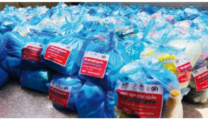
جانب من المساعدات الصحية والغذائية