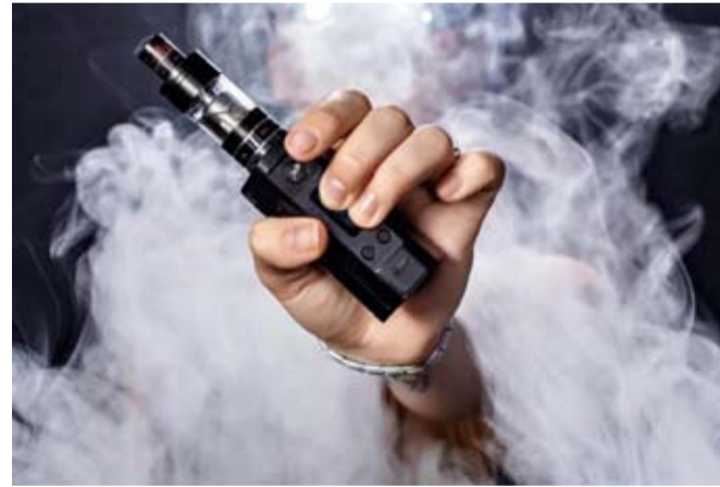
السجائر الإلكترونية قد تضر بنمو الدماغ

الطولة قد تشكل خطراً إضافياً للتعرض للبيورانيوم، وقد يزيد استخدام السجائر الإلكترونية خلال فترة المراهقة من احتمال التعرض للمعادن، ما قد يؤثر سلباً على نمو الدماغ والأعضاء.