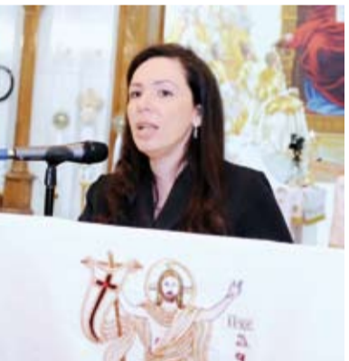
نائب السفير المصري نورة عبد الهادي

احتفلت كنيسة مارمرقس المصرية في دولة الكويت بعيد القيامة المجيد، مساء أمس الأول، وحضر القداس عدد كبير من الدبلوماسيين والشخصيات العامة وأبناء مصر الأقباط المقيمين في دولة الكويت، حيث تلت نائب السفير المصري في دولة الكويت، السفيرة نورة عبد الهادي، بمرقية الرئيس المصري عبد الفتاح السيسي لتهنئة الأقباط الأثوذكس المصريين المقيمين في دولة الكويت بمناسبة عيد القيامة المجيد.