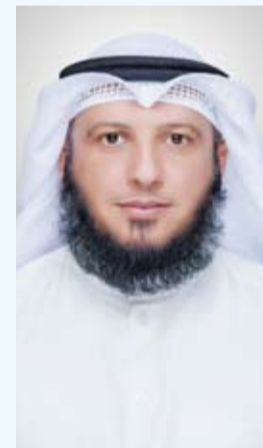
نواف عبيد العازمي

قال النائب نواف عبيد العازمي إن «عدم التوافق بين وزارتي الصحة والتعليم العالي» يشككنا بقدره الحكومة على إنجاز ملفات كثيرة في تقدم الكويت». وأضاف أن «وزارة التعليم العالي هي المسؤولة عن اعتماد تخرج طلبة الطب، ووزارة الصحة هي المسؤولة عن توظيفهم ومنحهم سنة الامتياز، وهذه الأمور تحدث في ظل نقص الكوادر الطبية».