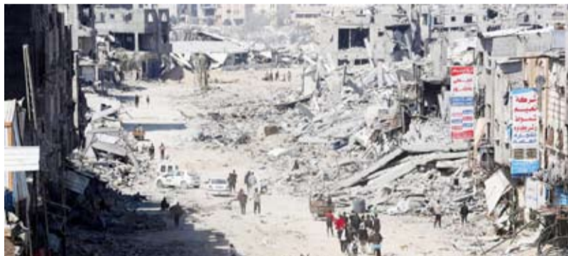
نزوح عائلات كثيرة إلى رفح

إلى ذلك، أكد مسؤول كبير في حركة «حماس» مساء السبت أن الحركة «لن توافق بأي حال من الأحوال» على اتفاق هدنة في غزة لا يتضمن