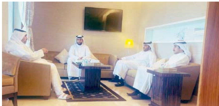
محمد جوهر حيا مع بعض الخريجين

قال النائب محمد جوهر حيا: بعد تواصل مباشر مع أبنائنا المتقدمين لاختبار النفط تخصص هندسة كيميائية بمؤسسة البترول، وأوضح بأن هناك إجراءات معقدة وغير واضحة من قبل المسؤولين، وأصبح على الوزير والمختص الإخوة قيادات المؤسسة والمشرفين على الاختبارات إيضاح الأمر بكل شفافية ووضوح، وعليهم أنصاف كل صاحب حق!