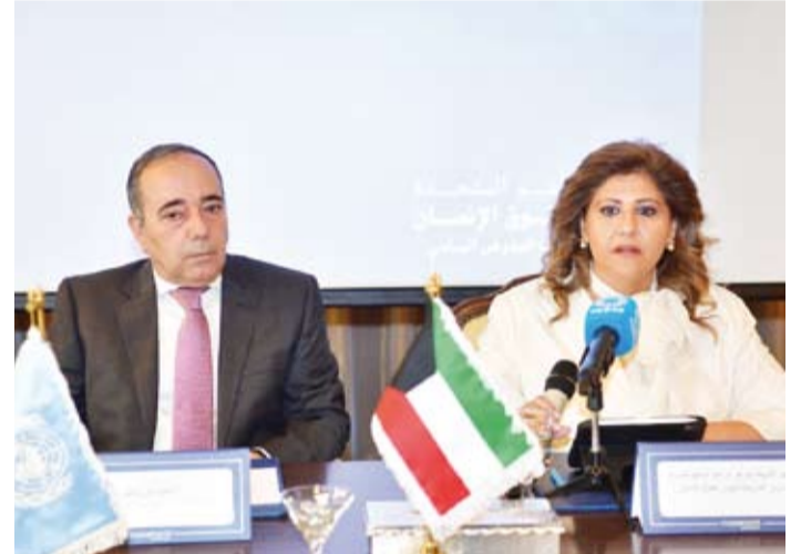
الشيخة جواهر الصباح متحدثة خلال ورشة العمل

الدورية في مواعيدها المحددة دون تأخير إيماناً منها بأهمية احترام التزاماتها الدولية وتعزيز التعاون الدولي في مجال حقوق الإنسان. وذكرت أن الورشة تهدف إلى تمكين أعضاء الوفد الكويتي المكلف بمناقشة تقرير دولة الكويت الدوري السادس أمام لجنة (سيداو) في مايو 2024 من تقديم عرض شامل وواضح حول التقدم الذي أحرزته الكويت في مجال حقوق المرأة وتعزيز قدرتهم على الرد على أسئلة أعضاء لجنة (سيداو) بمهارة وكفاءة عالية. وبينت (الخارجية) أن دولة الكويت