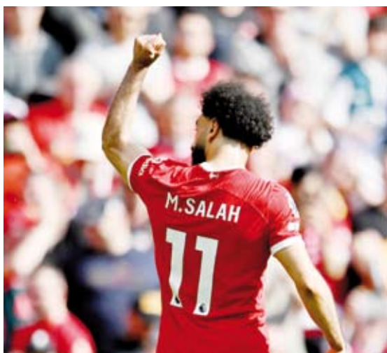
محمد صلاح فريق قاد ليفربول إلى تحقيق الفوز

فاز فريق ليفربول على توتنهام 2-4 في المباراة التي جمعت بينهما ضمن الجولة السادسة والثلاثين من الدوري الإنجليزي الممتاز لكرة القدم، والتي شهدت أيضا فوزا كبيرا لتشييلسي على وست هام بنتيجة 5- صفر، وكذلك خسارة أستون فيلا أمام برايتون بهدف دون مقابل، ففي المباراة الأولى، قاد محمد صلاح فريق ليفربول إلى تحقيق الفوز، بتسجيله هدفا ومساهمته في اثنين، حيث نجح صلاح في افتتاح التسجيل بكرة رأسية إثر تمريرة عرضية من كودي خاكيو في الدقيقة (16).