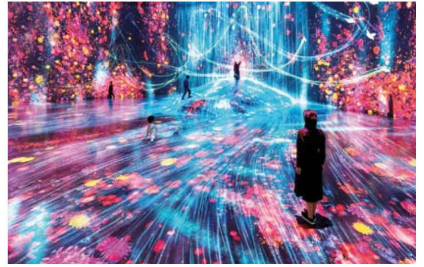
«عالم بلا حدود»

بالرغبة، ويستكشفون ذلك العالم مع الآخرين. وتمثل غابة الألعاب الرياضية في المتحف فضاء إبداعياً يتم من خلاله اكتساب القدرة على الإدراك المكاني عبر تعزيز نمو الحصين في الدماغ، وتستند على مبدأ فهم العالم عن طريق الجسد والتفكير فيه على نحو ثلاثي الأبعاد، في فضاء ثلاثي الأبعاد معقد وبنطوي على تحديات بدينية تدعو إلى الانغماس في عالم تفاعلي، أما مدينة ألعاب المستقبل فتعد مشروعاً تعليمياً تجريبياً يعتمد على مفهوم الإبداع التعاوني (الإبداع المشترك)، وهي مدينة مسلية تتيح للناس الاستمتاع ببناء العالم بحرية مع الآخرين.