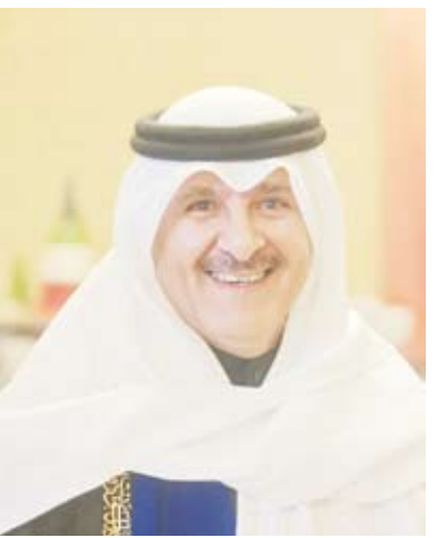
سفير الكويت لدى تركيا وائل العزري

أكد سفير دولة الكويت لدى تركيا، وائل العزري، أن زيارة دولة التي يقوم بها سمو أمير البلاد الشيخ مشعل الأحمد، إلى تركيا، اليوم، تاريخية بكل المقاييس بالتوقيت والمضمون وتكمل مسيرة ستة عقود من الشراكة الاستراتيجية متعددة الأبعاد بينها. وقال السفير العزري لـ (كونا) أمس: إن زيارة سمو أمير البلاد من شأنها أيضاً تعزيز التعاون الثنائي الوثيق بين البلدين الصديقين سياسياً واقتصادياً وتجارياً واستثمارياً ودفاعياً وأمنياً خدمة لمصالحهما المشتركة.