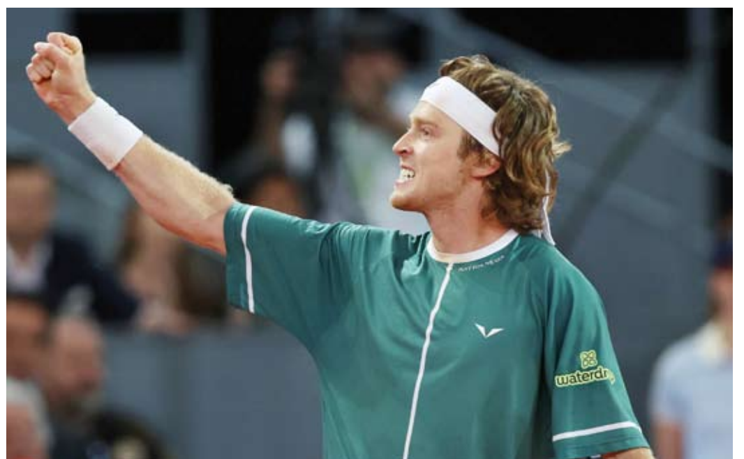
الروسي أندري روبليف

توج الروسي أندري روبليف، المصنف الثامن عالميا، بلقب بطولة مدريد للتنس ذات الألف نقطة بعد تغلبه على الكندي فيليكس أوجيه الياسيم بمجموعتين لواحدة. وجاءت نتيجة المباراة النهائية التي جمعت بين روبليف والياسيم مواقع (4-6) و(7-5) و(5-7). وبدأ أوجيه الياسيم المباراة بقوة وكسر إرسال منافسه في الشوط الأول ثم تقدم (4-1)، قبل أن يستعيد روبليف توازنه ويسدرك التعادل (4-4)، لكن الكلمة الأخيرة في المجموعة الأولى كانت للياسيم، وظل التعادل قائما بين اللاعبين في المجموعة الثانية حتى الشوط الثاني عشر الذي فاز به روبليف كاسرا لإرسال منافسه ومعادلا النتيجة. وتكرر السيناريو في المجموعة الحاسمة، حيث سيطر التعادل على المواجهة حتى الشوط الثاني عشر الذي حسمه روبليف لصالحه.