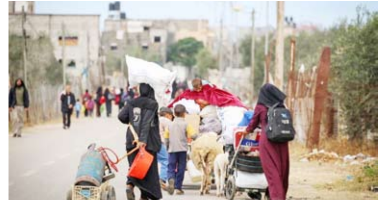
جيش الاحتلال يُخلي رفح تحضيراً لهجوم بري

وافق مجلس وزراء الاحتلال الإسرائيلي أمس بالإجماع على شن هجوم على مدينة رفح جنوب قطاع غزة، حيث من المتوقع بدء العملية في غضون أيام، وشن الطيران الحربي الإسرائيلي سلسلة غارات على مناطق متفرقة من رفح، كما نفذ أحرمة نارية في محيط مطار غزة وشرق رفح. كما أمر جيش الاحتلال عشرات الإلاف من سكان رفح بالبدء في إخلاء المدينة. وأفسدت رويترز، أن مصر رفعت مستوى الاستعداد العسكري في منطقة شمال سيناء المتاخمة لقطاع غزة.