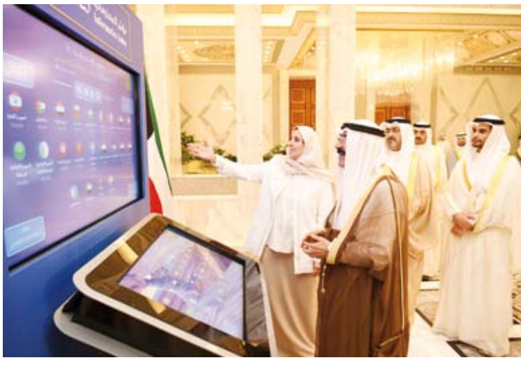
استعراض لأهم مجالات جائزة سمو الشيخ سالم العلي للمعلوماتية

وأضاف أن الشركة التي أنشئت في الكويت توسعت لتتواجد في سبع دول وحائزة عدة جوائز على مستوى الشرق الأوسط ومصنفة ضمن أفضل الشركات التقنية المالية وفقاً لـ (فوربس).