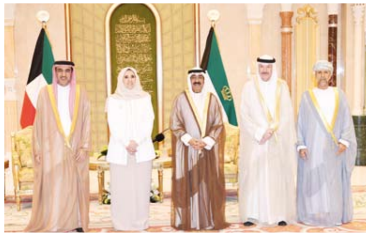
لقطة جماعية مع سمو أمير البلاد