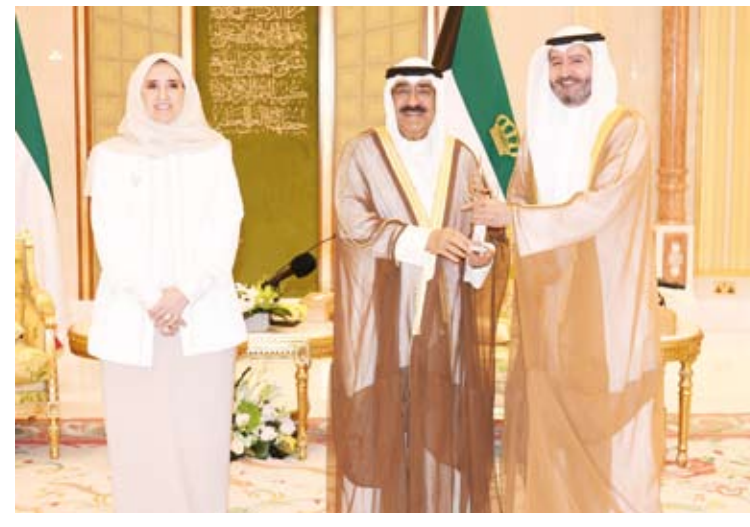
سمو الأمير يسلم جائزة إلى رئيس مجلس إدارة بيت التمويل الكويتي «بيتك»