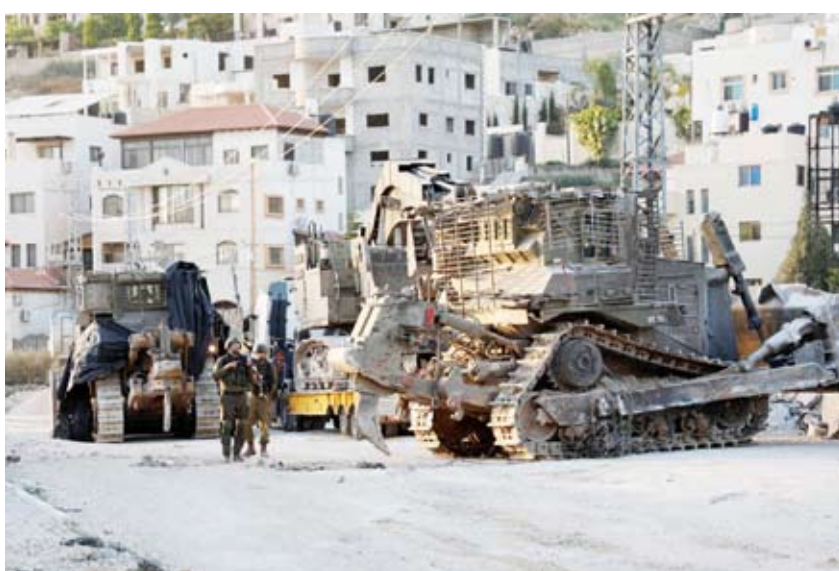
الليات جيش الاحتلال تقتحم طولكرم

إلى المنطقة الإنسانية التي تشمل مستشفيات ميدانية وخياماً وكميات متزايدة من الغذاء والمياه والأدوية وغيرها من الإمدادات». وبحسب الهيئة، فإن أي خطة لعمل واسع النطاق في المدينة لتدمير كتيبة «حماس» تتضمن إخلاء واسع النطاق وطويل الأمد للمدنيين، لكن في هذه المرحلة بحسب قرار مجلس الحرب فسيكون هناك إخلاء مؤقت ومحدود لنحو 100 ألف شخص تمهيداً للنشاط في المدينة.