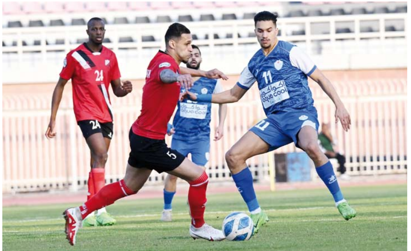
مباراة مثيرة بين خيطان والشباب