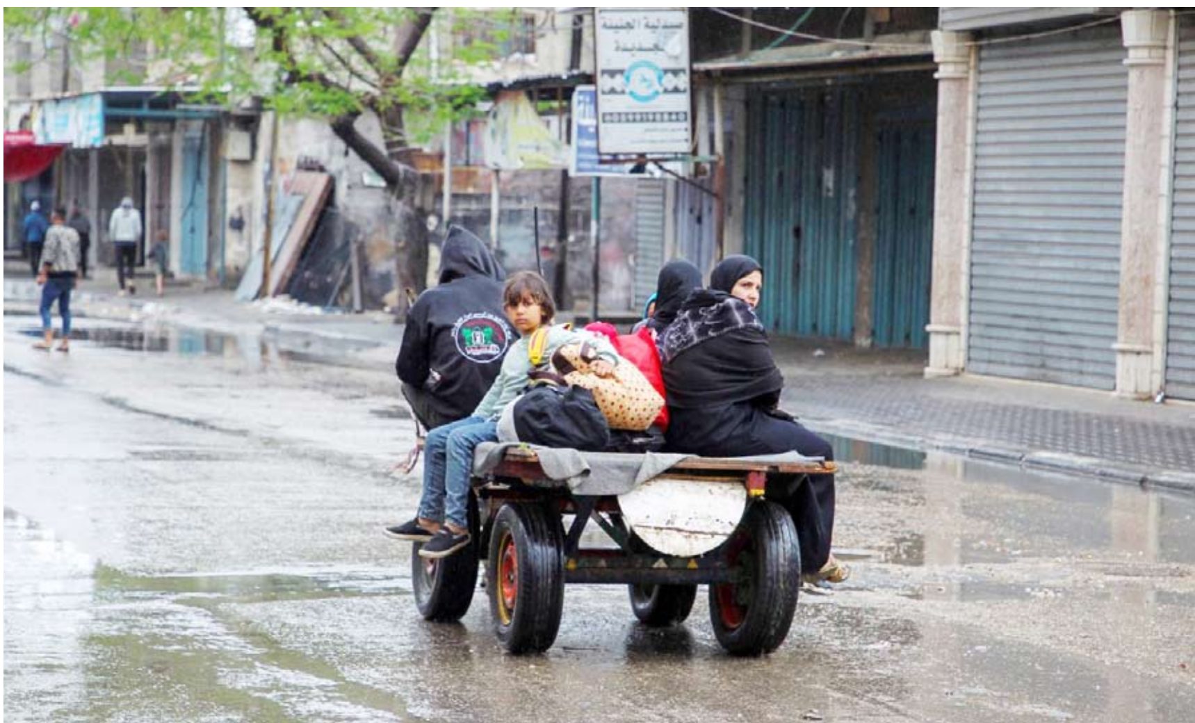
فلسطينيون يغفرون من الأجزاء الشرقية من رفح