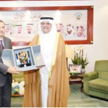
محافظ «الأحمدي» يقدم درعاً لسفير الهند

وأضاف السابر في تصريح صحفي لـ (كونا) على هامش الاجتماع التحضيري للمؤتمر الدولي الـ 34 لحركة الصليب الأحمر والهلال الأحمر الذي يعقد أعماله على مدى يومين في جنيف التزام دولة الكويت بتعزيز المبادئ الإنسانية ومواجهة التحديات العالمية.