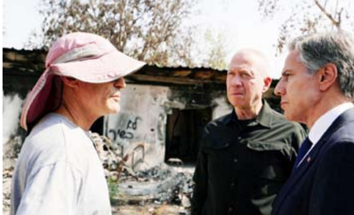
غلانت مع بليكين خلال زيارة غلاف غزة

نقل موقع «واي نت»، الإسرائيلي عن وزير الدفاع يوآف غالانت قوله، خلال الاجتماع الأسبوعي لمجلس الوزراء أن الهجوم على رفح الفلسطينية سوف يبدأ قريباً.