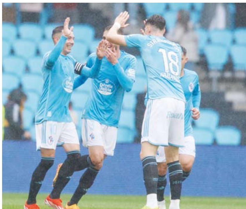
لاعب سيلتا فيجو يحتفلون بالتسجيل

بعشرة لاعبين بعد طرد لاعبه جون مونكايولا في الدقيقة (26). وبهذا الفوز، رفع ريال بيتيس رصيده إلى 52 نقطة في المركز السابع، بينما تجمد رصيده أوساسونا عند 39 نقطة في المركز الثالث عشر. من ناحية أخرى، تخطى إشبيلية عقبة غرناطة بثلاثية نظيفة، سجلها ماركوس أكونيا في الدقيقة (11) ويوسف النصيري في الدقيقة (51) ودودي لو كيباكيو في الدقيقة (80)، ورفع إشبيلية رصيده إلى 41 نقطة في المركز الثاني عشر، فيما بقي غرناطة عند 21 نقطة في المركز التاسع عشر قبل الأخير. وفي لقاء آخر، حقق فريق المرييا، الهابط إلى دوري الدرجة الثانية، المفاجأة بالفوز خارج أرضه على رايو فالكانو بهدف سجله أنتونيو لوزانو في الدقيقة (30).