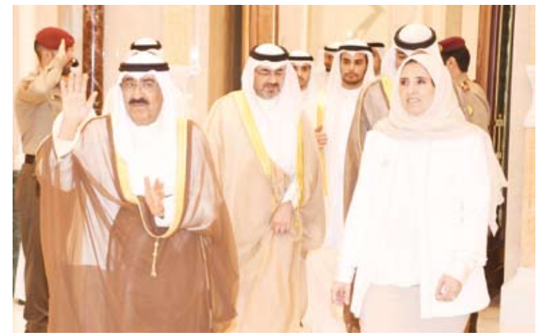
سمو أمير البلاد يحيي الحضور وبمعيته الشقيقة عايدة سالم العلي

المجال الرقمي. وأعرب البرواني عن اعتزانه وفخره بتكريمه من صاحب السمو أمير البلاد الشيخ مشعل الأحمد مع الفائزين بالجائزة اليوم. من جهته قال ممثل بيت التمويل الكويتي (بيتك) رئيس مجلس الإدارة حمد المرزوق، الحاصل على جائزة التحول الرقمي بالحلول المالية التقنية في تصريح لـ (كونا): إن هذه الجائزة تشكل حافزاً لتحقيق المزيد من الإنجازات في مجال الذكاء الاصطناعي ومجال الروبوتس لتقديم أفضل الخدمات المالية للعملاء سواء على مستوى الشركات أو الأفراد. وتقدم المرزوق بخالص شكره لسمو أمير البلاد الشيخ مشعل الأحمد على رعايته السامية لهذا الحدث، معرباً عن اعتزانه وفخره بهذا التكريم.