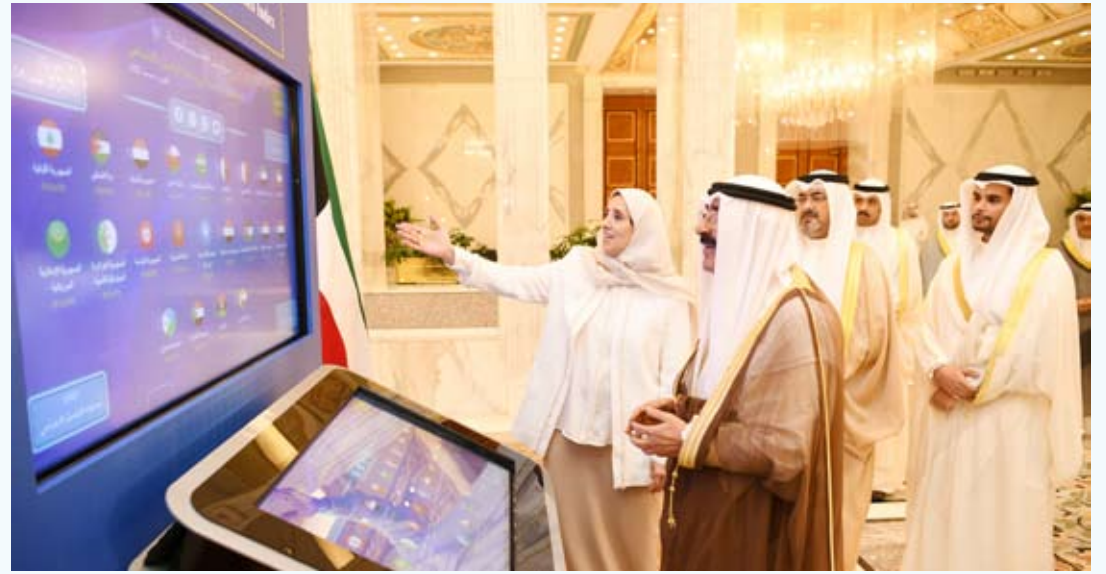
سمو الأمير يبدن النسخة الجديدة من مشروع مؤشر المعلوماتية

تحت رعاية وحضور سمو أمير البلاد الشيخ مشعل الأحمد أقيم صباح أمس حفل جائزة سمو الشيخ سالم العلي الصباح للمعلوماتية في الدورة الثالثة والعشرين (2023) وذلك بقصر بيان، وتفضل سمو الأمير بتدشين النسخة الجديدة من مشروع مؤشر المعلوماتية. وفي ختام الحفل تفضل سمو الأمير بتكريم الفائزين بجائزة