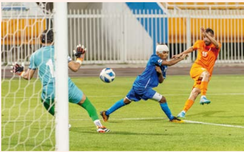
مباراة حقلت بالأهداف