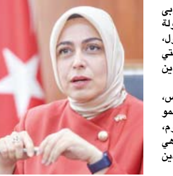
السفيرة التركية طوبى نور سونمز

وأكدت السفيرة سونمز، أن الكويتيين لديهم اهتمام في مجال السياحة بتركيا والكويت إحدى أكثر الدول للاحية عدد السياح إلى تركيا مقارنة بعدد سكانها فيما تعتبر تركيا الوجهة السياحية الأكثر شعبية لدى الكويتيين. وذكرت أن السياح الكويتيين واعون جداً ولديهم نهج سياحي حيث يحبون استكشاف الأماكن الجديدة ويمضون وقتهم بكفاءة ويقومون بعلاقات ممتازة مع السكان المحليين. ولقّبت إلى "أنتنا العام الماضي استضفنا ما يقرب من 400 ألف ضيف كويتي وتنمى أن يزيد هذا العدد وفي المقابل ندعو المواطنين الأترك لزيارة الكويت واكتشاف جمالها".