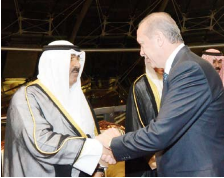
سمو أمير البلاد الشيخ مشعل الأحمد والرئيس التركي رجب طيب أردوغان في لقاء سابق