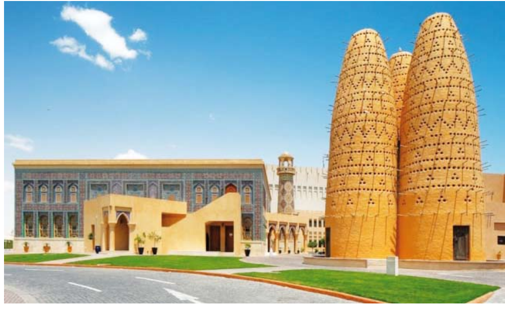
الحي الثقافي «كتارا»

لجمع الدول حول العالم، اعتباراً من أول رمضان المنصرم، وأغلق باب المشاركات في الثلاثين من الشهر الفضيل. وتهدف جائزة كتارا للشعر العربي «أمهات المؤمنین» إلى تعزيز مكانة بيت النبوة، ولا سيما أمهات المؤمنین «رضي الله عنهن» في ذاكرة الأجيال القادمة، بالإضافة إلى تقديم مدونة شعرية حديثة حول أمهات المؤمنین ومناقبتهم وتاريخهن، كما تهدف الجائزة إلى بيان أثر أمهات المؤمنین في مسار الدعوة، وتكوين شخصية المرأة في المجتمع، إلى جانب ربط سيرة هؤلاء الأمهات بالشعر والفن، من خلال نصوص درامية فنية، كما تحث الشعراء على توظيف السرد الشعري في مدح أمهات المؤمنین. ووضعت الجائزة عدداً من الشروط، من بينها، ألا تقل القصيدة عن 30 بيتاً إذا كانت عمودية خليلية، وتقبل قصيدة التفعيلة شريطة الالتزام بنظام عروضي محدد، ومن الشروط أيضاً أن تظهر