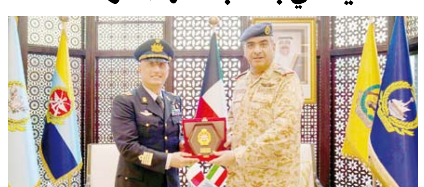
الفريق الركن طيار بندر المزين يقدم درعاً للعقيد سالفاتوري فيرا

استقبل رئيس الأركان العامة للجيش، الفريق الركن طيار بندر المزين، بمكتبه، صباح أمس، الملحق العسكري الإيطالي لدى البلاد العقيد سالفاتوري فيرا بمناسبة انتهاء فترة عمله.