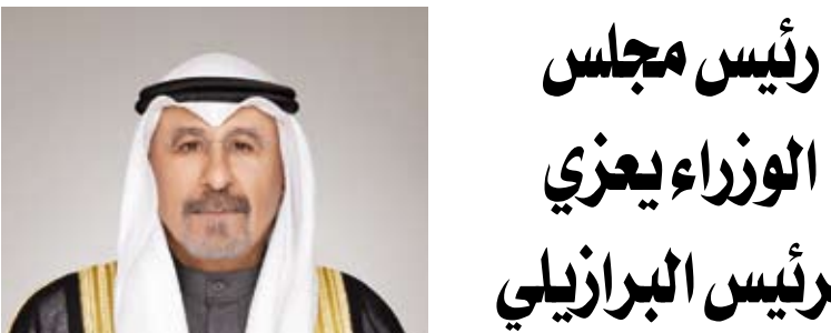
سمو الشيخ الدكتور محمد الصباح غراندي دو سول) جنوبي البرازيل.

أكدت السفيرة التركية لدى البلاد، طوبى نور سونمز، أن العلاقات بين بلادها ودولة الكويت نموذج مثالي للعلاقات بين الدول، لافتة إلى مثانة وتجذر أوامر الأخوة التي ترعاها القيادتان السياسيتان في البلدين والشعبين الصديقين. وقالت السفيرة سونمز لـ (كونا) أمس، بمناسبة زيارة دولة التي يقوم بها سمو أمير البلاد الشيخ مشعل الأحمد، اليوم، إلى تركيا: إن القيم والمصالح المشتركة هي أساس العلاقات الودية التي تجمع البلدين والشعبين الصديقين. ولقّبت إلى أن البلدين يحتفلان خلال هذا العام بالذكرى الـ 60 لإقامة العلاقات الدبلوماسية مؤكدة أن هناك إرادة سياسية قوية على المستوى القيادي للوصول إلى أعلى درجات التعاون والتكامل في مختلف المجالات. وأوضحت أن هناك آليات تعاون متعددة الأبعاد بين بلادها ودولة الكويت على أساس ثنائي في العديد من المجالات "من التجارة إلى الصناعة الدفاعية ومن السياحة إلى الاستثمار".