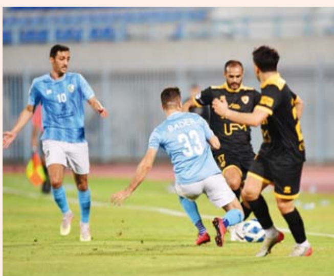
تعادل مخيب للاصفر

أبعد السالمية ضيفه القادسية عن سباق الدوري الكويتي الممتاز، بتعادل سلبي، على استاد نام، في ختام منافسات الجولة السادسة لمجموعة البطولة. ورفع القادسية رصيده إلى 50 نقطة، في المركز الثالث بفارق 7 نقاط كاملة عن الكويت المتصدر، ما يزيد موقفة صعبة في سباقه نحو حصد اللقب، فيما عزز السالمية موقعه في المركز الرابع برصيد 32 نقطة.