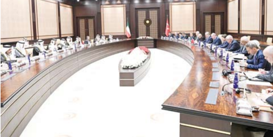
جانب من جلسة المباحثات الرسمية

الإقليمي، مشدداً على أن الاتصالات بين البلدين ستستمر بشكل وثيق على كافة المستويات، معرباً في الوقت نفسه عن تقديره للجهود الحميدة لدولة الكويت ودورها الإنساني الريادي على الصعيدين الإقليمي والدولي ومواقفها وسياساتها المتزنة الهادفة إلى تحقيق الأزدهار للشعب وتقريب وجهات النظر. ويشان التطورات في المنطقة أعرب البلدان عن القلق حيال الأوضاع في قطاع غزة والأراضي الفلسطينية المحتلة والجرائم التي ترتكب بحق الأشقاء الفلسطينيين والوضع الإنساني الكارثي هناك وما تواجه مدينة رفح جنوبي قطاع غزة من تهديد خطير سيؤدي إلى تهجير قسري للسكان نحو المجهول، مؤكداً على أهمية اضطلاع المجتمع الدولي وخاصة مجلس الأمن بمسؤولياتهم تجاه تنفيذ قرارات الوقف الفوري لإطلاق النار وحماية المدنيين وضمان وصول المساعدات الإنسانية وإيجاد حل لهذه القضية وفق قرارات الشرعية الدولية. وقد الرئيس رجب طيب أردوغان بمناسبة الزيارة صاحب السمو أمير دولة الكويت الشيخ مشعل الأحمد، وسام الدولة التركية الوسام الأرفع بالجمهورية تقديراً لدور سموه الكبير في الدفع بالعلاقات الثنائية. وفي ختام الزيارة، أعرب صاحب السمو أمير دولة الكويت عن شكره وتقديره لفخامة رئيس الجمهورية التركية على ما لقيه سموه والوفد المرافق من حسن الاستقبال وكرم الضيافة، موجهاً سموه الدعوة للرئيس لزيارة دولة الكويت، معرباً عن أصدق تمنياته لفخامة رئيس الجمهورية التركية وللشعب التركي الصديق.