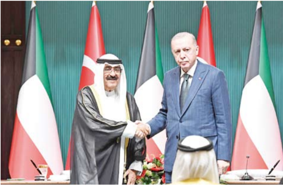
سمو أمير البلاد يشهد توقيع عدد من الاتفاقيات بحضور الرئيس التركي