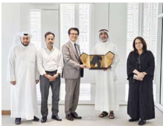
تكريم الخبير الزائر

كما قدم العديد من الاقتراحات من أبرزها تقديم برامج الدكتوراه مما يساهم في فتح باب التعاون والتبادل الطلابي على مستوى عالمي وركز على أهمية الجانب البحثي وأكد على أهمية مجال الصحة العامة عالمياً والذي سيساهم في توفير فرص عمل داخل وخارج الكويت.