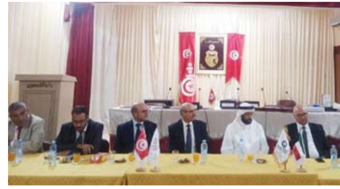
الشهاب أثناء توقيع بروتوكول التعاون مع المؤسسات التونسية

المستفيدة. مضيفاً: كما ننفذ مشروع «تربية الأغنام»، ومشروع «الكسب الحلال للسيدات»، وهذه المشاريع التنموية