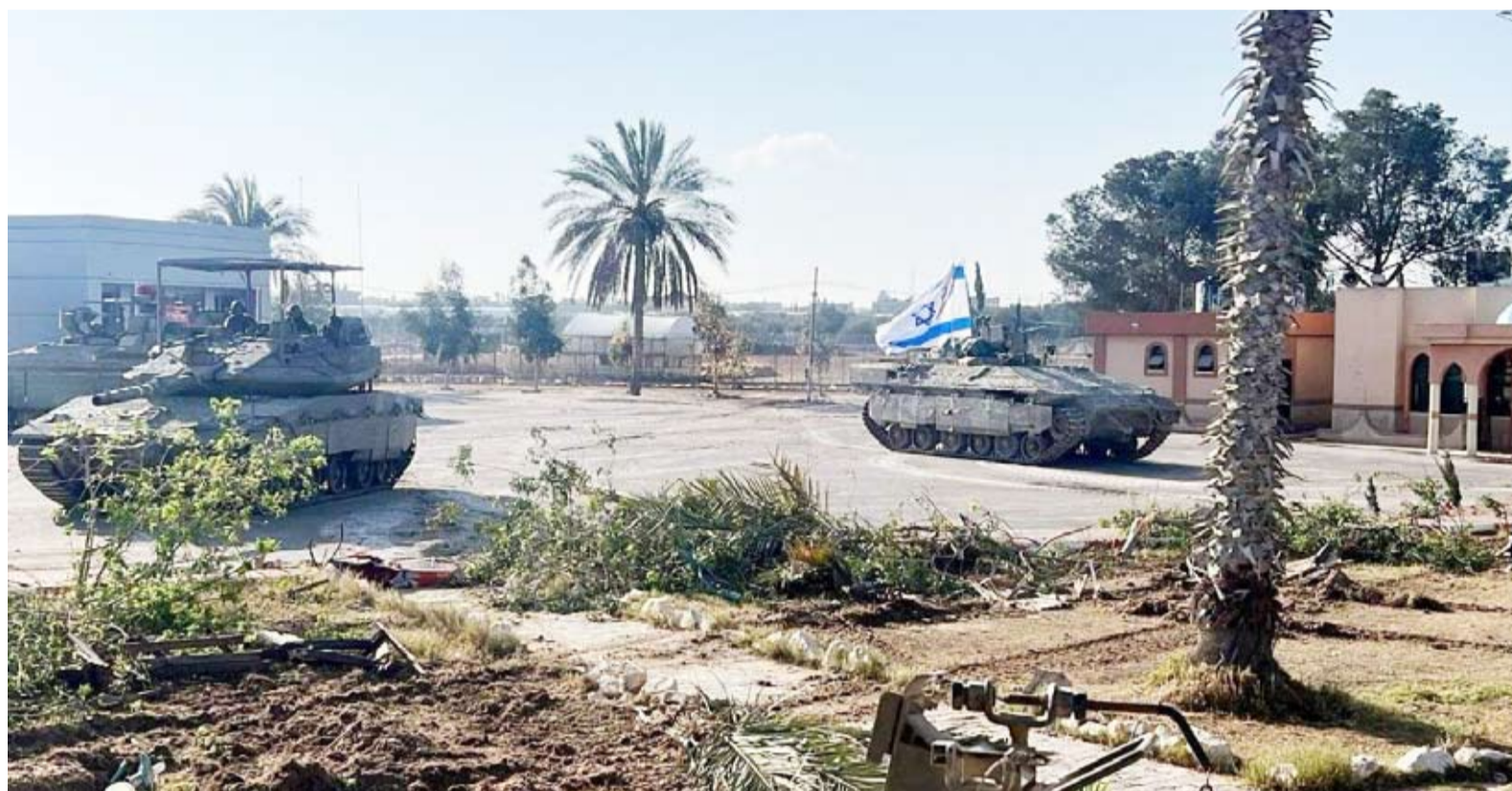
آليات صهيونية تسيطر على معبر رفح

أشهر. وتقول إسرائيل إنه من دون اجتياح المدينة والقضاء على هذا اللواء، لا يمكن إنهاء الحرب؛ لأنه لا يمكن تحقيق «النصر». وبيّنا طالب الناطق باسم الرئاسة الفلسطينية، نبيل أبو ردينة، الإدارة الأميركية بالتدخل الفوري، محذراً من أن إسرائيل تدفع بالأمر إلى حافة الهاوية، قالت «حماس» إن الهجوم على رفح «يؤكد نية الاحتلال تعطيل جهود الوساطة لوقف إطلاق النار وإطلاق سراح الأسرى».