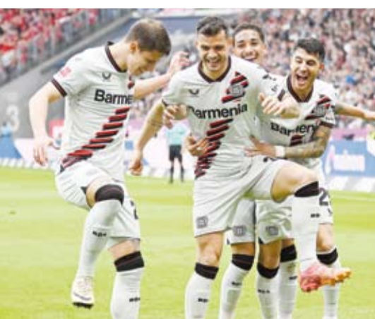
طموح لاعبي ليفركوزن لا يتوقف بعد حصد لقب الدوري الألماني

22 مباراة منذ توليه مسؤولية تدريب الفريق خلفا للبرتغالي جوزيه مورينيو. وفي مباراة ثانية في إياب الدور قبل النهائي، يستضيف أتلانتا الإيطالي نظيره مارسيليا الفرنسي على ملعب جيويس، في مواجهة قوية يحاول من خلالها فريق أتلانتا الاستفادة من عاملي الأرض والجمهور، ويعول على تعادله ذهابا بهدف للثلة. ويهدف أتلانتا للتعادل النهائي بطولة الدوري الأوروبي للمرة الأولى في تاريخه، لتتاح له فرصة الفوز بلقبين هذا الموسم، حيث سيواجه يوفنتوس في وقت لاحق من هذا الشهر في نهائي كأس إيطاليا، بينما يرغب مارسيليا في العودة لنهائي البطولة، الذي وصل إليه في موسم (2017-2018)، عندما خسر أمام أتلتيكو مدريد بثلاثة نظيفة.