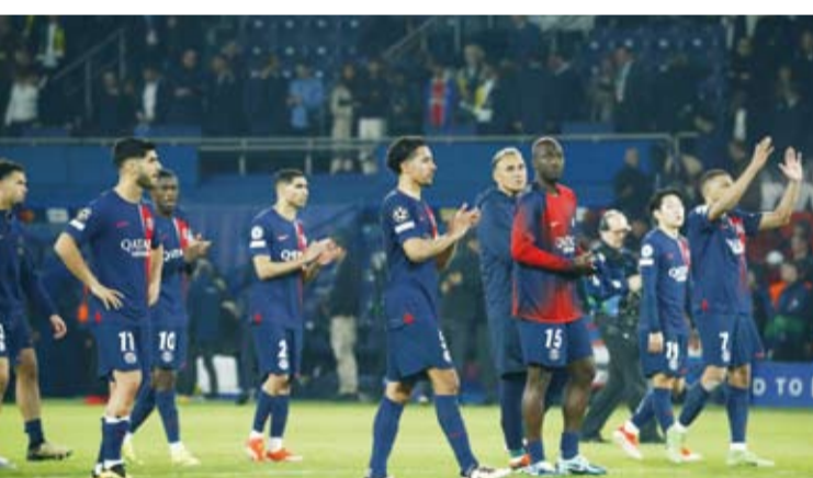
مباراة فشل في قيادة باريس للمباراة النهائية

وضيفه بايرن ميونخ الألماني المقررة غدا / الأربعاء / على ملعب سانتياجو برنابيو في مدريد في مباراة الإياب الثاني للدور نصف النهائي، علما بأن مباراة الذهاب في ميونخ انتهت بالتعادل الإيجابي (2-2).