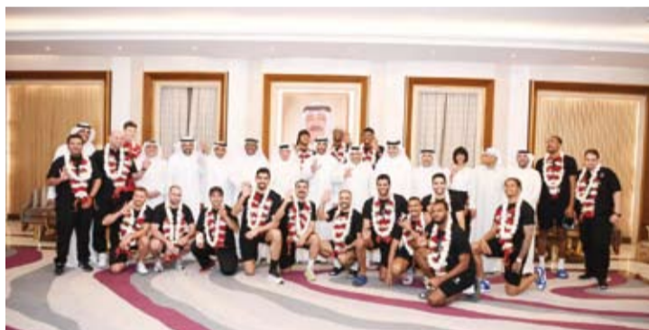
استقبال حافل لسلة الكويت