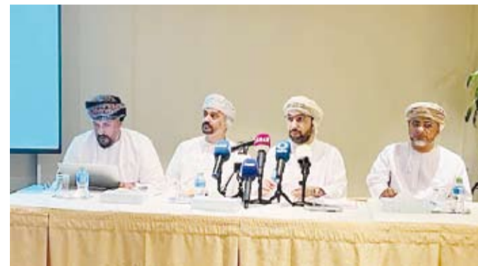
جانب من المؤتمر الصحفي

عدد الرحلات الجوية بين مطاري الكويت وصلالة والكويت وسقط". وزير التراث والسياحة العمانية عن الوسائل والبرامج الترويجية لوضع سلطة عمان ضمن خريطة العالم السياحية من خلال تنفيذ الحملات