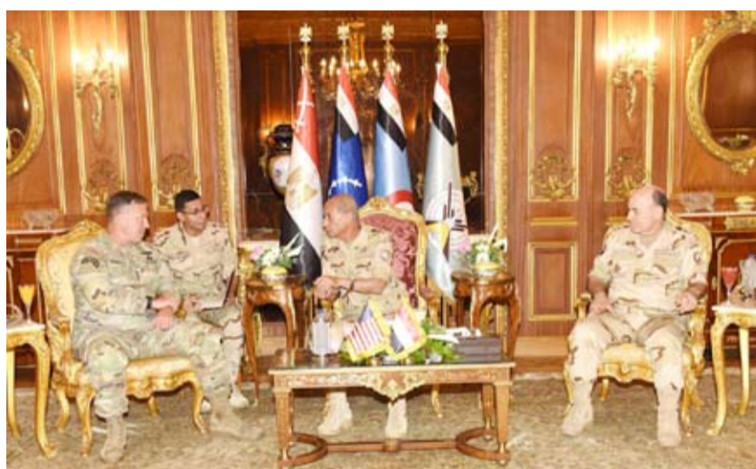
وزير الدفاع المصري مع قائد القيادة المركزية الأميركية

وتابع: «لن تستطيع المستشفيات الميدانية القليلة أو المنشآت البديلة التي تُقام أن تتعامل مع تدفق الجرحى، علاوة على الاحتياجات الطبية المعقدة مثل الولادات والأمراض المزمنة. ستزداد الاحتياجات الصحية بشكل مهول، بينما ستختسر إمكانية الحصول على الرعاية الصحية». وعُدّت غودار أن الظروف المعيشية في جميع أنحاء غزة متردية جداً أساساً.