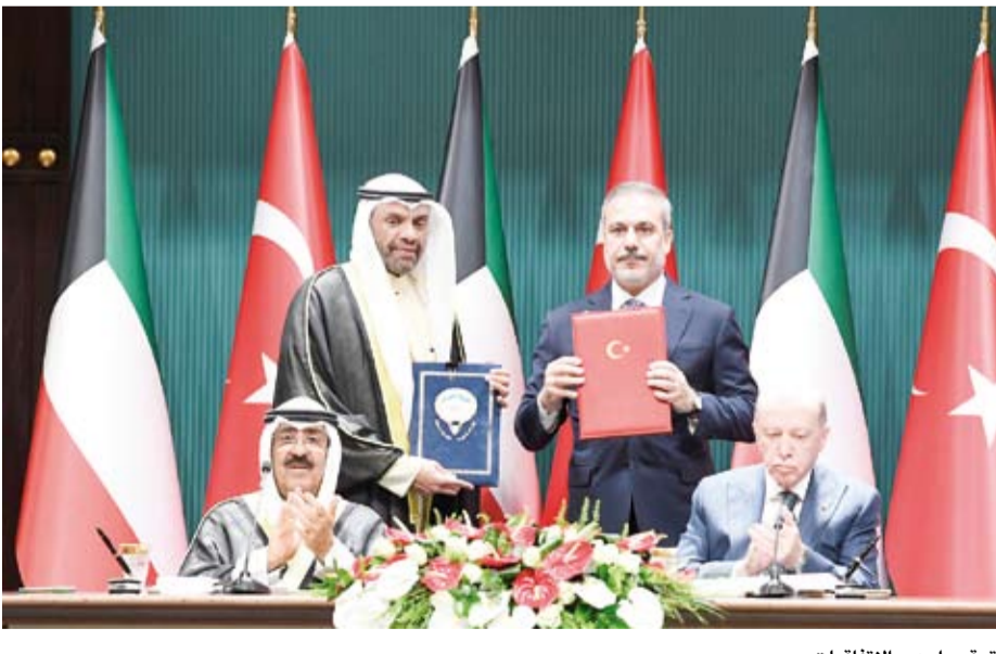
توقيع إحدى الاتفاقيات