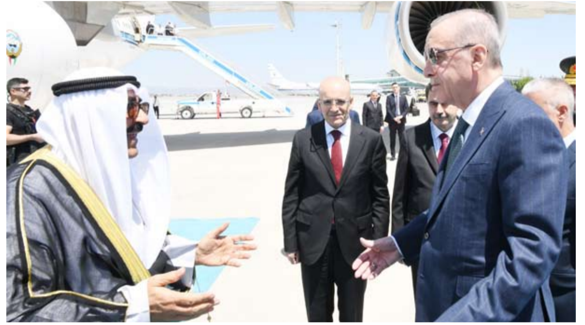
سمو الأمير والرئيس التركي أكدا الحرص المتبادل على تعزيز العلاقات الثنائية والشراكة في كافة المجالات

الدعوة النيابية لعقد اجتماع موسع، يشارك فيه رئيس الوزراء المكلف وفريقه، وأعضاء مجلس الأمة، لحسم الخلاف حول الوزير المحلل، بادرة جيدة لتجاوز المعضلة الدستورية الحالية، يجب العمل عليها، لاستيضاح المطالب النيابية والتوافق مكرراً بين المجلسين تقادياً للتنازيم والصدام المتكرر خلال السنوات الماضية، والعمل على الخروج من ذلك النفق، انطلاقاً نحو ديمقراطية حقيقية تعود بالنفع على المجتمع الكويتي. لا شك أن الحوار والجلوس على طاولة المفاوضات له مردود إيجابي كبير على كافة الأطراف، وعلى الحياة السياسية بوجه عام .. أخلصوا النوايا