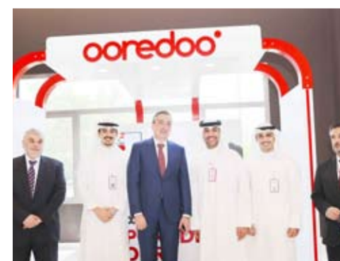
الشركة ترعى معرض AUM

أعلنت Ooredoo الكويت مؤخراً عن رعايتها لمعرض الفرص الوظيفية السنوي للعام 2024 الذي تقيمه جامعة الشرق الأوسط الأمريكية (AUM)، في مبادرة جاءت ضمن شراكة طويلة الأمد بين الطرفين، لسد الفجوة بين المراحل التعليمية والمسارات المهنية في الكويت. ومع وجود أكثر من 11.500 طالباً، وأكثر من 15.000 خريج، تشيد Ooredoo بهذه المؤسسة المرموقة للتعليم العالي كإحدى منارات التميز الأكاديمي في الكويت، إذ تقوم AUM كل ستة بأقامة هذا المعرض الوظيفي الناجح، والذي يجذب أكثر من 60 شركة محلية ودولية مرموقة.