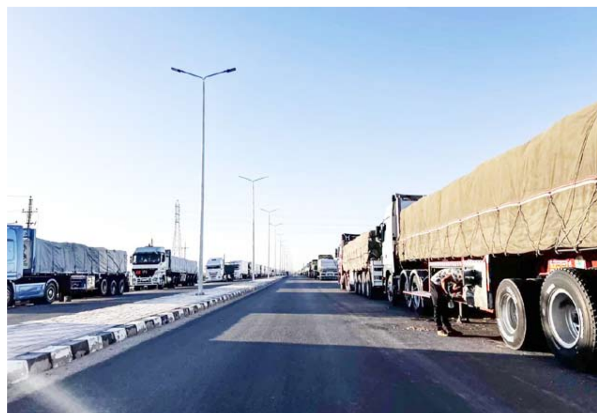
شاحنات تحمل مساعدات إنسانية إلى غزة

قالت لجنة المتابعة للقوى الوطنية والإسلامية الفلسطينية، إنها ترفض «أي شكل من أشكال الوصاية» على معبر رفح في جنوب قطاع غزة. وذكرت اللجنة، التي تضم عدداً من الفصائل الفلسطينية، ومنها حركة «حماس»، في بيان، أنها «لن تقبل من أي جهة كانت، فرض أي شكل من أشكال الوصاية على معبر رفح أو غيره، وتُعد ذلك شكلاً من أشكال الاحتلال، وأي مخطط من هذا النوع سيجري التعامل مع إفرازاته كما نتعامل مع الاحتلال»، وفقاً لما ذكرته «وكالة أنباء العالم العربي».