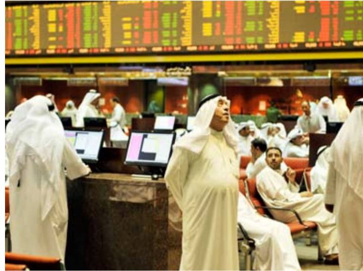
وجاء سهم «يونيكاب» على رأس نشاط الكميات بحجم بلغ 28.70 مليون سهم، وتصدر السيولة سهم «بيتك» بقيمة 11.4 مليون دينار.

تباينت المؤشرات الرئيسية لبورصة الكويت عند إغلاق تعاملات أمس الأربعاء، وسط ارتفاع 8 قطاعات. وارتفع مؤشر السوق الأول بنسبة 0.58 بالمئة، و«العام» بـ0.47 بالمئة. وصعد المؤشر «الرئيسي 50» بـ0.22 بالمئة، بينما انخفض الرئيسي بنحو 0.08 بالمئة، عن مستوى أول أمس الثلاثاء. سجلت البورصة الكويت تداولات في تلك الأثناء بقيمة 59.05 مليون دينار، وزعت على 304.63 مليون سهم، بتنفيذ 18.63 ألف صفقة. وشهدت الجلسة ارتفاعاً بـ8 قطاعات على رأسها العقار بـ1.45 بالمئة، بينما تراجعت 3 قطاعات أخرى في مقدمتها التأمين بـ1.10 بالمئة، واستقر قطاع «كفيك» القائمة الخضراء بـ12.01 بالمئة، بينما جاء «يونيكاب» على رأس تراجعات الأسهم البالغ عددها 43 سهماً بنحو 14.53 بالمئة، واستقر سعر 13 سهماً.