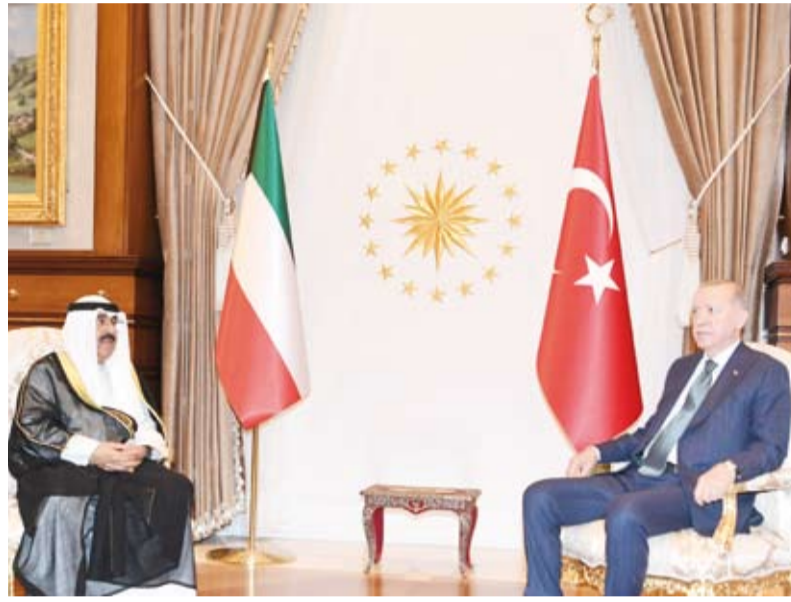
أمير البلاد والرئيس التركي خلال جلسة المباحثات الرسمية