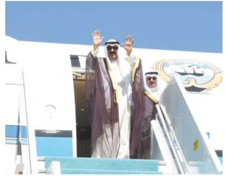
سمو أمير البلاد لدى مغادرته تركيا