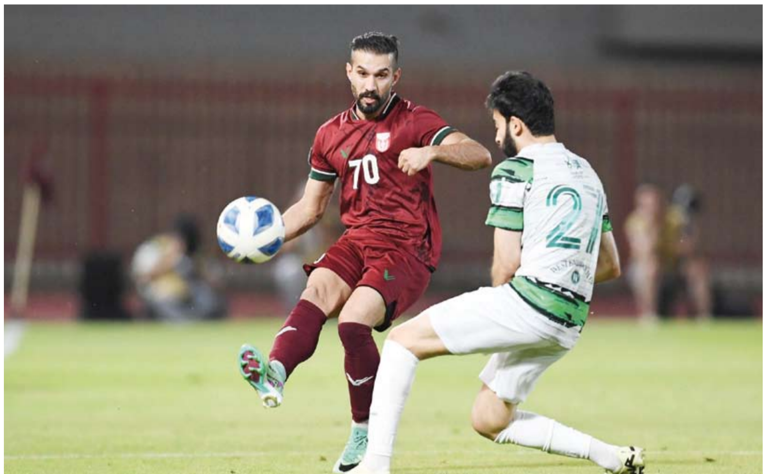
مباراة حماسية بين العربي والنصر