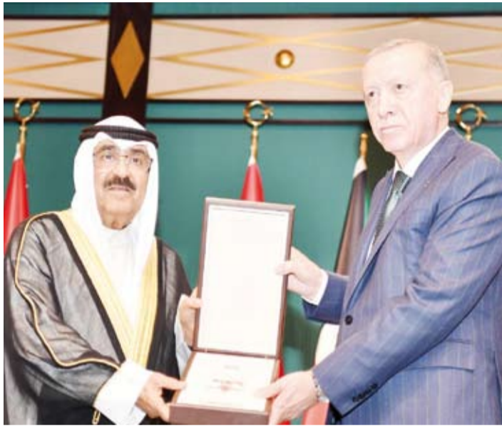
الرئيس التركي يقبل سمو أمير البلاد وسام الدولة التركية