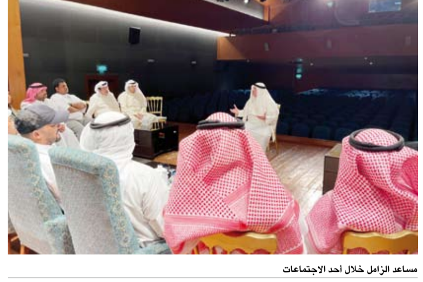
مساعد الزامل خلال أحد الاجتماعات

أكد الأمين العام المساعد لقطاع الفنون في المجلس الوطني للثقافة والفنون والآداب، مساعد الزامل، أمس، أن احتفالية الكويت عاصمة للثقافة العربية للعام 2025 ستشهد فعاليات وأنشطة متميزة بما يليق بولاية الكويت ودورها المرموق على المستوى الثقافي. وقال الزامل - وهو رئيس فريق العمل المشترك من اللجنة العليا للاحتفالية الكويت عاصمة للثقافة العربية للعام 2025 التي يترأسها وزير الإعلام والثقافة عبدالرحمن المطيري - في تصريح لـ (كونا): إن الفريق يعمل بكل جهد لإعداد ملف الاحتفالية ويقوم بجولات وجلسات مركزية لتحديد أولويات هذا الحدث الكبير. وأضاف أن الاحتفالية ستكون بأفكار جديدة وتتضمن ملتقيات ومنتديات ومهرجانات خاصة بهذا الحدث، موضحاً أن الفريق يتخصص المباني والمواقع لاختيار أفضلها والتي ستقام فيها الفعاليات وتكون محط جدوى لزيارة