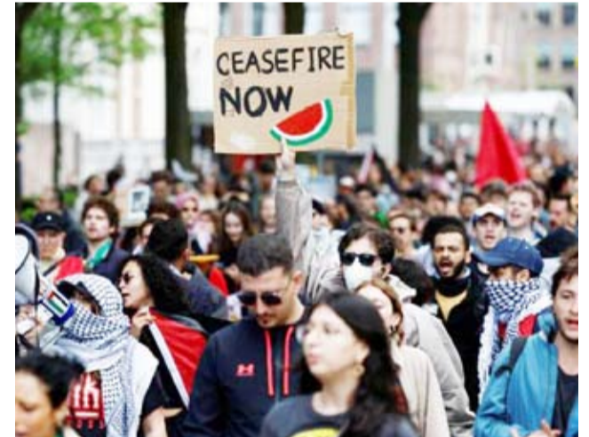
موجة الاحتجاجات الطلابية تنتقل من أميركا إلى إسبانيا