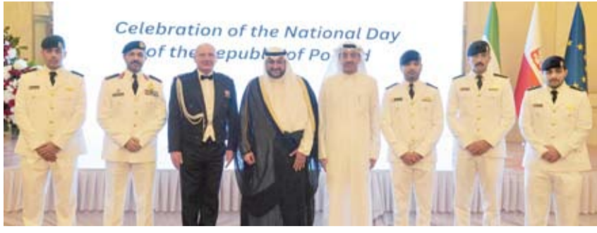
الشيخ الدكتور عبدالله مشعل الصباح خلال مشاركته في الحفل

وصادق تمنياته لجمهورية بنولندا الصديقة بهذه المناسبة الوطنية، وأشاد بسعادته بعمق ومثانة العلاقات بين البلدين الصديقين، وما تشهده من تطور مستمر على مختلف الأصعدة، وحضر الحفل أمر سلاح الدفاع الجوي اللواء الركن خالد درج سعد وعدد من الضباط الكويتيين الخريجين من الأكاديمية البحرية البولندية.