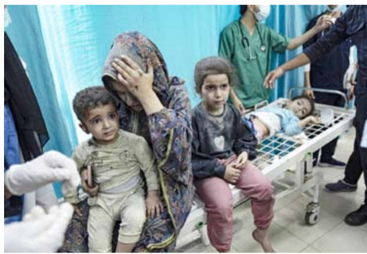
فلسطينيون مصابون في قصف صهيوني