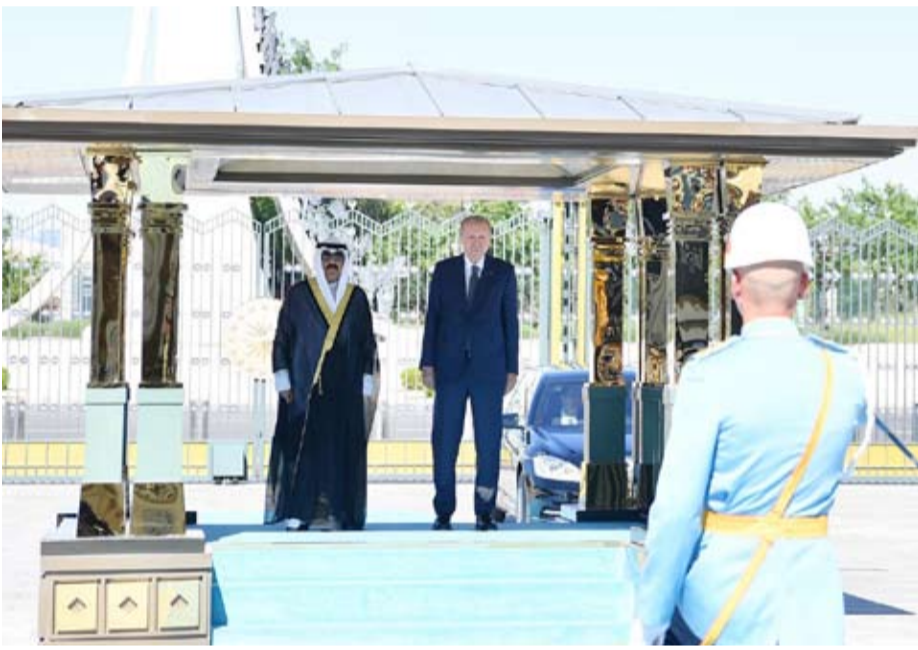
جانب من الاستقبال الرسمي لسمو أمير البلاد