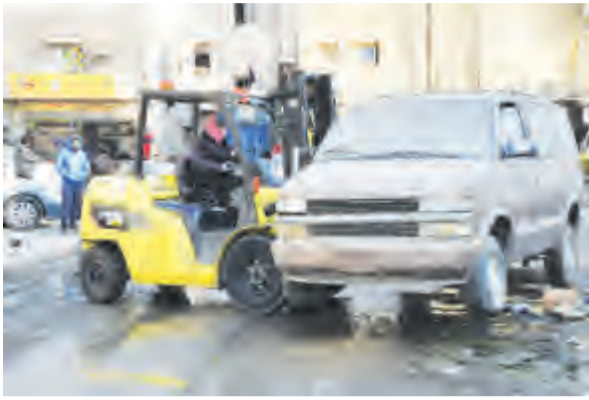
رفع إحدى السيارات المهمة