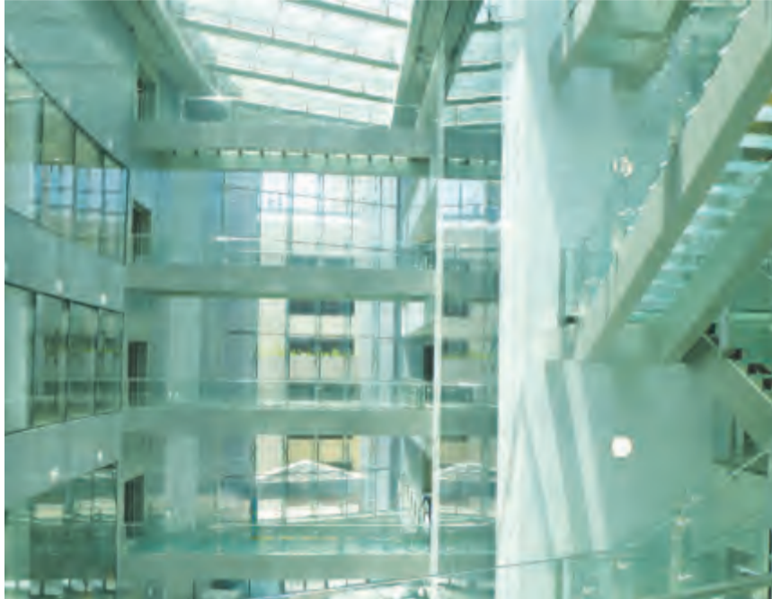
المشروع من الداخل