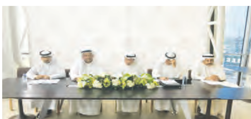
جانب من عومية أبيان

وأضافت «إن البنك يوفر حاليا في كافة فروع بعض من الخدمات التي من شأنها تسهيل معاملات العملاء من ذوي الاحتياجات الخاصة مثل مواقف السيارات أمام مدخل الفرع والممرات المنحدرة التي تسهل حركة الكراسي المتحركة من وإلى الفرع أو للوصول إلى أجهزة السحب الآلي. وتمت إضافة المزيد من الخدمات الخاصة في