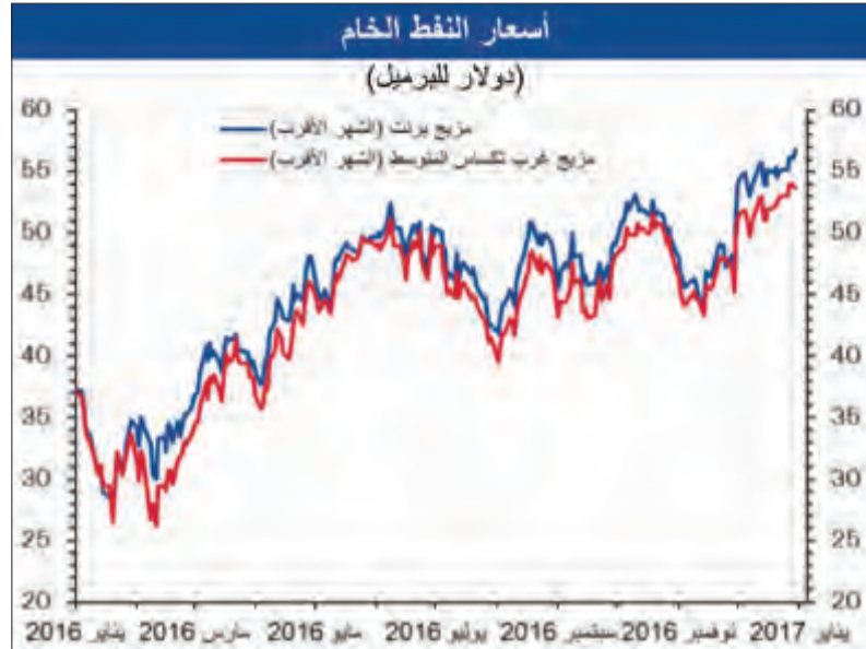
اسعار النفط الخام