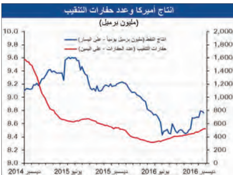
إنتاج أميركا وعدد حفارات التنقيب