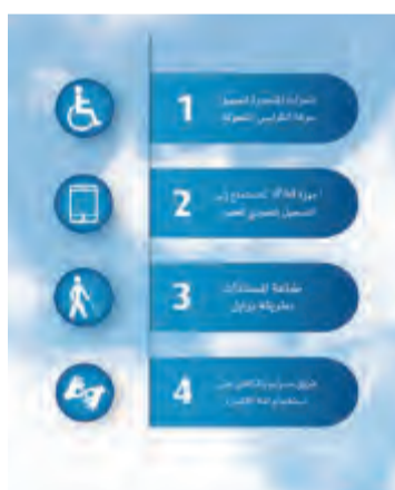
خدمات مخصصة لعملاء ذوي الاحتياجات الخاصة

الوطني يقدم خدمات مميزة لذوي الاحتياجات الخاصة