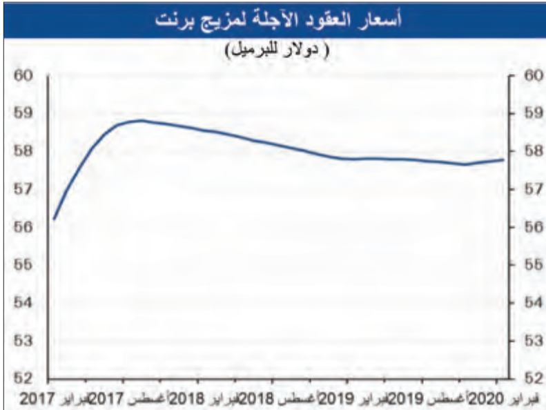
اسعار العقود الآجلة لمزيج برنت

من المحتمل أن تؤدي القوة النسبية في مستوى الطلب مع خفض الإنتاج من قبل الدول التابعة لأوبك وغير التابعة لها إلى تسجيل عجز في ميزان الإنتاج والطلب خلال النصف الأول من العام 2017. وترجح وكالة الطاقة الدولية إلى بلوغه 0.6 مليون برميل يوميا. وقد تتمكن المنظمة من تحقيق هدفها في حال انعكس ذلك على تحركات أسعار النفط بحلول اجتماع المنظمة بين وزراء نطق الدول الذي من المزمع عقده في يونيو. ولكن من الجدير بالذكر أن نجاح مساعي المنظمة أمرا لا يشترط فقط التزام الدول بسقف الإنتاج المقرر لها (مع الأخذ بعين الاعتبار تجاوزاتها السابقة بخصوص سقف الإنتاج) ولكنه أيضا رهن تحركات إنتاج النفط الصخري الذي يجب ألا يسجل المزيد من الارتفاع. ويبدو على أي حال أن منظمة أوبك ستحافظ على دورها الأساسي في التحكم بتحركات الأسواق خلال العام 2017 كما كان الحال في العام 2016.