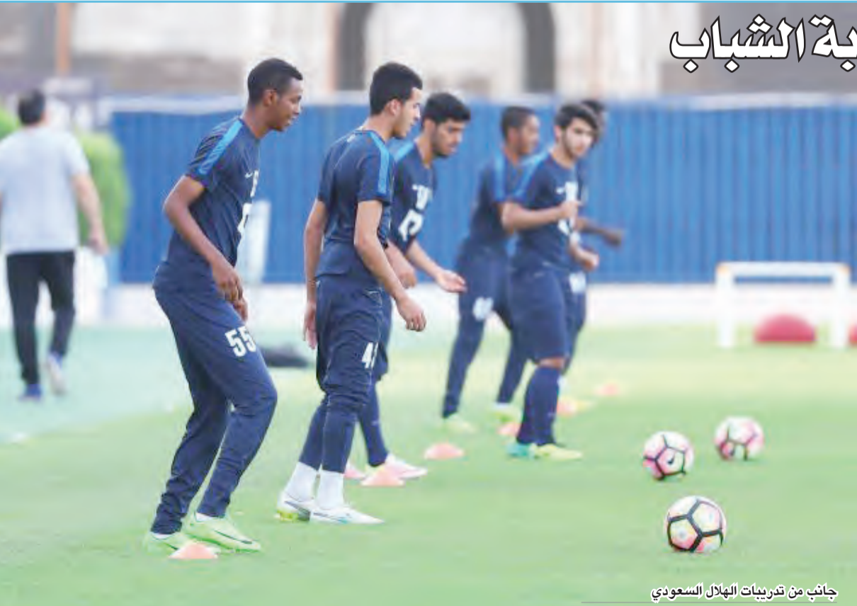
جانب من تدريبات الهلال السعودي

رفع شعار التحدي وأكد إصراره على تقديم أداء جيد يليق به لمصاحبة جماهير الفريق عن الموسم المتواضع الذي قدمه الفريق هذا الموسم. وحرص المدرب الفني للشباب سامي الجابر، على تحفيز لاعبيه لبذل أقصى مجهود لهم، وتقديم أداء جيد يمكنهم من الفوز بالمباراة، وسيبدل الشباب بصفوف مكتملة، بقيادة الجزائري محمد بن بطو الذي يعول عليه الشباب في تسجيل الأهداف.