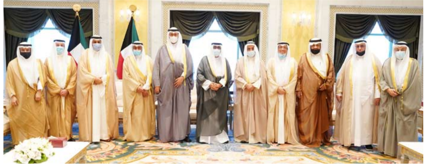
سمو ولي العهد متوسلاً رئيس وأعضاء المجلس الأعلى للقضاء

استقبل سمو أمير البلاد الشيخ نواف الأحمد بقصر السيف صباح أمس المستشار أحمد العجيل الذي أدى اليمين الدستورية أمام سموه بمناسبة تعيينه رئيس المجلس الأعلى للقضاء ورئيس محكمة التمييز والمستشار الدكتور عادل بورسلي الذي أدى اليمين الدستورية أمام سموه بمناسبة تعيينه نائب رئيس محكمة التمييز والمستشار محمد بن ناجي رئيس محكمة الاستئناف والمستشار علي المطيرات نائب رئيس محكمة الاستئناف والنائب العام المستشار ضرار السعوسي والمستشار عبداللطيف الخنيان الذي أدى اليمين الدستورية أمام سموه بمناسبة تعيينه رئيس المحكمة الكلية ووكيل محكمة التمييز المستشار خالد المزبني ووكيل محكمة التمييز المستشار محمد أبو صليب ووكيل وزارة العدل عمر الشرفاوي.