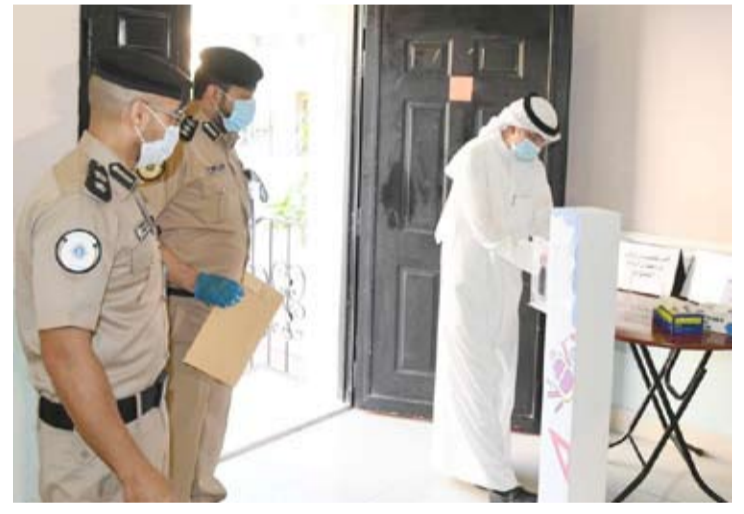
إجراءات احترازية لائتة في مقر إدارة شؤون الانتخابات