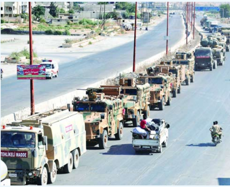
قوات تركية تتجه إلى منطقة مراقبة في ادلب

حذر وزير الخارجية التركي مولود جاويش أوغلو امس النظام السوري من مهاجمة قوات بلاده في محافظة ادلب شمال غرب سوريا. ووزير خارجية السلطادور الكساندرا هيل في انقرة ان بلاده ستفعل كل ما يلزم من أجل تأمين سلامة الجيش التركي ردا على غارة جوية شنها النظام السوري امس الاول على رتل عسكري تركي في ادلب. وأكد ان «تركيا لا تنوي إزالة نقطة المراقبة التاسعة التي أنشأتها جنوب ادلب وفقاً لاتفاق مسار أستانا بين الدول الضامنة روسيا وتركيا وإيران».