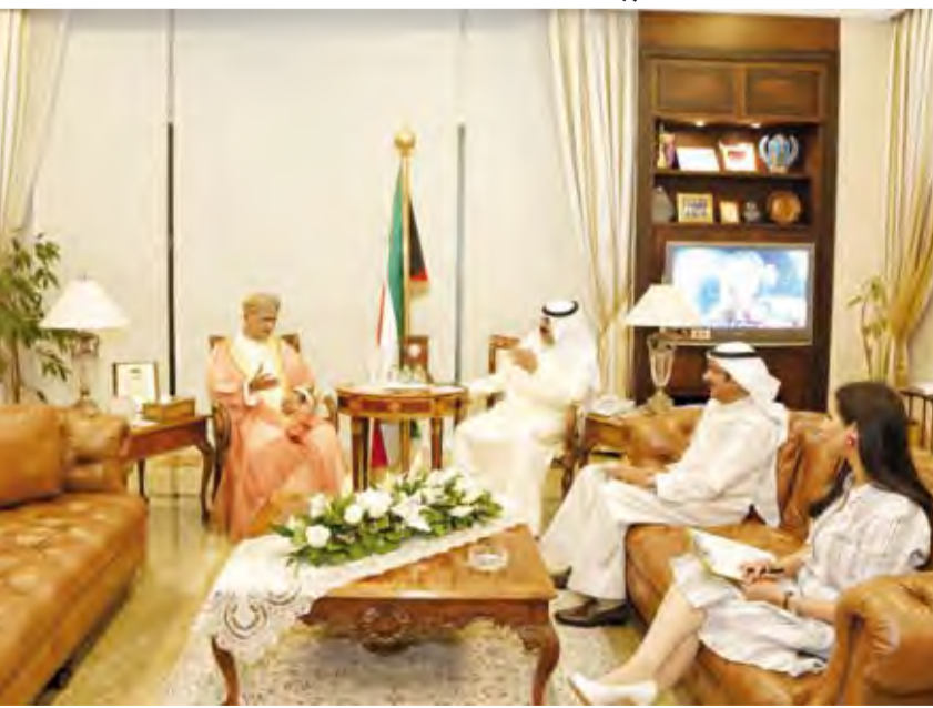
خالد الجار الله خلال لقائه السفير العماني عدنان بن أحمد الأنصاري

اجتمع نائب وزير الخارجية خالد سليمان الجار الله أمس الثلاثاء مع سفير سلطنة عمان الشقيقة لدى دولة الكويت السفير عدنان بن أحمد الأنصاري. وبحث اللقاء مساعد وزير الخارجية لشؤون مكتب نائب الوزير السفير أيهم عبداللطيف العمر. وتم خلال اللقاء بحث عدد من أوجه العلاقات