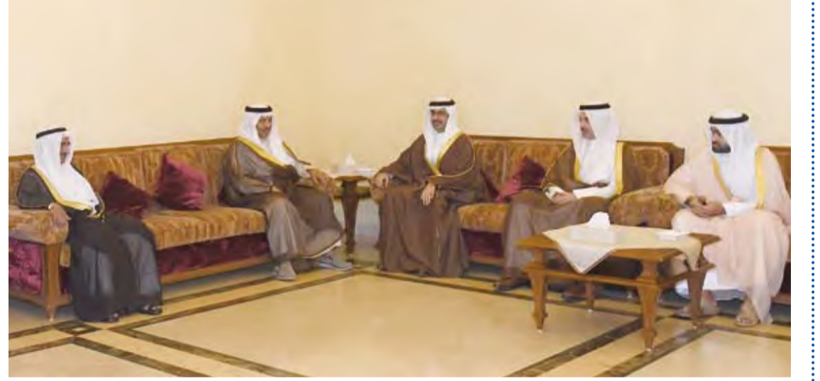
سمو الشيخ جابر المبارك يستقبل سمو الشيخ خليفة بن علي آل خليفة

استقبل سمو الشيخ جابر المبارك رئيس مجلس الوزراء أمس الممثل الشخصي لصاحب السمو الملكي الأمير خليفة بن سلمان آل خليفة