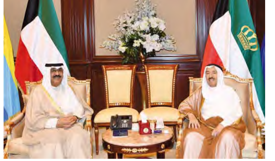
سمو الأمير يستقبل الشيخ مشعل الأحمد

العشرات من الضحايا والمصابين راجيا سموه لضحايا هذه الأعمال المروعة والرحمة وللمصابين سرعة الشفاء والعافية.