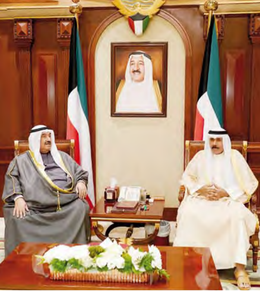
سمو ولي العهد يستقبل سمو الشيخ ناصر المحمد

استقبل سمو ولي العهد الشيخ نواف الأحمد وبمقر بيان صباح أمس سمو الشيخ ناصر المحمد. رئيس الحرس الوطني الشيخ مشعل الأحمد.