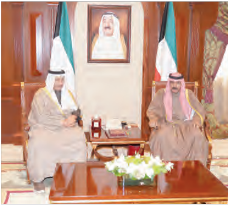
سمو ولي العهد يستقبل سمو الشيخ جابر المبارك

استقبل سمو ولي العهد الشيخ نواف الأحمد بقصر بيان أمس سمو