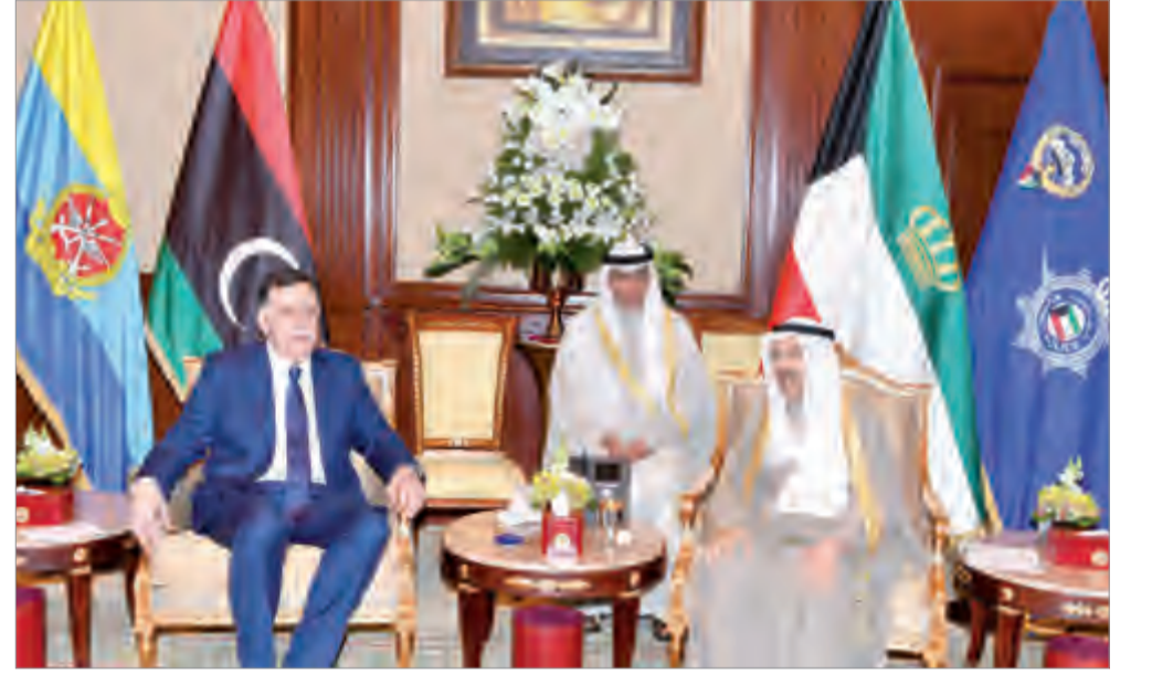
سمو الأمير يستقبل فائز السراج

وقد عبر الأمين لمجلس التعاون لدول الخليج العربية لصاحب السمو أمير البلاد عن بالغ شكره وتقديره لتوجيهات سموه السديدة تجاه مسيرته العمل الخليجي المشترك، معرباً عن اعتزازه لما تشهده دولة الكويت من نهضة ونماء وازدهار في ظل قيادة سموه الحكيم، متمنياً لدولة الكويت أميراً وحكومة وشعباً دوام العزة والرفعة، وحضر القابلتين وزير شؤون الدبوان الأميري الشيخ علي الجراح.