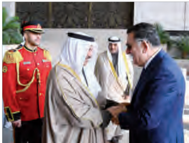
سمو الشيخ جابر المبارك يستقبل فائز السراج

رئيس المجلس الرئاسي لحكومة الوفاق الوطني بدولة ليبيا الشقيقة فائز السراج والوفد المرافق له وذلك بمناسبة زيارته للبلاد.