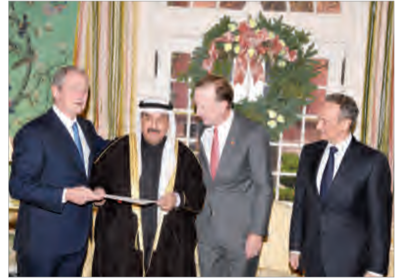
سمو الشيخ ناصر المحمد يسلم رسالة سمو الأمير إلى الرئيس جورج دبليو

فقندا صديقا عزيزا له معزة خاصة وقد را كبريا في قلوب الشعب الكويتي الذي لن ينساه أبداً ونصيرا للحق والعدالة. مستذكرا بكل التقدير والإعتراف مواقف الراحل التاريخية والشجاعة المشرفة تجاه دولة الكويت والتي تجسدت جليا في رفضه القاطع للاحتلال العراقي الغاشم لها منذ اللحظات الأولى ودوره الريادي الكبير في تشكيل وقيادة التحالف الدولي لتحرير دولة الكويت من ذلك الاحتلال وسعيه الشخصي في حشد دعم نظرائه رؤساء دول العالم لتشكيل