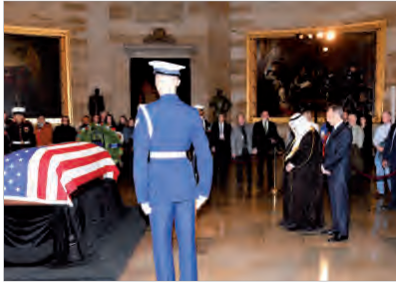
المحمد بلقي نظرة أخيرة على جثمان الرئيس جورج بوش في واشنطن