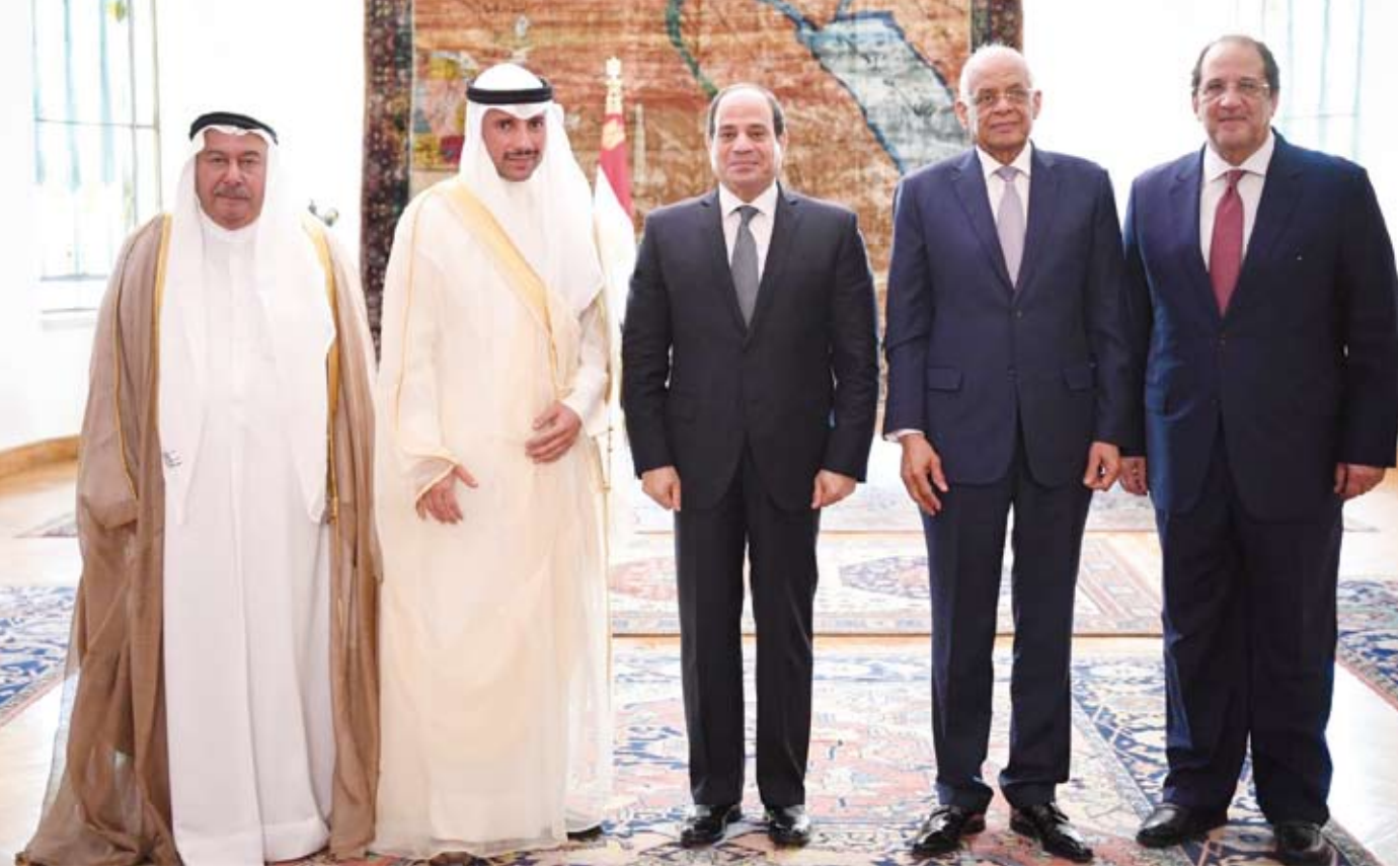
الرئيس المصري يستقبل مرزوق الغانم

السياسي أكد عمق العلاقات الأخوية التاريخية مع الكويت