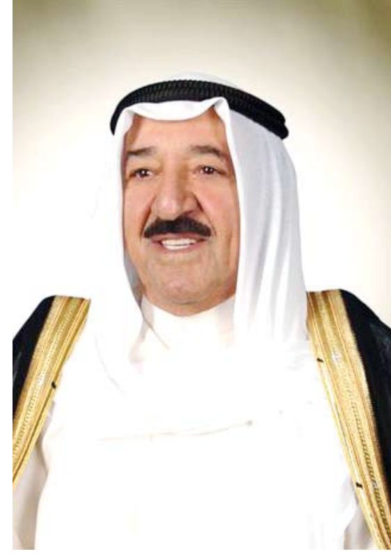
سمو أمير البلاد الشيخ صباح الأحمد

بعث صاحب السمو أمير البلاد الشيخ صباح الأحمد ببرقية تهنئة إلى الرئيس أندريس مانويل لوبيز أوبرادور رئيس الولايات المكسيكية المتحدة الصديقة عبر فيها سموه عن خالص تهنئه بمناسبة العيد الوطني لبلاده متمنيا سموه لفخامته وموفور الصحة والعافية وللبلد الصديق دوام التقدم والازدهار. وبعث سمو نائب الأمير وولي العهد الشيخ نواف الأحمد ببرقية تهنئة إلى الرئيس أندريس مانويل لوبيز أوبرادور رئيس الولايات المكسيكية المتحدة الصديقة عبر فيها سموه عن خالص تهنئه بمناسبة العيد الوطني لبلاده راجيا سموه لفخامته وموفور الصحة والعافية.