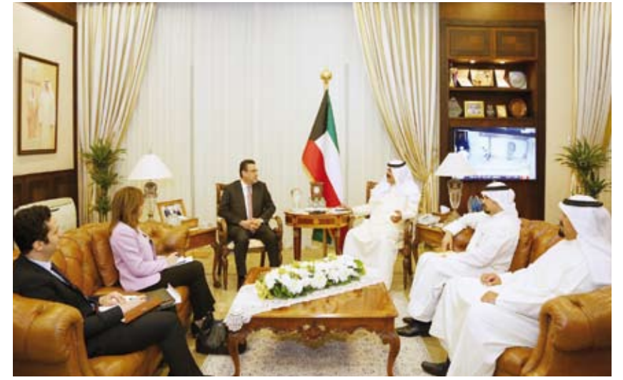
خالد الجار الله خلال لقائه السفير المصري

اجتمع نائب وزير الخارجية خالد الجار الله أمس الاثنين مع سفير جمهورية مصر العربية لدى دولة الكويت طارق الفوني، إذ تم خلال اللقاء بحث عدد من أوجه العلاقات الثنائية بين البلدين،