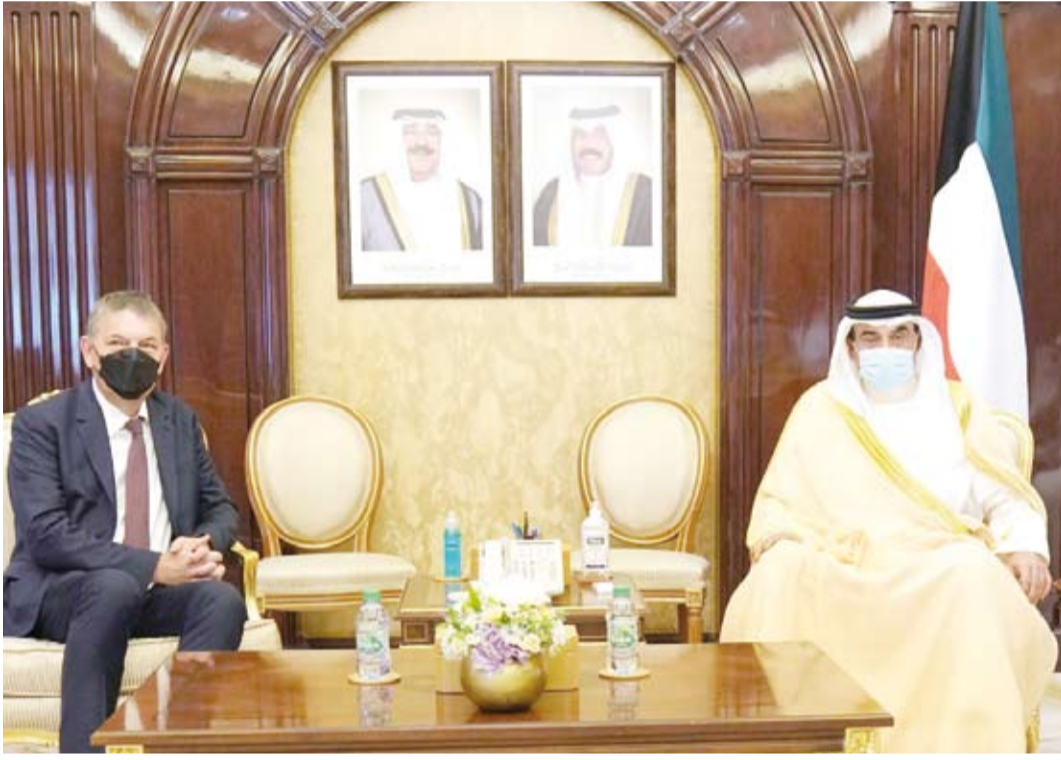
يستقبل المفوض العام لوكالة الأمم المتحدة لإغاثة وتشغيل اللاجئين الفلسطينيين بالشرق الأدنى

السداد لكل ما فيه خير ورفعة العراق الشقيق وتحقيق كل ما يتطلع إليه الشعب العراقي من تقدم وازدهار، راجياً لهما دوام الصحة وموفور العافية.