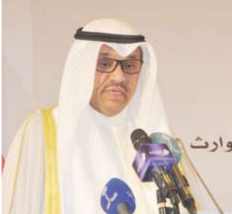
السير جاسم المباركي

التي تقدم للمفوضية الاممية لحقوق الإنسان، وأضاف العيسى أنه لمس حرص الديوان الوطني لحقوق الإنسان على التعاون مع اللجنة الوطنية الدائمة للقانون الدولي الإنساني.