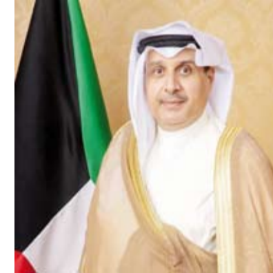
الشيخ حمد جابر العلي

دعا نائب رئيس مجلس الوزراء ووزير الدفاع، الشيخ حمد جابر العلي، الضباط المرقيين من الدفعتين (36) و(43) لأن يكونوا دائماً قدوة في تعاملهم ومثالا يحتذى به في أقوالهم وتصرفاتهم وأن يعملوا بكل إخلاص وتفان لخدمة وطنهم وحميتهم والذود عن ترابه الغالي.