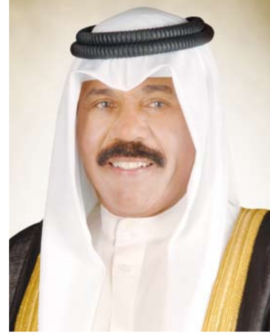
سمو أمير البلاد الشيخ نواف الأحمد

سموه خالص تعازيه وصادق مواساته بوفاته أحد رجالات الوطن الأوفياء المغفور له بإذن الله تعالى المؤرخ سيف مرزوق الشمال، رحمه الله ومغفرتة وأن يستغفره بواسع رحمته وذويه جميل الصبر وحسن العزاء.