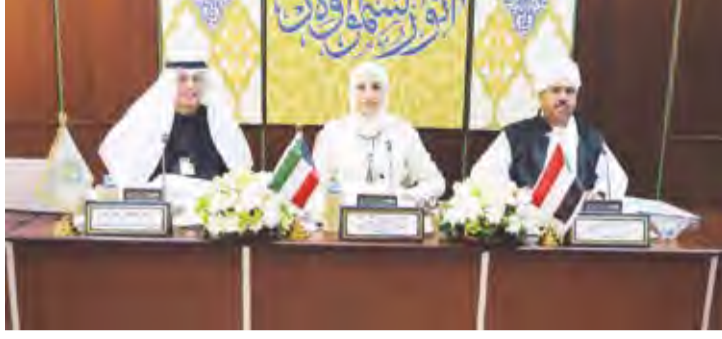
الوزيرة مريم العقيل خلال الاجتماع