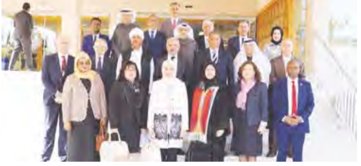
العقيل في لقطة جماعية مع المشاركين