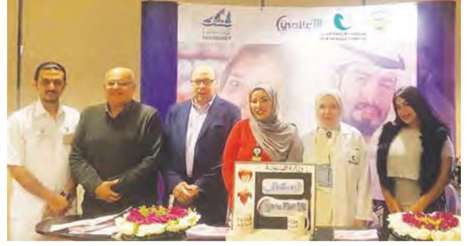
الفريق الطبي لمستشفى المواساة الجديد