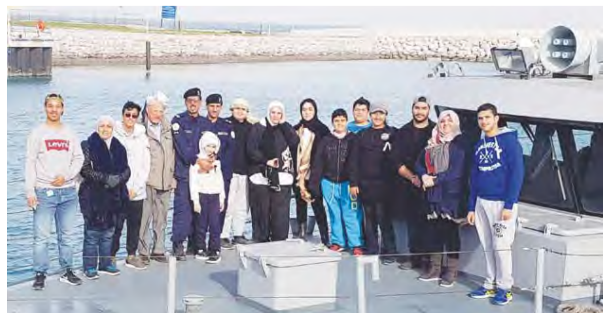
فريق أصدقاء البيئة

العيسى تناول خلاله أبرز أدوار خفر السواحل خاصة في شقها البيئي إلى جانب الدور