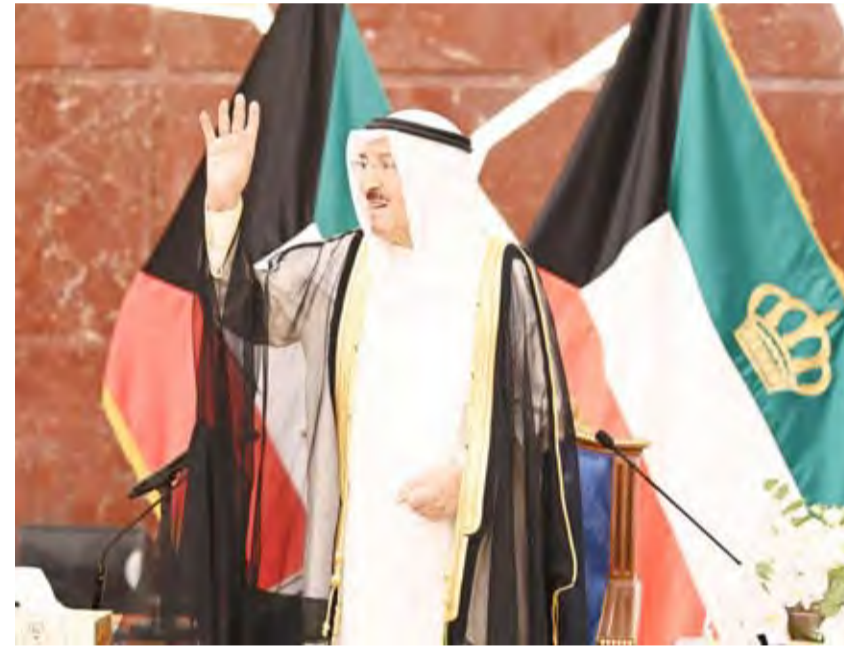
تحية من سمو الأمير للحضور