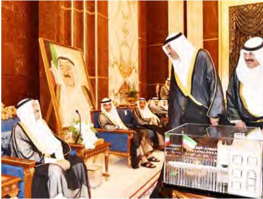
تقديم هدية تذكارية لسمو الأمير