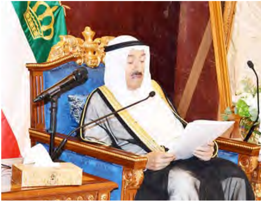
أمير البلاد يلقي كلمة خلال اللقاء

وقد قام صاحب السمو أمير البلاد وسمو ولي العهد بالتوقيع على سجل الشرف. وتم خلال هذه الزيارة إهداء سموه وسمو ولي العهد هدايا تذكارية بهذه المناسبة.