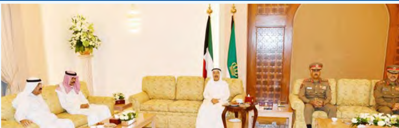
سمو الأمير وسمو ولي العهد والشيخ مشعل الأحمد خلال مأدبة الإفطار

أقام سموه وسمو ولي العهد والشيخ مشعل الأحمد اللقاء نائب رئيس الحرس الوطني الشيخ مشعل الأحمد.