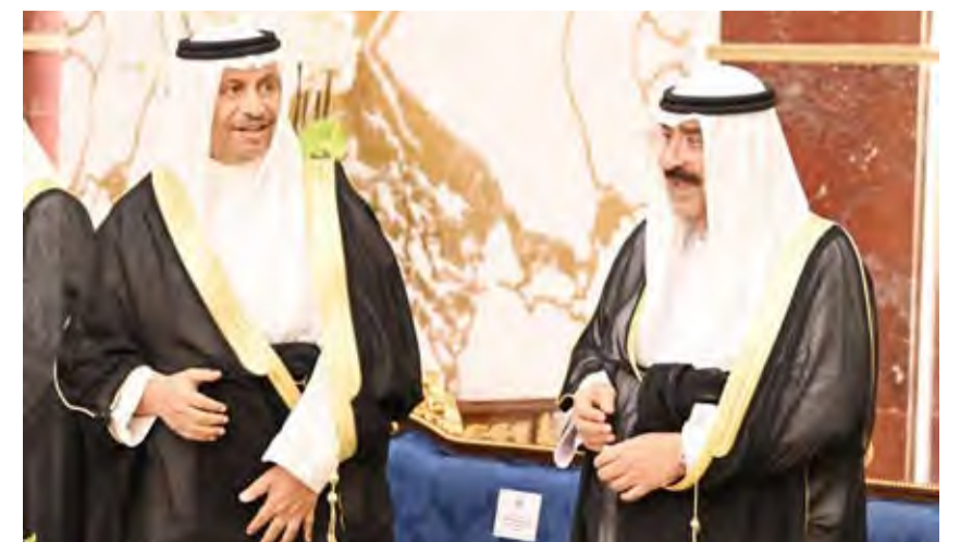
سمو الشيخ جابر المبارك والشيخ مشعل الأحمد

استقبل صاحب السمو أمير البلاد الشيخ صباح الأحمد وسمو ولي العهد الشيخ نواف الأحمد بقصر دسمان مساء أمس الأول النائب الأول لرئيس مجلس