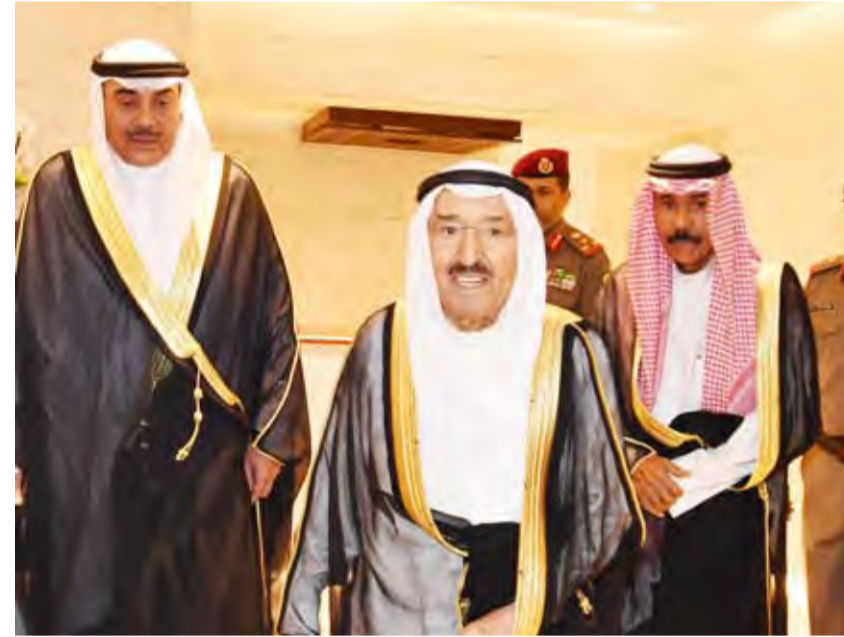
الشيخ صباح الخالد مرحباً بحضور سمو الأمير وسمو ولي العهد

قام صاحب السمو أمير البلاد الشيخ صباح الأحمد مساء أمس الأول وفي معيته سمو ولي العهد الشيخ نواف الأحمد بزيارة إلى مبنى وزارة الخارجية. وقد كان في استقبال سموه نائب رئيس مجلس الوزراء ووزير الخارجية الشيخ صباح الخالد ونائب وزير الخارجية خالد الجارالله وكبار المسؤولين بوزارة الخارجية. وقد حضر اللقاء رئيس مجلس الأمة مرزوق الغانم وأصحاب السمو والمعالى كبار الشيوخ وسمو الشيخ جابر المبارك رئيس مجلس الوزراء وكبار المسؤولين بالدولة. وقد ألقى سموه كلمة بهذه المناسبة جاء فيها: «يسرني أن أهنيكم بشهر رمضان المبارك أعاده الله علينا جميعا وعلى وطننا العزيز والأمتين العربية والإسلامية بالخير واليمن والبركات.