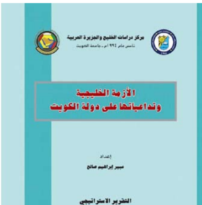
إصدار «الأزمة الخليجية وتداعياتها على دولة الكويت»