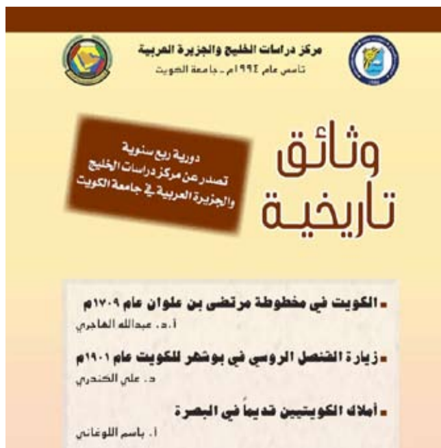
إصدار «وثائق تاريخية»