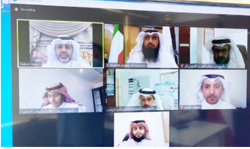
المشاركون في حفل التوقيع