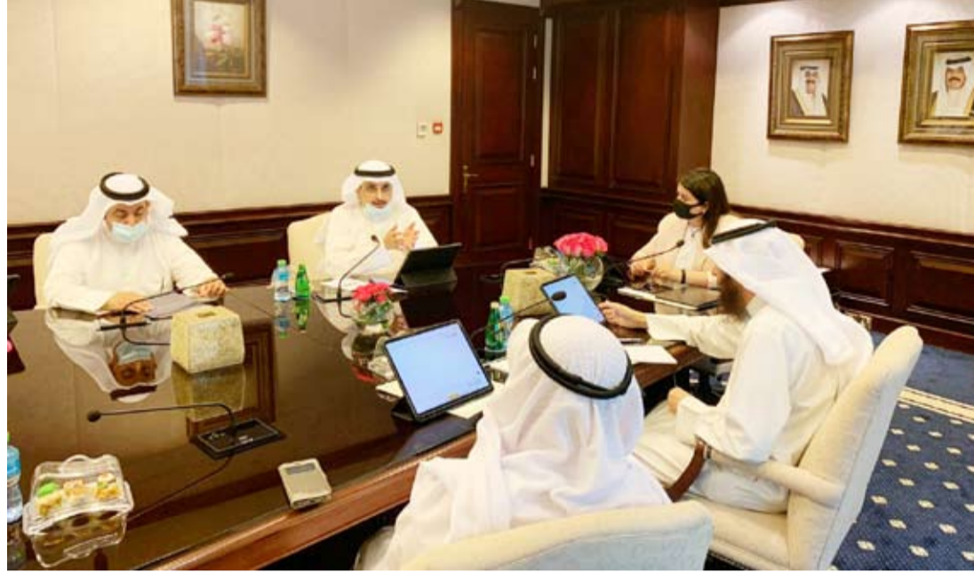
جانب من اجتماع المنفوحى مع درنا الفارس

أعلن المدير العام لبلدية الكويت أحمد المنفوحى أمس البدء قريباً بتفعيل الربط الإلكتروني مع المؤسسة العامة لرعاية السكنية، وذلك لتسريع إنجاز المعاملات آلياً دون الحاجة لمراجعة البلدية. وقال المنفوحى في بيان صحفي: إن البلدية تسعى دائماً لتطوير المنظومة الإدارية لتحسين خدماتها وتبسيط الإجراءات والتسهيل على المواطنين لإنجاز المعاملات والحصول على خدمة أفضل. وأضاف أن الخدمة الجديدة ستمكن صاحب المنزل المرهونة وثيقته لدى (السكنية) من نقل ملكية العقار عن طريق وزارة العدل دون الحاجة إلى مراجعة البلدية، مشيراً إلى أن تشغيل الخدمة سيضمن معاملات المناطق المتطابقة عناوينها بين البلدية (والسكنية).