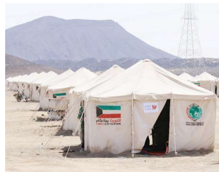
مخيم إيواء النازحين في الجوف

دشنت مؤسسة التواصل للتنمية الإنسانية، مشروع الإغاثة العاجلة بافتتاح مخيم إيواء نازحي الجوف بمحافظة مارب، بتمويل من الجمعية الكويتية للإغاثة وإشراف مكتب الجمعية الكويتية باليمن.