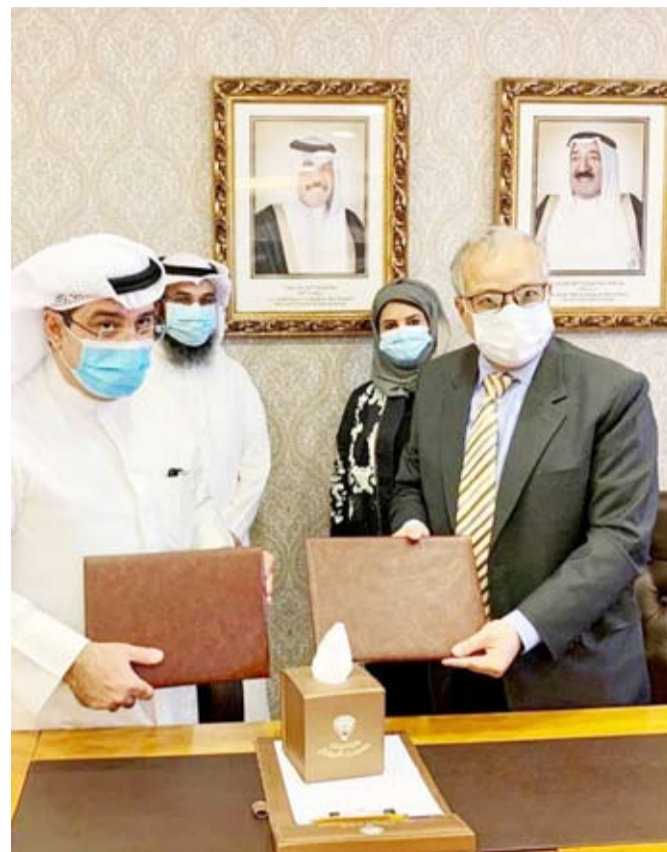
وكيل وزارة الصحة وسفير باكستان الإسلامية بعد توقيع اتفاقية التعاون الصحي