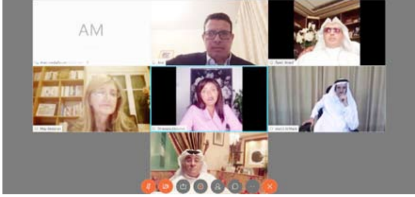
المشاركون في الجلسة الثانية

العربي مثل عدم تأهيل الكوادر الصحفية القادرة على مواكبة الإعلام الجديد وتستطيع أن تقدم طرحاً مختلفاً بدلاً من الاعتماد على المبالغيات من أجل جذب الجمهور.