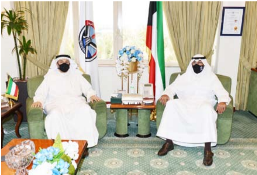
الشيخ فواز الخالد مستقبلاً وزير البلدية

عموماً وما يخص محافظة الأحمد على نحو خاص، وأبرز المستجدات على الساحة المحلية وأفاق وإمكانية تعزيز التعاون المشترك لمحافظة الأحمد ووزارة الدولة لشؤون البلدية على الصعد كافة.