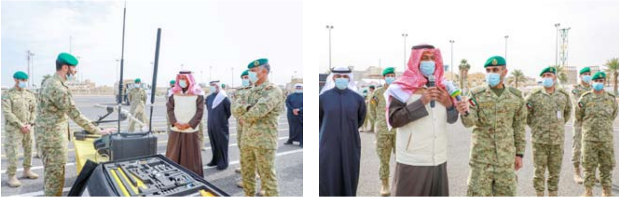
جانبا من زيارته التفقدية