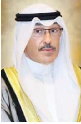
الشيخ فوزان الخالد

السكنية الجديدة، إلا أنها كانت سبابة لإقامة المحاجر الصحية المؤسسية لاستضافة العائدين من الخارج والمصابين، إضافة إلى الخطوة الغير مسبوقه لتحويل مركز خدمات تابع لوزارة الداخلية إلى سوق استهلاكي لخدمة أهالي قاطني منطقة الخبران البحرية، وتشييد أول مستشفى ميداني وأول فرع جمعية تعاونية ميداني بمنطقة الجهولة خلال فترة الحظر الكلي والمناطقية تزامنا مع بداية الجائحة، الأمر الذي يحملنا جميعا مسؤولية استمرار تلك الجهود والتأمين حفاظا على الصحة العامة للمجتمع.