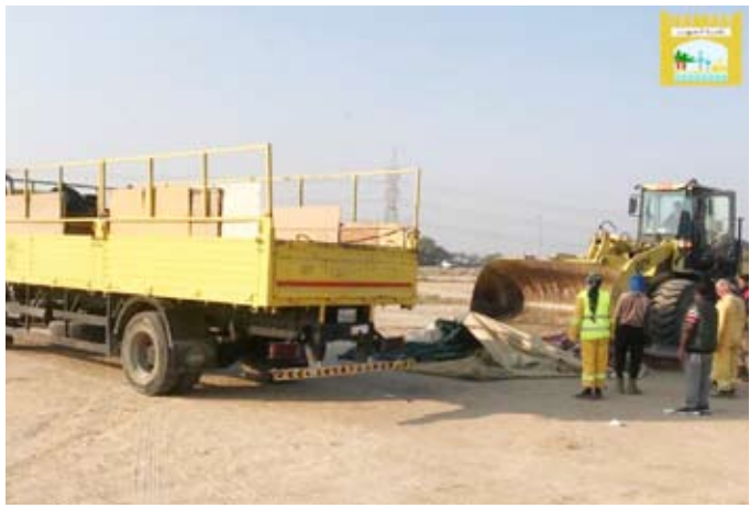
إزالة أحد المخيمات