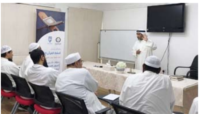
إحدى المحاضرات قبل انتشار «كورونا»