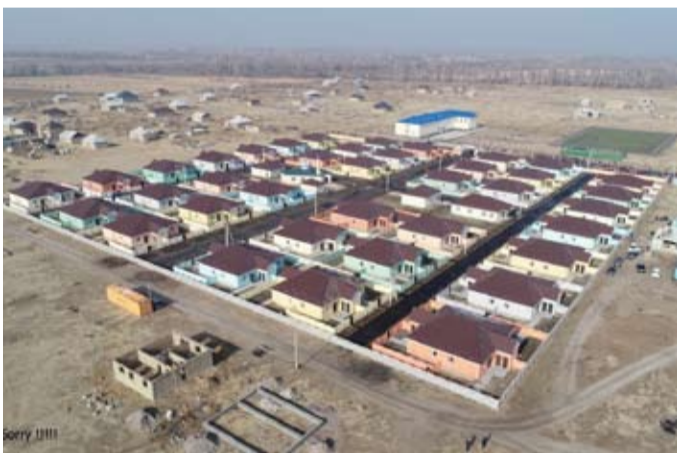
قرية الأرامل والأيتام في قيرغيزستان

عليه وسلم: «المؤمن للمؤمن كالبنيان يشد بعضه بعضا»، مبينا أن هذا المشروع يعد نوعاً من أنواع التكافل الاجتماعي بين المسلمين، ويأتي إيماناً من جمعية «الصفاء الخيرية» بأهمية طرح المشاريع التنموية التي تحقق أهداف التنمية المستدامة في العمل الخيري الكويتي، وتفعيل رؤية كويت جديدة 2035.