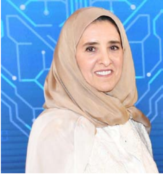
الشيخة عابدة سالم العلي

بأثواب الصحة والعافية ليتابع قيادته لمسيرة التقدم والتحديث مع أخيه ولي العهد الأمين والحكومة الرشيدة راجية للكويت الحبيبة المزيد من التقدم والارتقاء.