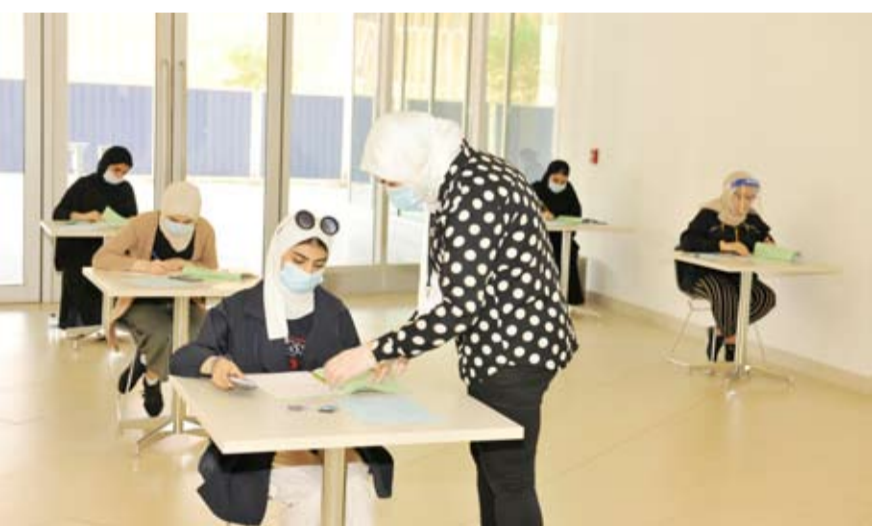
جانب من الاختبارات