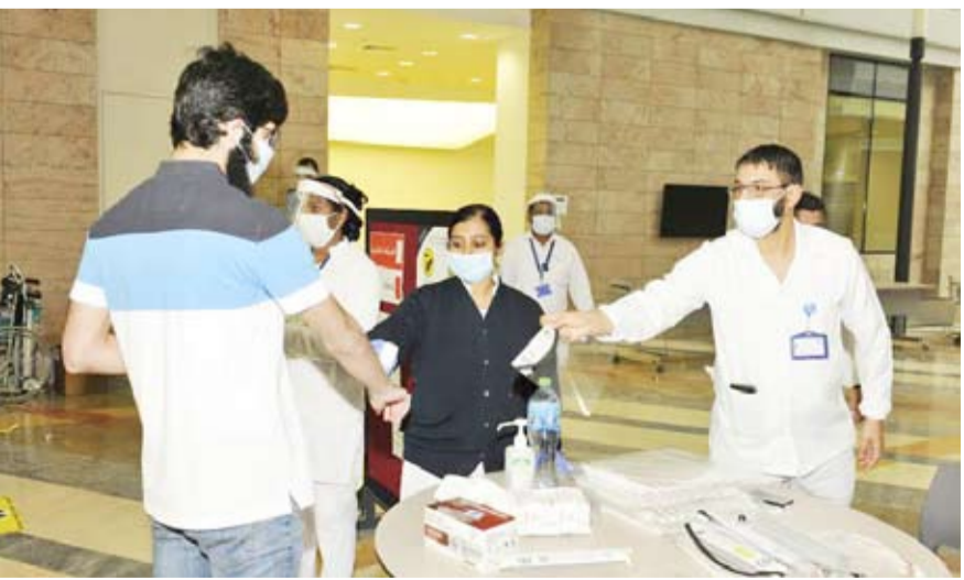
اتخاذ الإجراءات الاحترازية

مشكوراً في استقبال الطلبة وإرشادهم للدخول إلى قاعاتهم. وتقدمت د. الجار الله بالشكر لوزارة الصحة والاتحاد الوطني لطلبة جامعة الكويت، وإدارة الأمن والسلامة على تعاونها وجهودها بالإشراف على جميع مداخل ومخارج الجامعة (face shield).