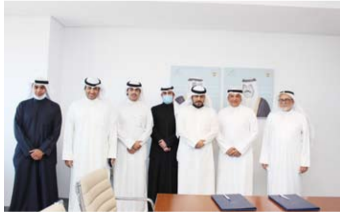
لقطة جماعية للمشاركين