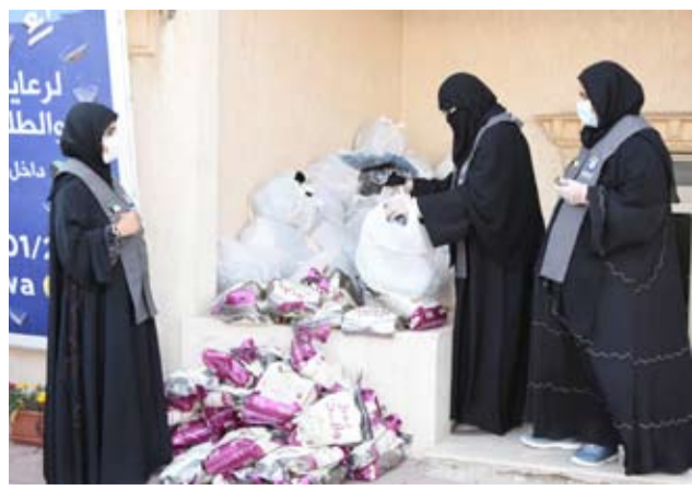
تجهيز كسوة الشتاء للمستفيدين

المشروع من خلال الاتصال هاتفياً، أو زيارة حسابات النجاة الخيرية في شتى منصات التواصل الاجتماعي.