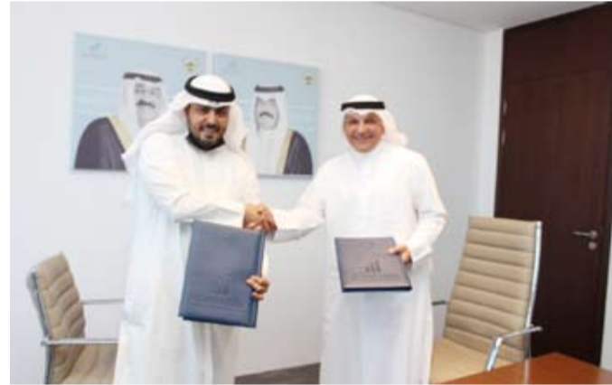
د. مشعل الربيع ورئيس جمعية المحامين شريان الشريان

وقال الربيع: إنه سيتم اختيار 50 مساعداً محام قانوني من حملة شهادة دبلوم القانون وسيتم فتح باب التقديم قريباً من خلال موقع مكتب وزير الدولة لشؤون الشباب. من جانبه أكد رئيس جمعية المحامين الكويتية شريان الشريان أن الجمعية ستقدم برنامجاً تدريبياً متكاملًا للشباب الكويتيين وستوفر الفرص الوظيفية للمتدربين بعد اجتياز الفترة التدريبية والتجريبية.