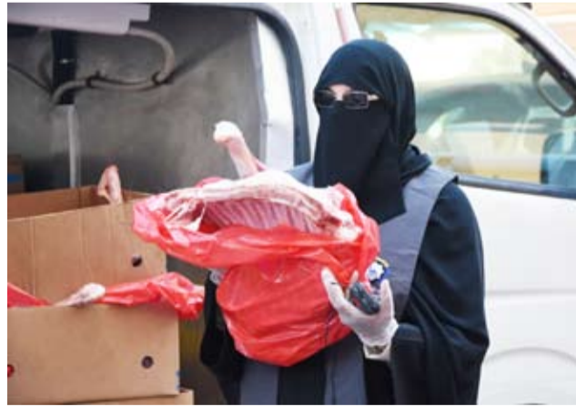
وضحة البليس تشارك في توزيع اللحوم