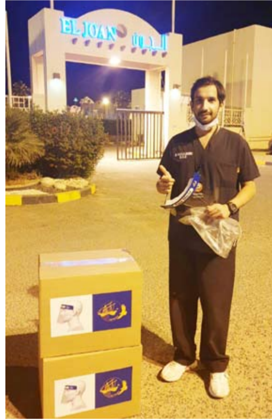
توزيع واقى الوجه في متجر الجون

الصناعة وافقت على المنتج بعد محاولات عدة أجراها المختصون لتصنيع واقى الوجه بمواصفات عالية.