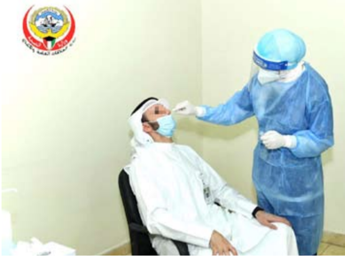
4 آلاف مسحة بقطاع البنوك لكشف «كورونا»