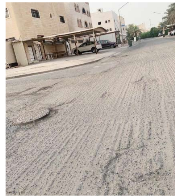
جانب من أوضاع الطرق الداخلية في الفردوس والعارضية