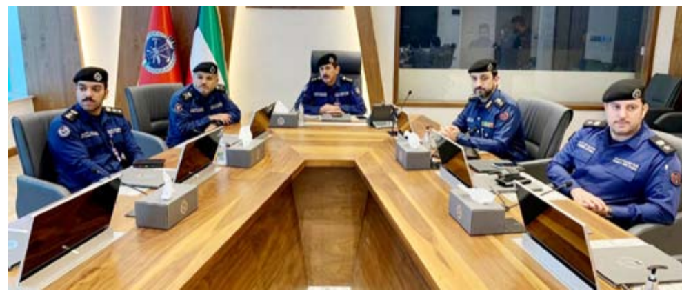
الفريق خالد المكراد يتابع تفاصيل الحادث