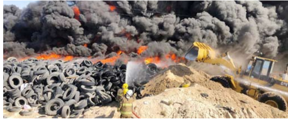
قوة الإطفاء العام تسيطر على حريق إطارات في إرحية

أعلنت قوة الإطفاء العام الكويتية سيطرة 4 فرق على حريق إطارات في منطقة إرحية الذي نشب في وقت سابق صباح أمس الثلاثاء. وقالت إدارة العلاقات العامة والإعلام في (الإطفاء) في بيان صحفي: إن فرق الإطفاء من مراكز الجهراء الحربية والتحرير والعارضية والإسناد تعاملت مع الحريق الذي بلغت مساحته نحو 5 آلاف متر مربع وتمكنت من السيطرة عليه.