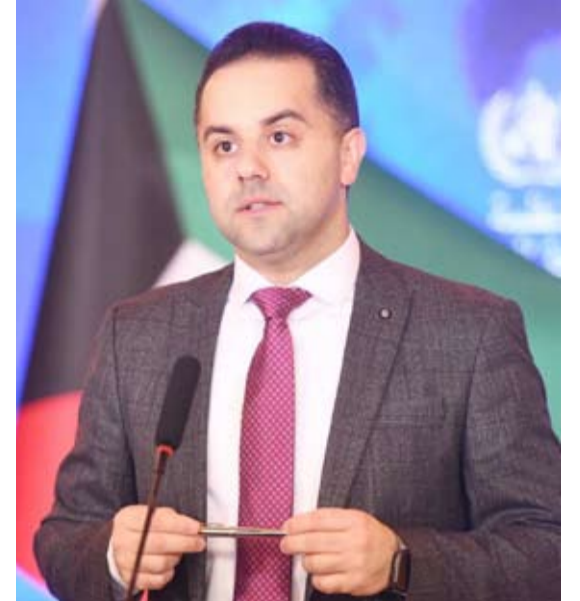
د. عبدالله السند

أعلنت وزارة الصحة الكويتية أمس، تسجيل 494 إصابة جديدة بفيروس كورونا المستجد (كوفيد-19) في الساعات الـ24 قبل الماضية، ليرتفع بذلك إجمالي عدد الحالات المسجلة في البلاد إلى 155,335. في حين تم تسجيل حالة وفاة واحدة ليصبح مجموع حالات الوفاة المسجلة حتى أمس 946 حالة.