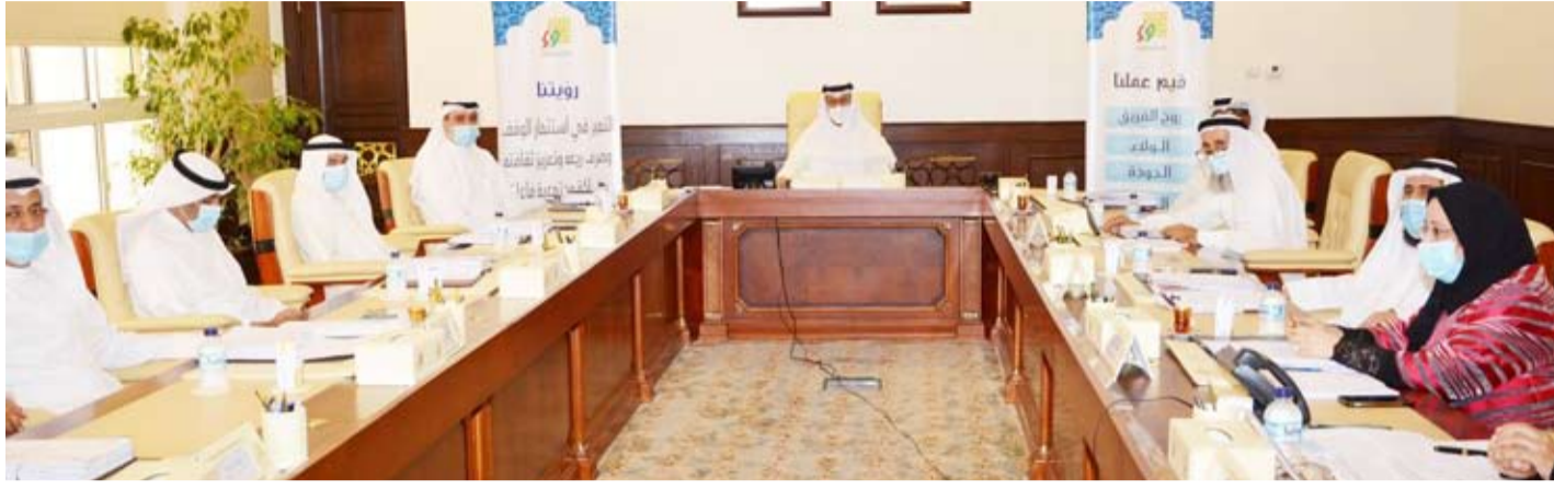
د. فهد العفاسي مترأساً الاجتماع

ترأس وزير العدل وزير الأوقاف والشؤون الإسلامية ورئيس مجلس شؤون الأوقاف المستشار د. فهد العفاسي اجتماع مجلس شؤون الأوقاف الثالث والتسعون منعقد صباح أمس الأحد، في مقر الأمانة العامة للأوقاف، ورحب العفاسي في مستهل الاجتماع بأعضاء المجلس، شاكرًا جهودهم المبذولة في سبيل الارتقاء والنهوض بالدور التنموي للوقف. وقد استعرض المجلس الموضوعات المدرجة على جدول الأعمال واتخذ حيالها عددًا من القرارات والتوصيات أبرزها تقرير أهم إنجازات وحدات العمل بالأمانة العامة للأوقاف لعام 2019، وتقارير متابعة تنفيذ قرارات وتوصيات اللجان المنبثقة من المجلس وهي لجنة المشاريع الوقفية، اللجنة الشرعية ولجنة التدقيق. وتم اعتماد ميثاق عمل مكتب التدقيق والتدقيق، وقد قرر المجلس في سياق أعماله اعتماد كل من تقرير البيانات المالية المرحلية كما في 31/12/2019 للأمانة العامة وللأوقاف، واعتماد السياسات