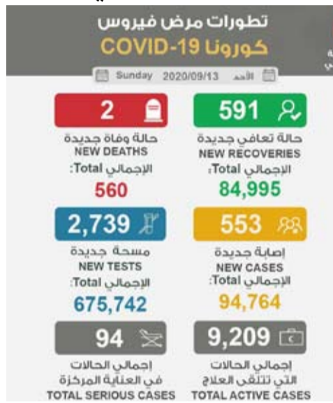
تطورات مرض فيروس كورونا يوم أمس

أعلنت وزارة الصحة الكويتية، أمس الأحد، تسجيل 553 إصابة جديدة بمرض كورونا المستجد (كوفيد-19) خلال الـ24 ساعة قبل الماضية. ليرتفع بذلك إجمالي عدد الحالات المسجلة في البلاد إلى 94764 حالة، في حين تم تسجيل حالتي وفاة إثر إصابتهما بالمرض، ليصبح مجموع حالات الوفاة المسجلة حتى أمس 560 حالة.