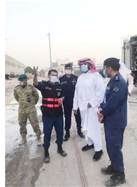
الشيخ طلال الخالد يتفقد موقع الحريق

مدير عام مديرية أمن محافظة العاصمة العميد عبدالله الفريخ خالد المكراد، ومساعد