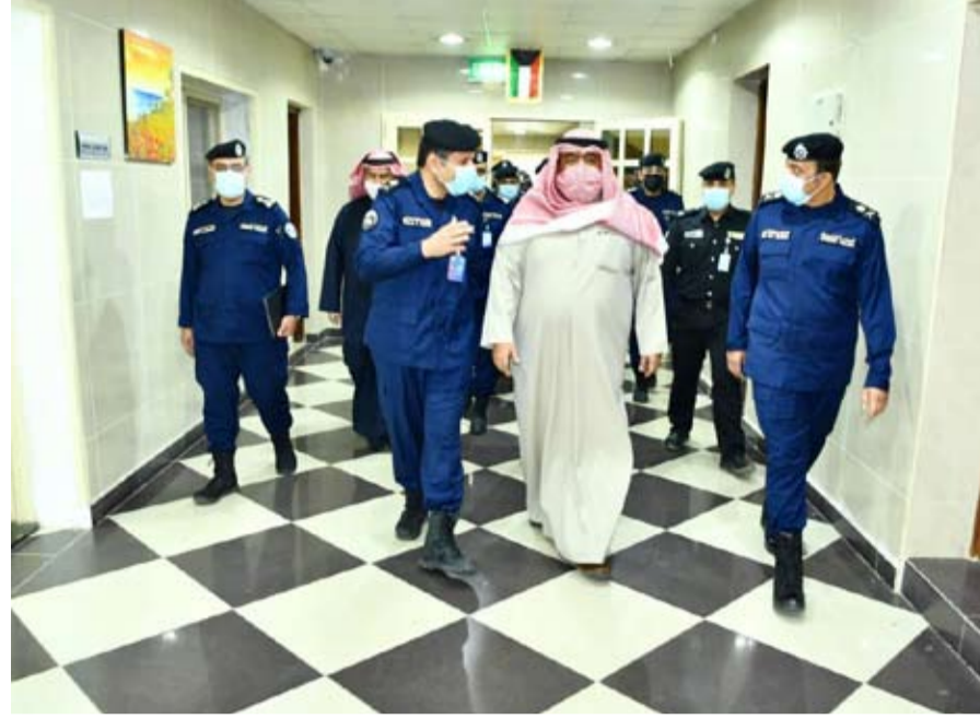
وزير الداخلية يقوم بجولة تفقدية داخل قطاع المؤسسات الإصلاحية وتنفيذ الأحكام

وشدد على مواصلة تلبية احتياجات النزلاء بشكل مستمر والإرتقاء بكل ما من شأنه تأهيل وتدريب النزلاء والنزليات ليصبحوا أفراداً صالحين في المجتمع وتعزيز التعامل الإنساني مع ضرورة تشديد الإجراءات الأمنية داخل السجن.