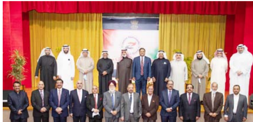
قيادات جمعية النجاة الخيرية مع السفير الهندي ورجال الأعمال