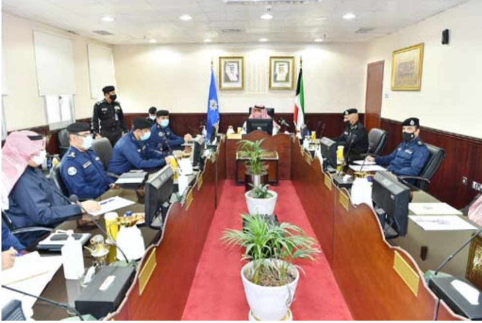
الشيخ ثامر العلي خلال اجتماعه مع قيادات في قطاع المؤسسات الإصلاحية وتنفيذ الأحكام