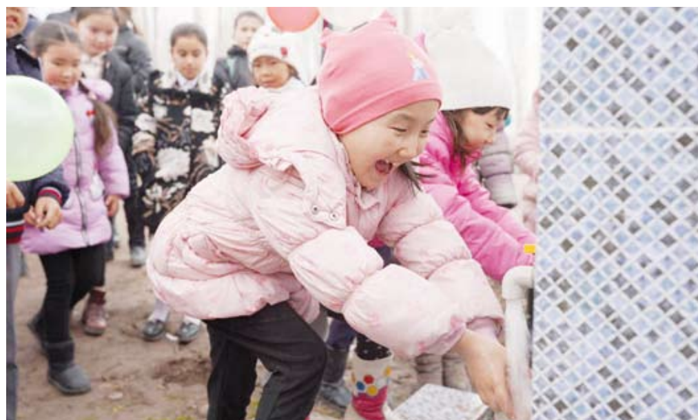
فرحة الأطفال بمشروع المياه