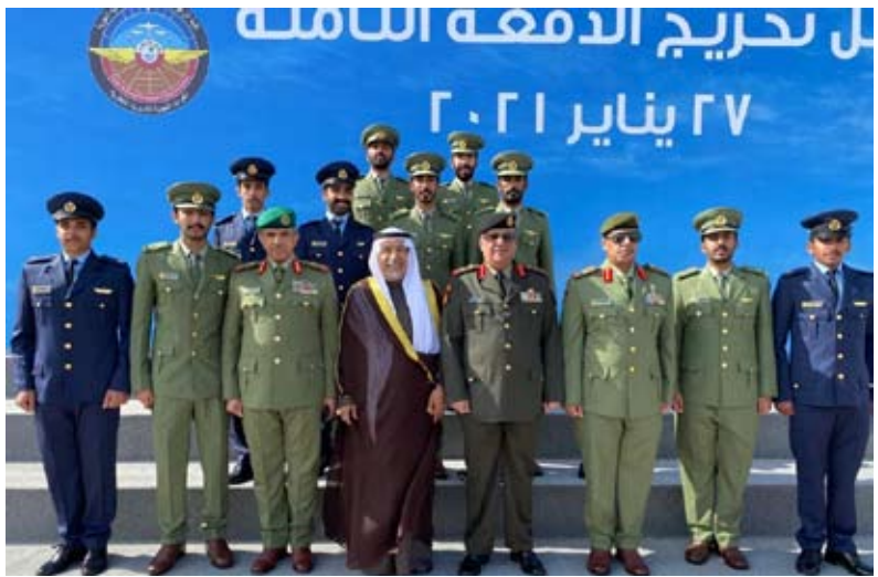
سفير الكويت لدى قطر حفيظ العجمي واللواء الركن فالح شجاع والعقيد الركن ناصر الحجيلي مع الطلبة الخريجين

تخرجه ضمن الـ 10 الأوائل على الدفعة. وذكر أنه اليوم الخميس سيتخرج أيضاً 16 طالب ضابط من منتسبي الحرس الوطن الكويتي ضمن الدفعة الـ 16 من كلية أحمد بن محمد العسكرية في قطر. وأشاد بالعلاقات المتميزة القائمة بين الكويت وقطر في جميع المجالات وبخاصة في مجال التدريب والتطوير العسكري وتبادل الخبرات وتعزيز الامكانيات العسكرية للبلدين الشقيقين. وحضر حفل التخرج السفير الكويتي لدى قطر حفيظ العجمي ورئيس وفد الرئاسة العامة للحرس الوطني الكويتي اللواء الركن فالح فالح.