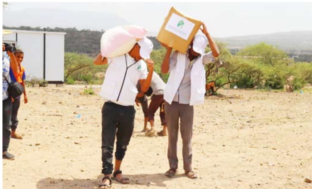
توزيع السلال الغذائية على المحتاجين

وتابع مدير عام الهيئة الخيرية قائلاً: رغم الصعوبات التي واجهتنا في مختلف دول العالم بسبب إجراءات درء خطر الوباء وسياسة الإغلاق والحظر التي اتبعتها تلك الدول فقد تجاوزنا وتجاوزنا العديد من التحديات وحرصنا على الوصول إلى المحتاجين والمعوزين الأشد حاجة، واتبعنا في جميع مراحل تجهيز السلال واعدادها الإرشادات والإحتياجات الصحية والحصول على التراخيص اللازمة من حكومات تلك الدول للسماح بالتوزيع أثناء الحظر وبإشراف مظهرها في بعض الدول. وأضاف: كما كان يتم التوزيع بحضور ممثلين عن سفاراتنا بالخارج ومشاركة الجهات الخيرية الشريكة ومسؤولين حكوميين، مشيراً إلى أنهم أشادوا بالجهود الإنسانية المستمرة لدولة الكويت ومؤسساتها الخيرية، والتي لم تتوقف يوماً ما حتى في أحلك الظروف. وتوجه م. السميطة بالشكر الجزيل لأهل الخير في الكويت الذين لم تمنعهم