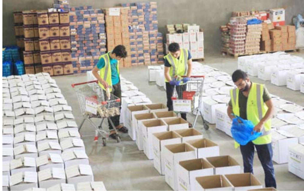
تجهيز السلال الغذائية

وأوضح م. السميطة أن الهيئة نفذت هذا المشروع في 22 دولة وفق خطة مدروسة بعناية، منها دول يعاني أهلها تداعيات النزاعات والحروب مثل فلسطين واليمن والصومال وسوريا والعراق وبورما، ودول تؤولي اللاجئين من جراء الاضطهاد والحروب كالاردن ولبنان وتركيا وبنغلاديش، ودول تحتضن مكاتب الهيئة مثل باكستان