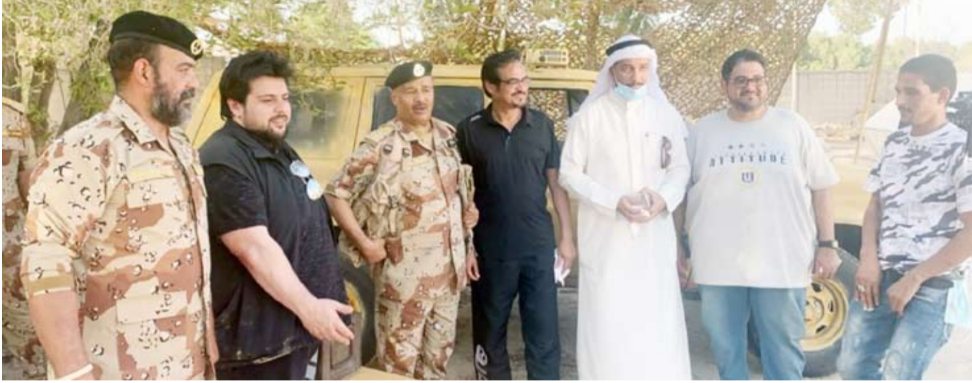
جانب من تصوير فيلم «معركة الجسور»