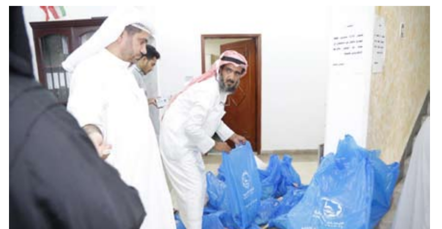
توزيع لحوم الأضاحي العام الماضي

مبيئاً أن أسعار الأضاحي تتفاوت حسب نوعيتها، فهناك الأضحية العربية وتبلغ قيمتها 100 دينار والأسترالي بـ 70 والهجين بـ 85 ديناراً هذا وتحرص اللجنة على اختيار الأضاحي المستوفية للشروط الشرعية، ونقوم في زكاة سلوى بالإشراف المباشر على الذبائح وتجهيزها وتقديمها للمستحقين داخل الكويت.