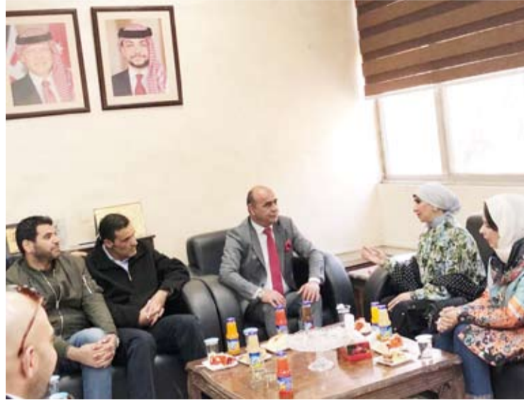
المحمد خلال لقائها بعض المسؤولين في «أمانة عمان»