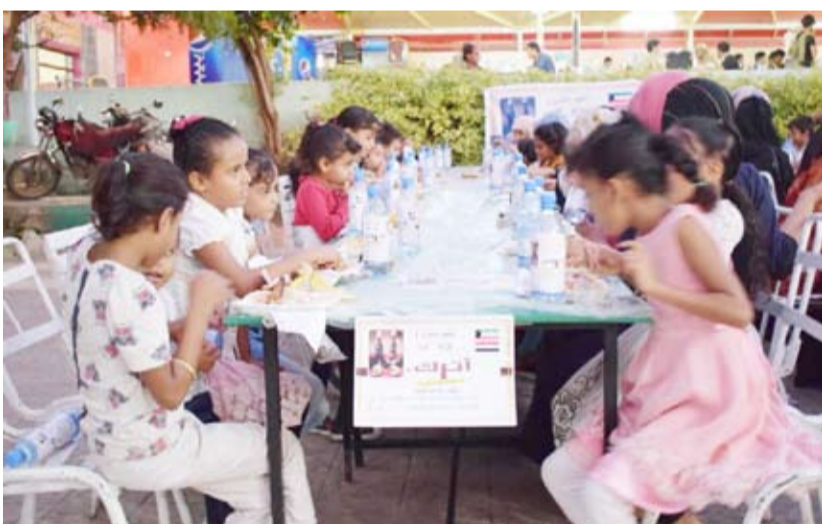
تقديم الطعام لأيتام