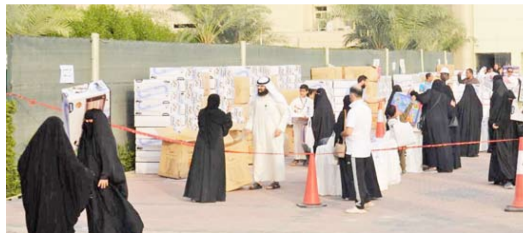
توزيع المساعدات على الأسر المتعفة