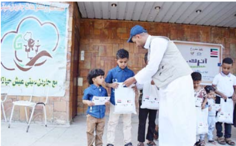
توزيع الهدايا على الأيتام