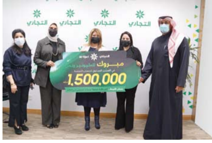
جانج من الاستقبال

وأضافت المسلم بأن الفرصة ما زالت متاحة أمام عملاء البنك التجاري لمضاعفة فرصهم والفوز بجوائز حساب النجمة للعام 2021 حيث يقدم الحساب جوائز أسبوعية بقيمة 5 آلاف دينار كويتي وشهرية بقيمة 20 ألف دينار كويتي ونصاف سنوية بقيمة 500 ألف دينار كويتي، بالإضافة إلى أكبر جائزة مصرفية في العالم مرتبطة بحساب مصرفي وباللغة 1.5 مليون دينار، منوهة في هذا الصدد أنه يمكن للعميل فتح حسابه مباشرة عن تطبيق البنك CBK mobile واستلام بطاقة السحب والتحويل إلى حسابه دون الحاجة إلى زيارة الفرع.