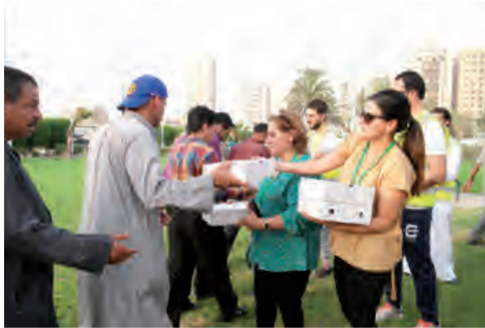
جانب من الحملة

الدولي (القادمون) خلال عطلة عيد الفطر السعيد، بالإضافة إلى الخدمات المقدمة عن طريق مركز الاتصال (8882251-1) والذي يستقبل اتصالات العملاء على مدار الساعة ويقوم بالرد عليها في أسرع وقت، كما يوفر البنك أيضاً فريق عمل مؤهل للرد على استفسارات العملاء من خلال تواصلهم عبر صفحة البنك على مواقع التواصل الاجتماعي وكذا على رقم خدمة الواتساب (50888225). بالإضافة إلى ذلك، فإن أجهزة السحب والإيداع الألي التابعة للبنك التجاري والتي تتوفر بمختلف مناطق الكويت تلبى احتياجات العملاء طوال الوقت، كما يمكن للعملاء إجراء معاملاتهم المصرفية عبر تطبيق التجاري CBK Mobile، أو المواقع الإلكترونية www.cbk.com و online.com وقمنا وأيضاً شاءوا.