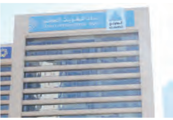
سيتم سداد التمويل على دفعة واحدة في نهاية مدة التمويل

أبرم بنك الكويت الدولي، اتفاقية تمويل مرابحة مشترك مع مجموعة من البنوك العالمية والمحلية بقيمة 250 مليون دولار لمدة 3 سنوات. وأوضح البنك في بيان للبورصة الكويتية، أمس الأربعاء، أن التمويل سيساعد في تعزيز السيولة على المدى الطويل والمتوسط وتحسين التركيز المالي للدواع على لدى البنك.