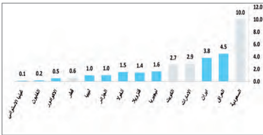
حصص الدول الأعضاء في الأوبك

أسعار خام برنت ارتفعت بوتيرة أقل بنسبة 7.3 بالمائة