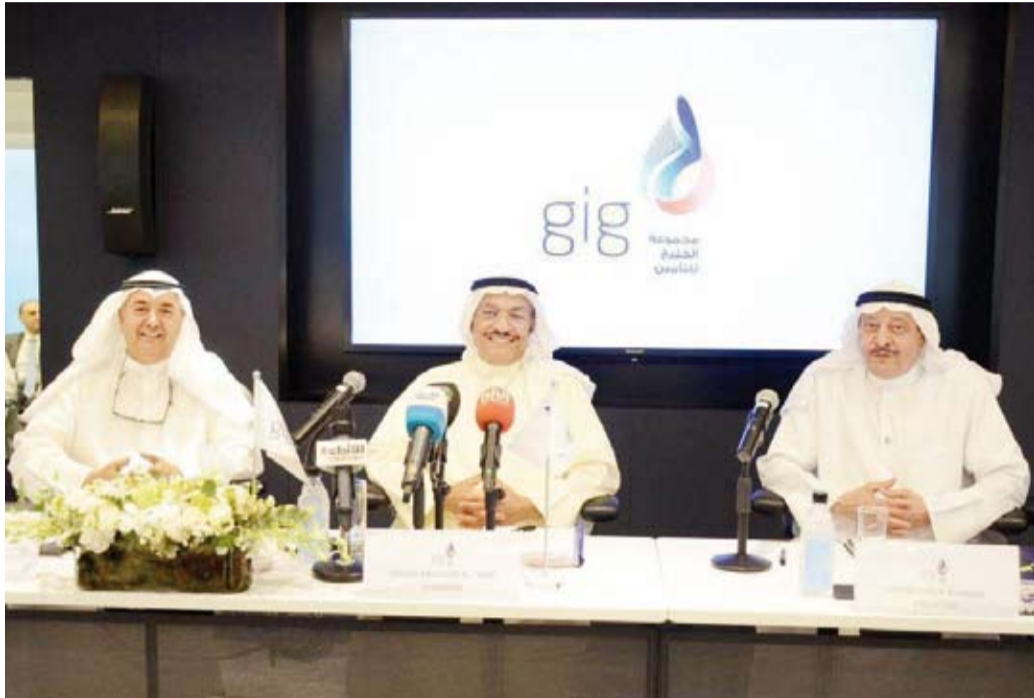
اجتماع سابق للشركة

أعلنت مجموعة الخليج للتأمين اكتمال عملية الاكتتاب العام في أسهم زيادة رأسمال الشركة، وإقبال باب الاكتتاب بنهاية 14 يناير الجاري. وحسب بيان المجموعة لبورصة الكويت أمس الأحد، فقد تم الاكتتاب في كامل أسهم الزيادة المصدرة بـ 14.2 مليون سهم عادي، بقيمة إجمالية 7.1 مليون دينار. وبيعت الخليج للتأمين أن قيمة الإصدار شملت 1.42 مليون دينار قيمة اسمية، فضلاً عن علاوة إصدار بـ 5.68 مليون دينار، منوهة بأن عوائد الإصدار سوف تنعكس على البيانات المالية المرحلية للشركة المنتهية بـ 31 مارس 2021. وكانت المجموعة أعلنت تمديد فترة الاكتتاب العام في أسهم زيادة رأسمال الشركة، ليصبح تاريخ إقفال باب الاكتتاب في 14 يناير الجاري، بدلاً من 31 ديسمبر الماضي. وارتفعت أرباح مجموعة الخليج للتأمين بنسبة 22.4% في السنة أشهر الأولى من العام الجاري، لتصل إلى 13.1 مليون دينار، مقارنة بصافي ربح قدره 10.7 مليون دينار لنفس الفترة من عام 2019.