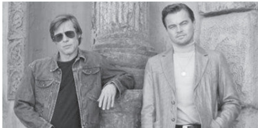
براد بيت وليوناردو دي كابريو

اعتاد نجوم هوليوود على أن تحيطهم الشائعات ويتم تداولها بكثافة خاصة عبر مواقع التواصل الاجتماعي المختلفة، وكان أبرزهم خلال الفترة الماضية هم نجمي هوليوود براد بيت وليوناردو دي كابريو، واليوم نستعرض أكثر الشائعات التي انتشرت حولهما التي أثار الجدل.