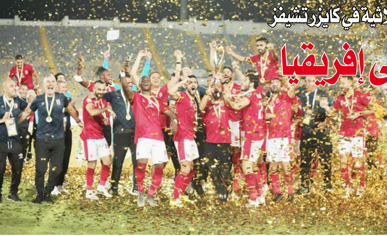
جانب من تتويج النادي الأهلي

السوبر الأفريقي - رقمه القياسي العاشرة في تاريخه، مقابل 5 ألقاب ومانيمبي الكونغولي، وبلغ الأهلي المباراة النهائية للبطولة 14 مرة في تاريخه، ونال الوصافة في 4 مناسبات.