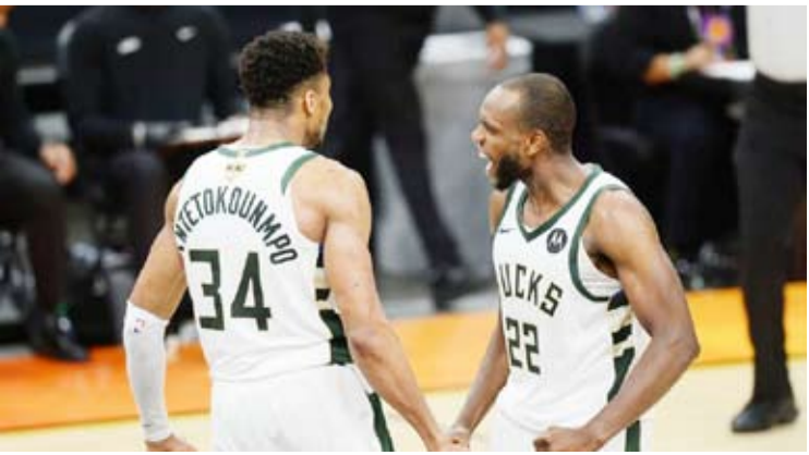
لظة من مباراة ميلووكي باكس فينيكس صنز

2-3، على غرار ما فعله ضد بروكلين نتس وأتلانتا هوكس في الدورين السابقين. وكانت الأفضلية لصالح صنز ونجمه كريس بول في الربع الأول حيث ضرب بقوة وحسمه في صالحه بفارق 16 نقطة (37-21)، لكن باكس سرعان ما استعاد توازنه في الثاني ورد بفارق 19 نقطة (43-24) لنهي الشوط الأول في صالحه 64-61. وواصل الضيوف تفوقهم في الربع الثالث وكسبوه 36-29 موسعين الفارق إلى 10 نقاط (100-90). وحاول صنز العودة في النتيجة في الربع الأخير وكان قاب قوسين أو أدنى من تحقيق مبتغاه لكن هوليديا وأنتيتو كونيومو أحبطا آماله في الفواني الأخيرة.