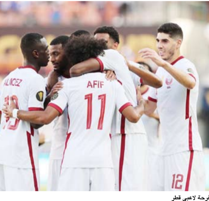
فرحة لاعبي قطر