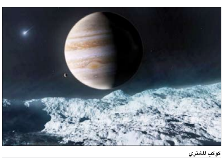
كوكب المشتري قامت "ناسا" مؤخراً بتمديد عمر مهمتهم من مهمات استكشاف الكواكب، بما في ذلك مهمة جونو إلى كوكب المشتري، والأُن اكتشف جونو

حياة خارج كوكب الأرض، لكنه مذهل مع ذلك، بالنظر إلى أنها المرة الأولى التي تُكتشف فيها مثل هذه الإشارات من قمر سماوي. وتصادف أن المركبة الفضائية، التي تم إطلاقها في 2011، كانت تسافر عبر المنطقة القطبية لكوكب المشتري بسرعة 111.847 ميل في الساعة عندما عبر مصدر الراديو، المعروف باسم "انبعاث الراديو العشري"، أو ببساطة "واي فاي"، وشاهدت المركبة انبعاث الراديو لمدة خمس ثوان فقط، لكنها كانت كافية لتأكيد المصدر. ووفقاً لوكالة ناسا، فإن موجات الراديو العشرية لها ترددات بين 10 و40 ميغاهرتز، ولكنها لا تزيد عن 40 ميغاهرتز، وأضافت وكالة الفضاء: "يُعتقد أن الإلكترونيات المتصاعدة في المجال المغناطيسي لكوكب المشتري هي سبب الضوضاء اللاسلكية التي نسمعها". لقد عرف العلماء عن موجات الراديو على كوكب المشتري منذ منتصف الخمسينيات من القرن الماضي، ولكن هذه هي المرة الأولى التي تُشاهد فيها هذه الظاهرة متباعدة من قمر غانيميد.