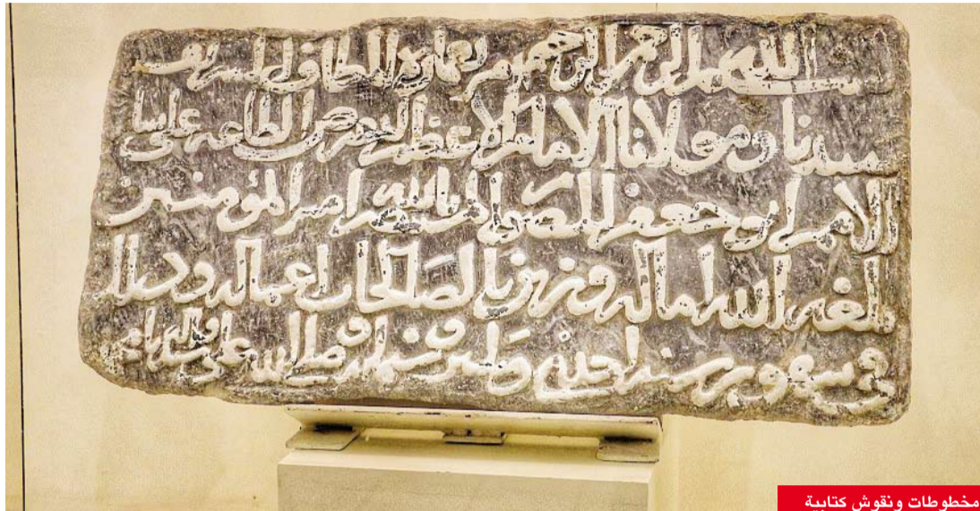
مخطوطات ونقوش كتابية

يعد معرض عمارة الحرمين أحد أهم المواقع البارزة بمكة المكرمة، فريد من نوعه، لاحتوائه مقتنيات للحرمين الشريفين على مر التاريخ وبعض العناصر المعمارية والنقوش الكتابية، ويمثل نقلة نوعية وحضارية وثقافية فريدة على مستوى العالم الإسلامي، كما أنه منبر تاريخي ثقافي يخدم المجتمع الإسلامي ويوسع آفاقه ومداركه المعرفية تاريخياً وثقافياً ولينقل للمجتمعات العالمية بشكل عام تاريخ وحاضر الحضارة الإسلامية العريقة. ويعني المعرض الذي افتتحه الأمير عبدالمجيد بن عبدالعزيز (رحمه الله) نيابة عن خادم الحرمين الشريفين الملك فهد بن عبدالعزيز (رحمه الله)، في الخامس والعشرين من شهر شوال لعام 1420 هـ، بشكل خاص بالحرمين الشريفين والتطور الذي شهدته عمارتهما على مدى العصور، حيث يتكون من سبع قاعات تشتمل على مجسمين للحرمين الشريفين وعدد من المقتنيات المختلفة من مخطوطات ونقوش كتابية وقطع أثرية ثمينة ومجسمات معمارية وصور فوتوغرافية نادرة. كما يشتمل على سبع قاعات توجد بها مقتنيات وصور تمثل جزءاً وثيقة من التاريخ الإسلامي وبه مجسم للمسجد الحرام وساحاته وأروقته، وكذلك صور قديمة للحرمين الشريفين وسلم خشبي كان يستخدم للدخول إلى الكعبة المشرفة يعود تاريخه لعام 1240هـ/1824م. فيما يتضمن العديد من مقتنيات الكعبة المشرفة، ومنها نماذج للكسوة قديماً ولستارة الكعبة، ويضم عدداً كبيراً من الصور النادرة للحرمين الشريفين، بالإضافة إلى المخطوطات التي تحتوي على نسخ مصورة من المصحف العثماني.