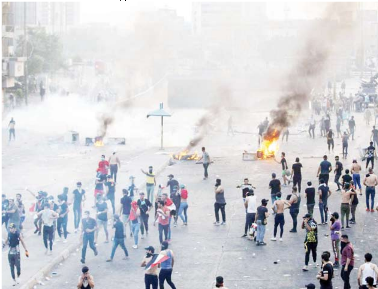
شغب في العراق

من فصائل الحشد، بعد تكرار التهديدات والهجمات للمقرات الدبلوماسية والسفارات، ما أثار غضب الحشد، بل أدى إلى شجار داخل البرلمان، الأربعاء الماضي، بين نواب مؤيدي للحشد وأكرا. كما طالب عدد من هؤلاء النواب الحزب الديمقراطي الكردستاني بالاعتذار. يذكر أن العراق شهد خلال الأشهر الماضية، عدة هجمات وتهديدات طالت بعثات دبلوماسية عراقية في العراق، تابعة للحزب الديمقراطي الكردستاني.